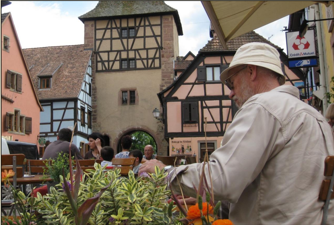
På café i Turckheim

Campingpladsen i Turckheim, som vi gerne ville have kigget på, er lukket i år pga. reovering – jeg mener, vi har boet der engang for mange, mange år siden. En slentretur gennem byen bliver det også til. Også her er der gang i reovering på byens hovedgade, man er ved at lægge nye brosten. Der er ikke ret mange mennesker (endnu?). På hjørnet over for byporten slår vi os ned uden for en salon de the og får os en café + to gange mango-juice. Det er ret så varmt efterhånden.