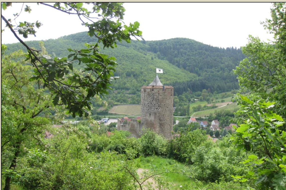
Kaysersberg overrages af en borgruin, som her ses oppefra. Vi er begyndt på nedstigningen og dermed afslutningen af vores vandretur