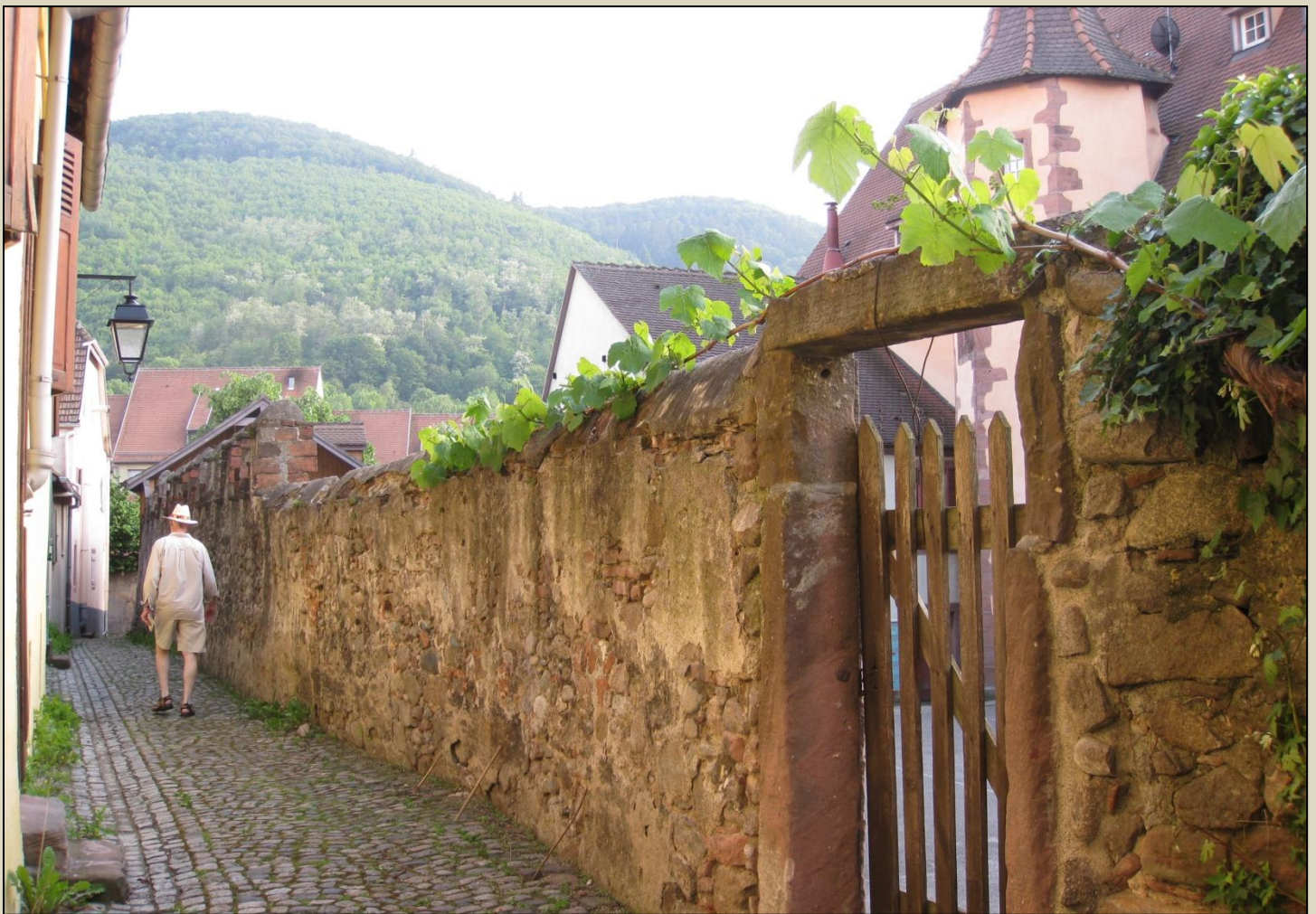
Kaysersberg "på bagsiden" – her kommer turisterne som regel ikke så tit.

Den varmeste forårsdag hidtil: 30 grader i skyggen! Hele campingpladsen vegeterer i alle de muligheder for skygge, der findes. Så det gør vi også. Herligt – men desværre lidt sent i vores forårstur, øv. I morgen skal vi videre til Mörsch og derefter hjem. Men vi nyder altså denne her helt uventede varme og udskyder vores planlagte bytur til senere på eftermiddagen. På turistkontoret fik vi for nylig nemlig en brochure med beskrivelsen af en historisk rundgang. Den vil vi gerne gå. Vi overraskes over, at der nu, ved 18.30 tiden, ikke er særligt mange mennesker i byen længere og gætter på, at det er fordi forretningerne er ved at lukke. Ærgerligt, noget af den levende stemning mangler.