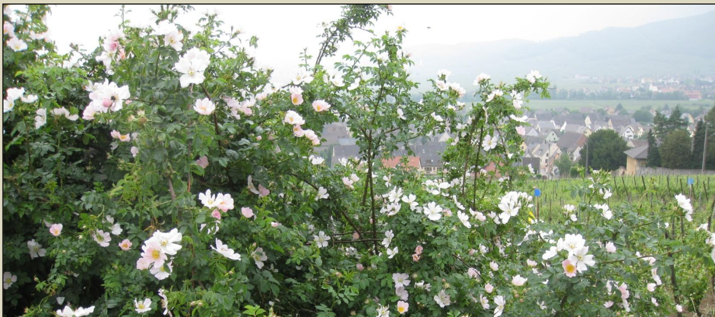
Motiv fra Kaysersbergs omegn