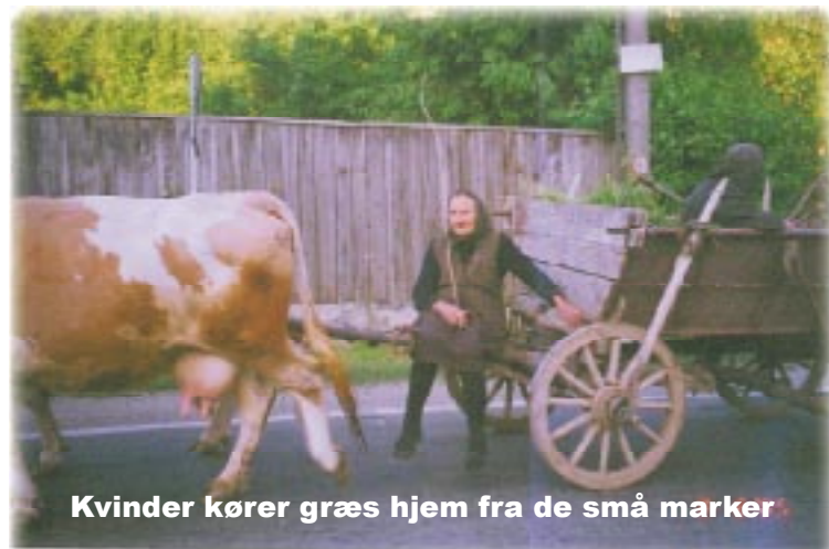
Kvinder kører græs hjem fra de små marker

Ved husene langs vejen sad familier og hyggede sig omgivet af høns, kyllinger, ænder, ællinger, gæs og kalkuner, der fandt føden i vejgrøften. Folk så ud til at være tilfredse trods de små kår. I en lille by, Horezu, var der et årligt keramikmarked, hvor de solgte mange fine ting. Vi mødte mange, der var ude at køre søndagstur med hele familien, og det foregik enten med heste eller køer som rækraft.