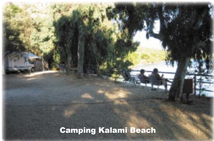
Camping Kalami Beach

Nå, men vi skulle jo videre. Skulle vi tage færgen til Italien fra Igumenitsa, eller skulle vi køre gennem Bulgarien og Rumænien. Vi fandt ud af, at oversvømmelserne i Rumænien var værst i det østlige område omkring Bacau og Galati.