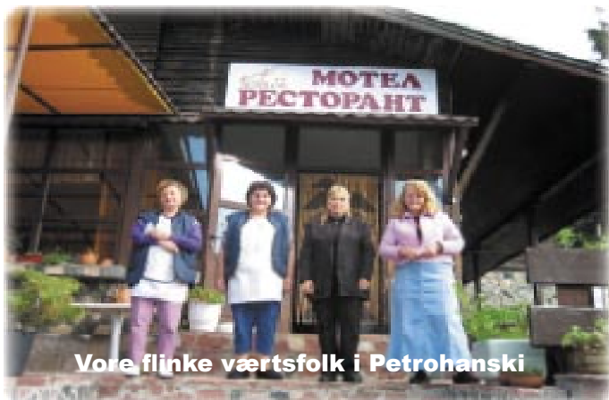
Vore flinke værtsfolk i Petrohanski

Vi kørte nordpå ad E79 til Sofia, og vi havde bestemt, at tage den vestligste grænseovergang mellem Bulgarien og Rumænien, så vi tog ringvejen uden om Sofia og vej 81 mod Rumænien. Ad den vej tror vi ikke, der kommer mange turister, for vi så ingen. Vi havde læst,