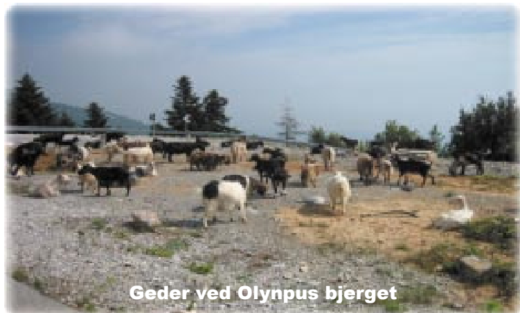
Geder ved Olympus bjerget

Fra Leptokaria tog vi en lille vej mod vest op forbi Olympus bjerget i skarpe hårnålesving og med gedeflokke og skildpadder på vejen. Der