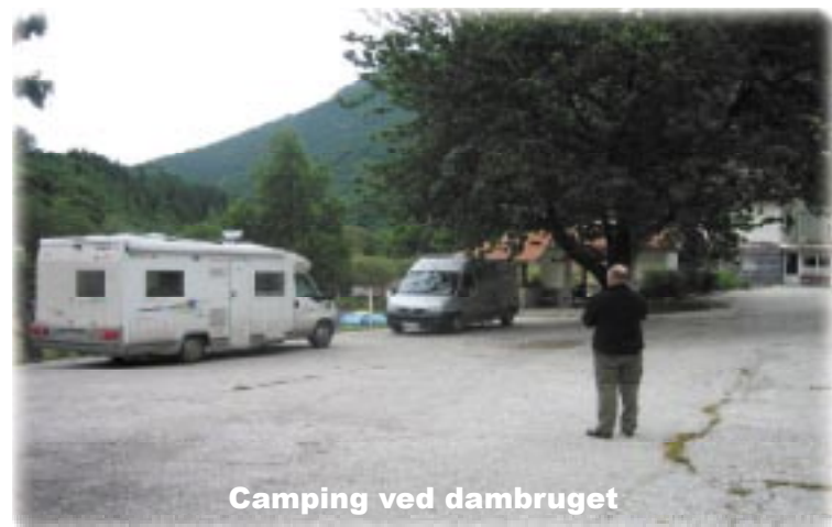
Camping ved dambruget

Vi nåede Rila klosteret, som er et imponerende bygningsværk med Marie kirken i midten. Den er helt overdådigt udsmykket med ikoner og masser af guld. Et museum med flotte håndarbejder, billeder der var syet, tøj med guldbroderi og perleagramaner af bittesmå perler. Det er et sted man skal se. Da vi kørte op mod klosteret, kørte vi forbi et sted, hvor der stod et campingskilt - der kørte vi tilbage til. Det var