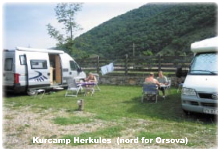
Kurcamp Herkules (nord for Orsova)

Her fandt vi en, efter Rumænske forhold, rigtig god campingplads med varm bruser og restaurant. Værten, som er tysker og meget flink, bød på en "palinga" (rumænsk brændevin) som velkomstdrink. Vi blev der tre nætter og spiste i restauranten en enkelt gang, (ungarsk gullash med pasta) og vin for danske kr. 40.00 pr. person Kørt 338 km, overnatning 400.000 Lei pr. nat