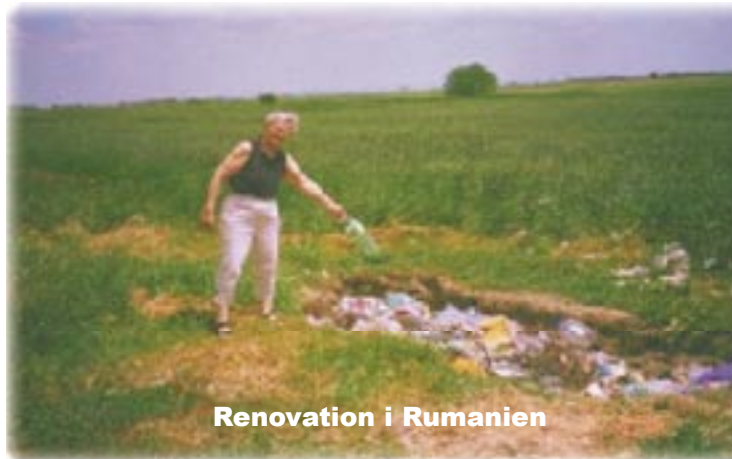
Renovation i Rumænien