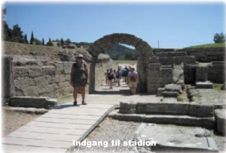
Indgang til stadion