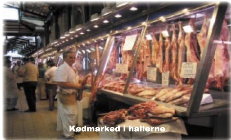
Kødmarked i hallerne

Campingpladsen her er god for besøg i Athen, så vi tog bussen til metrostationen, og metroen til Akropolis, som absolut er et besøg værd. Her kan bruges lang tid, hvis man vil se det hele, og sikken udsigt der er ud over millionbyen Athen. Vi gik op til markedshallerne, og det var