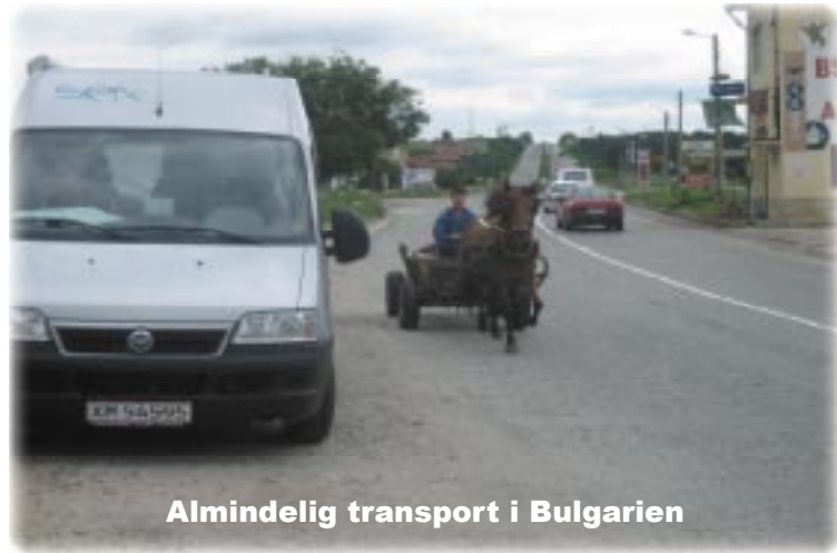
Almindelig transport i Bulgarien

Fortsatte ad E85 til Kazanlak, det første stykke var fladt landbrugsland med majs, hvede og solsikker og en god vej. Efter Veliko Tarnovo gik