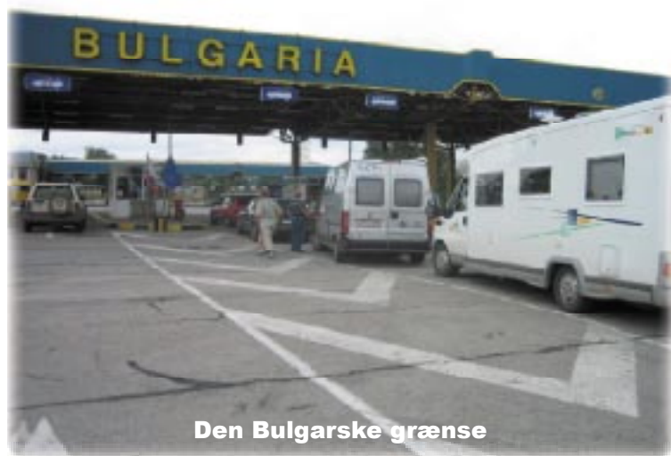
Den Bulgarske grænse

På vores kort så det ud til, at hovedvejen gik lige og direkte gennem byen; men godmorgen - vi kom ind i et mylder af trafik, som kom fra både syd, nord, øst og vest. Færdselsregler var en by i Rusland, så vi lærte at slå katastrofeblinket til og så stoppe (selv om det f.eks. var midt i en rundkørsel), indtil vi var nogenlunde sikre på i hvilken retning vi skulle køre. Det tog 3 timer at køre gennem Bukarest. Så kørte vi i fladt landbrugsland til Giurgiu ved Donau, der her danner grænse mellem Rumænien og Bulgarien.