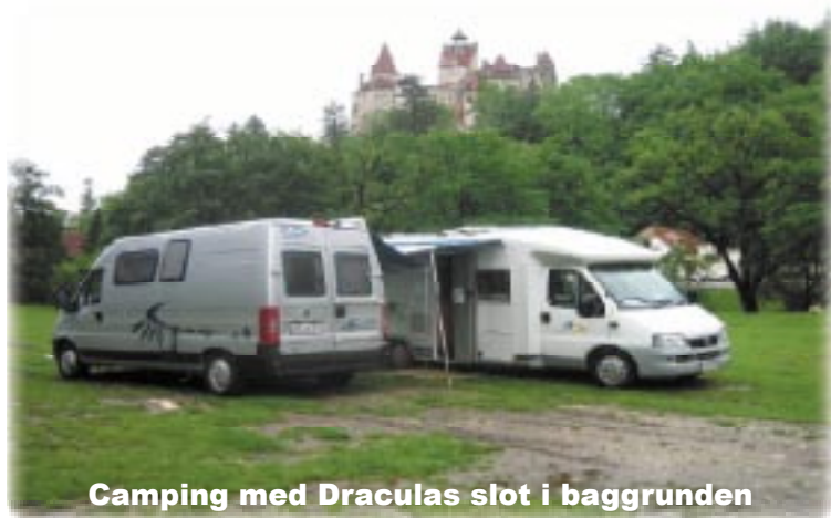
Camping med Draculas slot i baggrunden