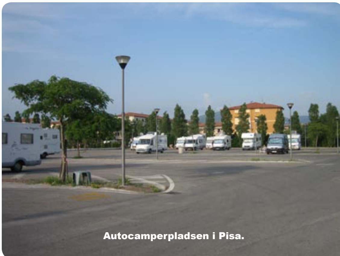
Autocamperpladsen i Pisa.