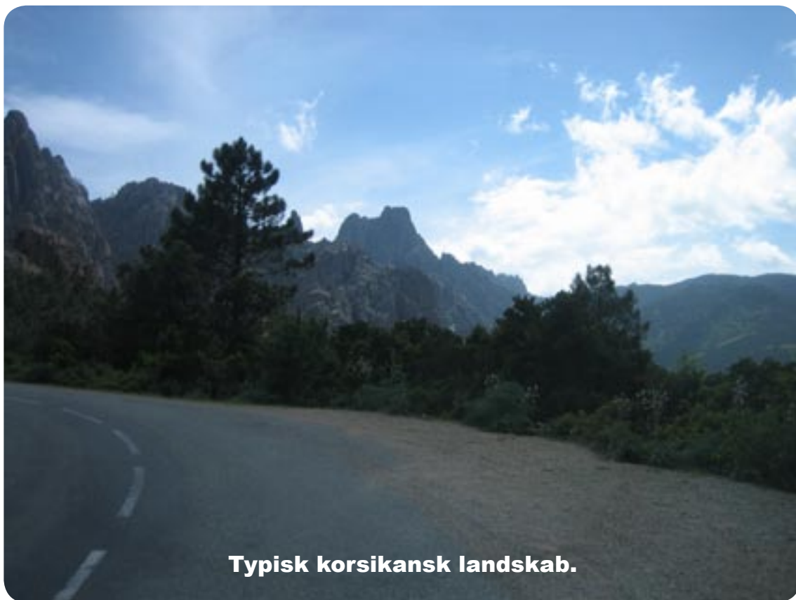
Typisk korsikansk landskab.

Næsten alle vejskilte her på de små veje er gennemhullet af riffelskud, vi kom over endnu et pas Col de Larone. Lidt efter gjorde vi holdt ved en flod, gik ned og satte os på en stor sten og nød vandets brusen og den flotte natur.