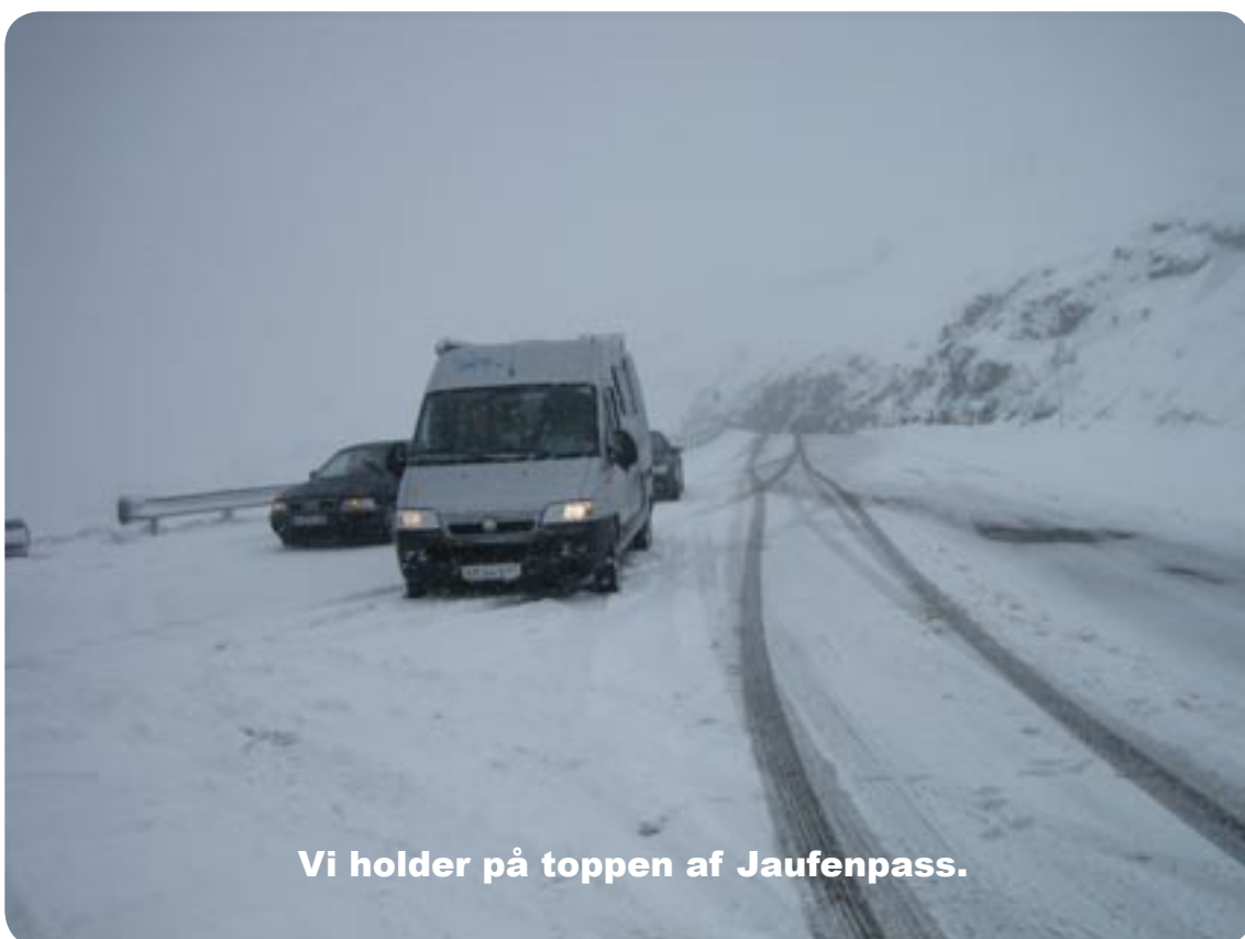
Vi holder på toppen af Jaufenpass.

Det gik langsomt frem, så kom sneploven imod os, det var en lettelse, da vi nåede toppen lå der ca. 10-15 cm sne.