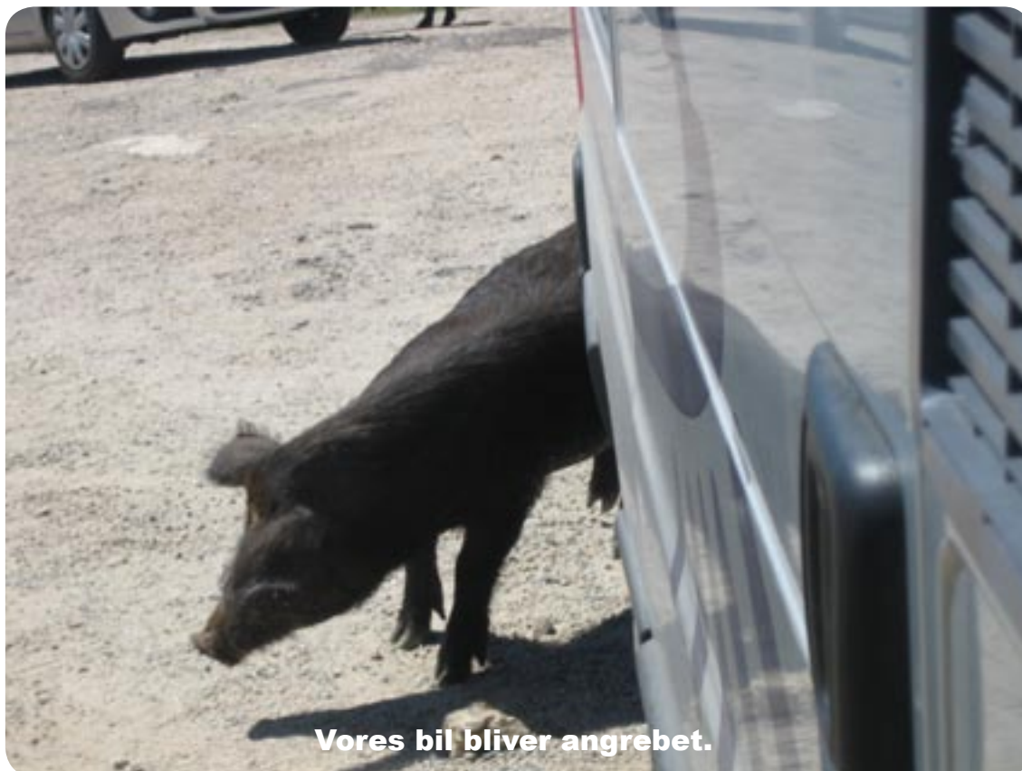
Vores bil bliver angrebet.

Men nu skulle der jo ske noget andet for den sorte orne, den gik til angreb på "sølvpilen", den