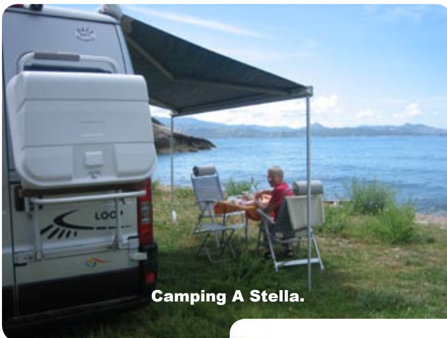
Camping A Stella.

I St. Florent gjorde vi holdt for at spise vores frokost, med udsigt til havnen, der er fyldt med lystbåde, men nu er både regn og torden nået her til vestkysten. Vi blev enige om at se det nordlige Korsika og tog vej D80 mod Cap Corse . Her er et område, hvor man dyrker vin, vi kørte ind til en vinbonde, han var glad for, at det regnede, de havde haft meget tørke, så vinstokkene sukkede efter vand. Vi købte 2 fl. sød muskatvin og 2 fl. rødvin (De har både god