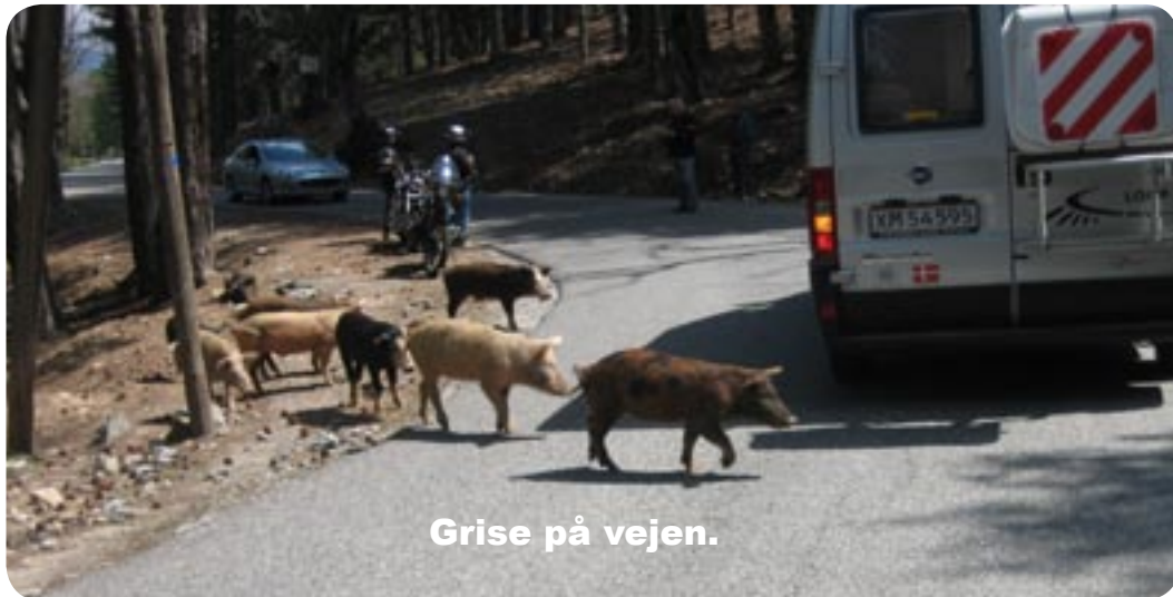
Grise på vejen.

På lange strækninger var der meget øde, der var langt mellem byerne og de fleste bestod kun af nogle få huse eller gårde med primitive huse til grise eller fjerkræ.