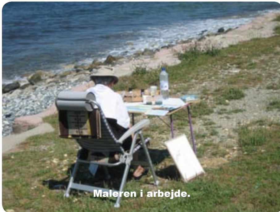
Maleren i arbejde.

rødvin og særdeles godt rosévin her på Korsika).