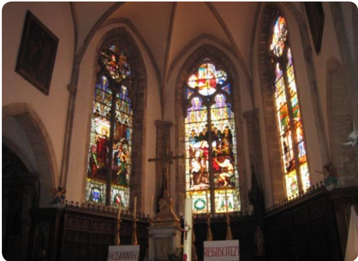
Kirken i Baume Les Dames pladsen.

Det blev ret hurtigt lunere i vejret, og her var et dejlig grønt græstæppe, så vi kunne ikke løsrive os, vi blev her en ekstra dag. Gik ned til en kanal, der løber lige neden for autocamper.