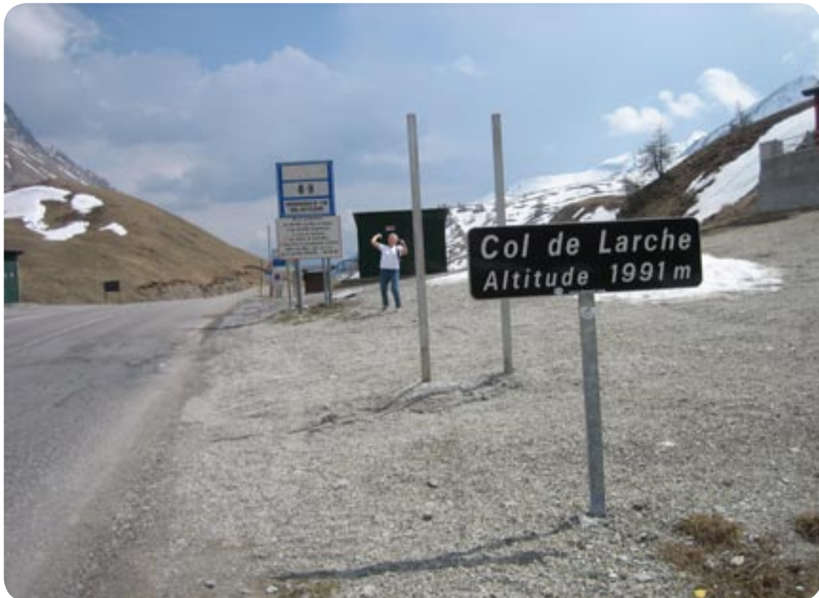
Grænsen mellem Frankrig og Italien.

Da vi kom længere ned af bjerget var der masser af træer med hvide blomster på skråningerne.