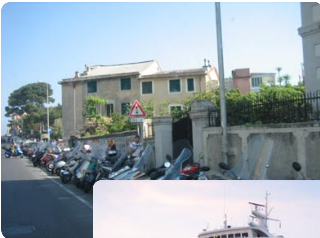
De små motorscykler er overalt.

Kørte fra Daiva Marina kl. 10.55, tog vej 1 sydpå gennem La Spezia som vi havde en meget snoet nedkørsel til. I området omkring Massa er der meget industri, hvor de laver marmor i forskellige tykkelser og former.