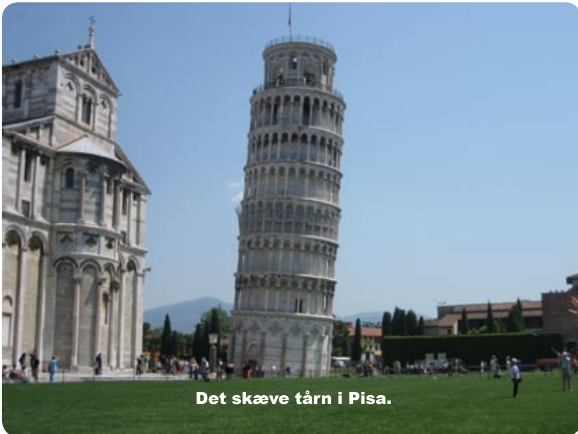
Det skæve tårn i Pisa.

Vi fortsatte til Pisa, vi havde set i Bord Atlas, at der skulle være en autocamperplads i Pisa. Vi fandt den let, den er skiltet godt af, den ligger rigtig godt for at gå ind til byen, fra pladsen er der ca. 10 min. gang til det skæve tårn, som vi kan se fra pladsen.