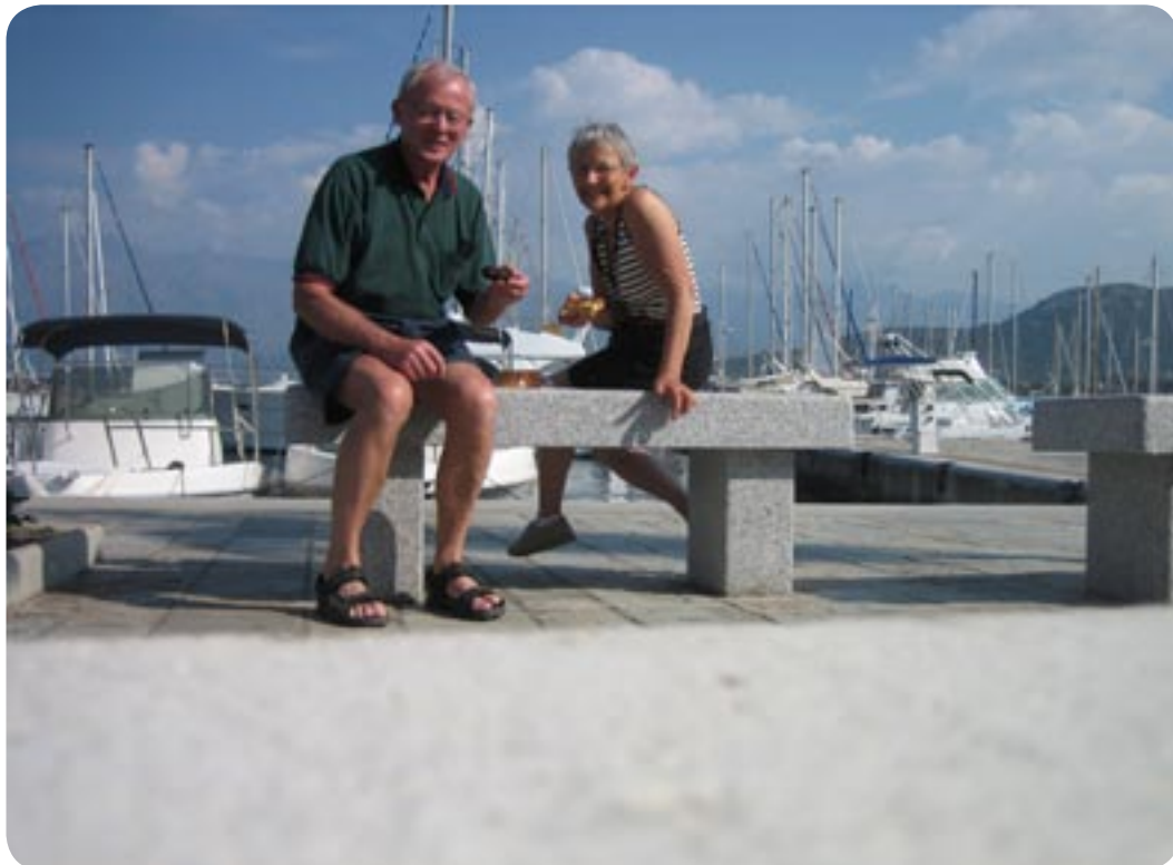
Vores kage nydes ved lystbåde havnen i Calvi.