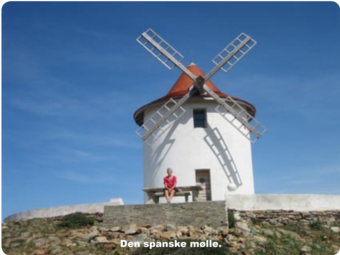
Den spanske mølle.

Vi fortsatte ad D 80 mod nord og øst, gjorde holdt ved en mølle i spansk stil, det så ud til at være fårenes og gedernes tilholdssted, deres delfoler lå ihvertfald overalt, den ligger meget højt med