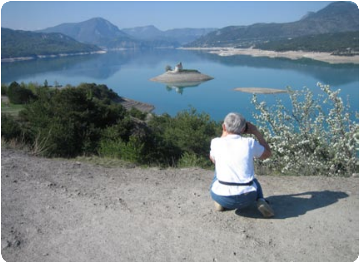
Lac de Serre Poncon med øen der spejler sig i søen.