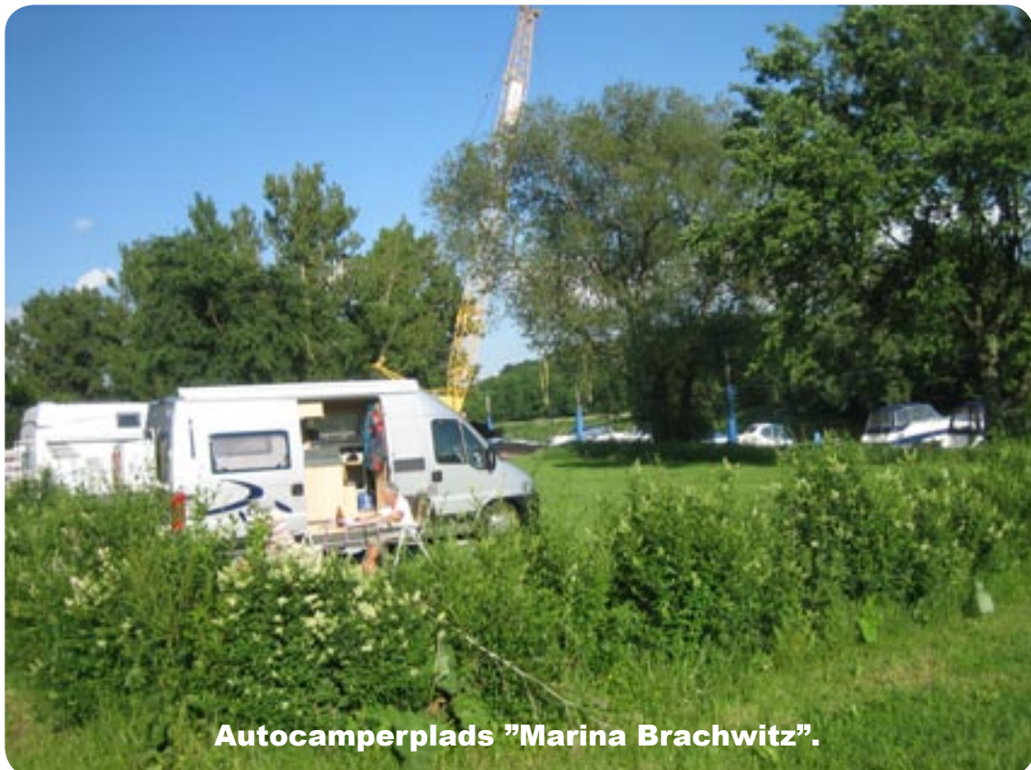
Autocamperplads "Marina Brachwitz".

Pladsen her er hyggelig; men ligger langt ude, her er ingen faciliteter nu, toiletterne er ude af drift.