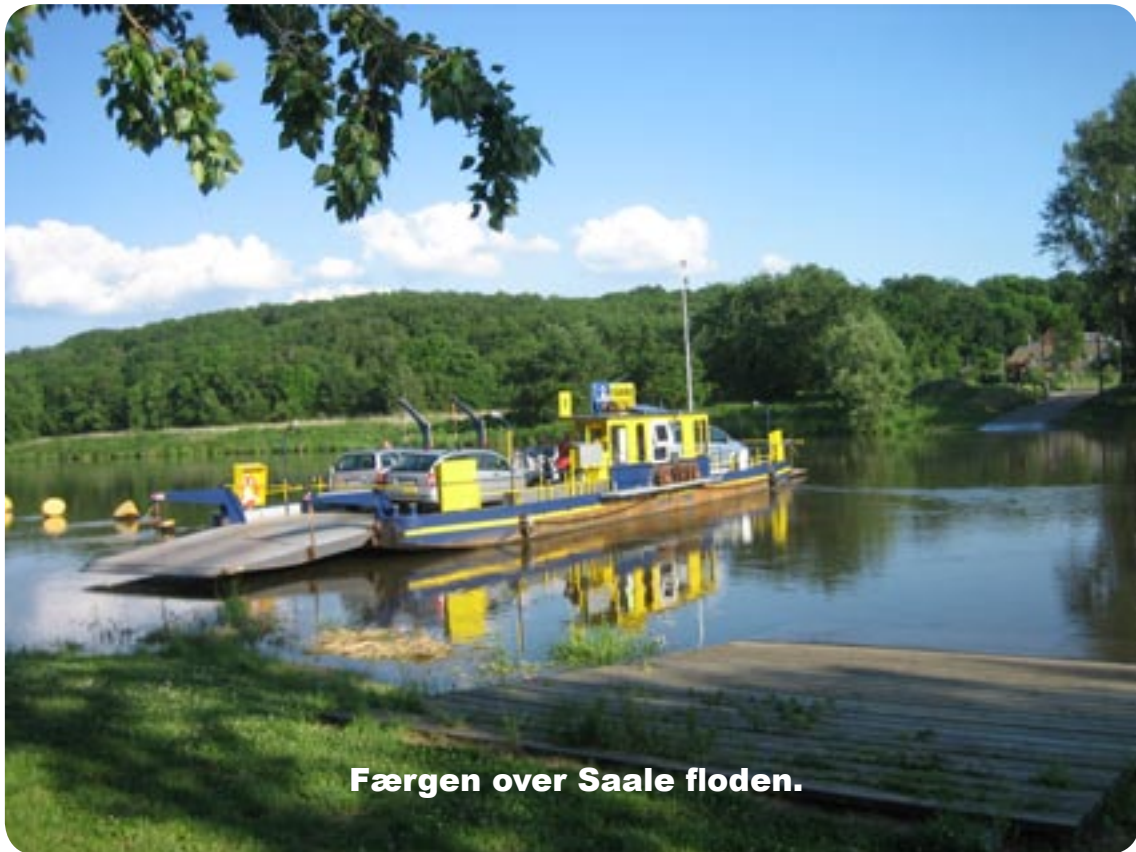
Færgen over Saale floden.