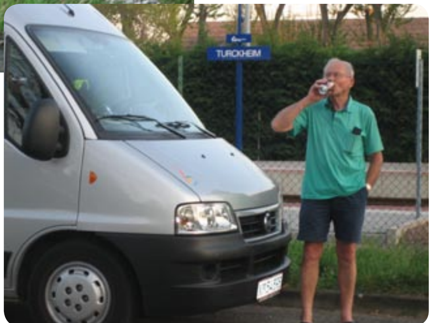
Autocamperplads i Turckheim