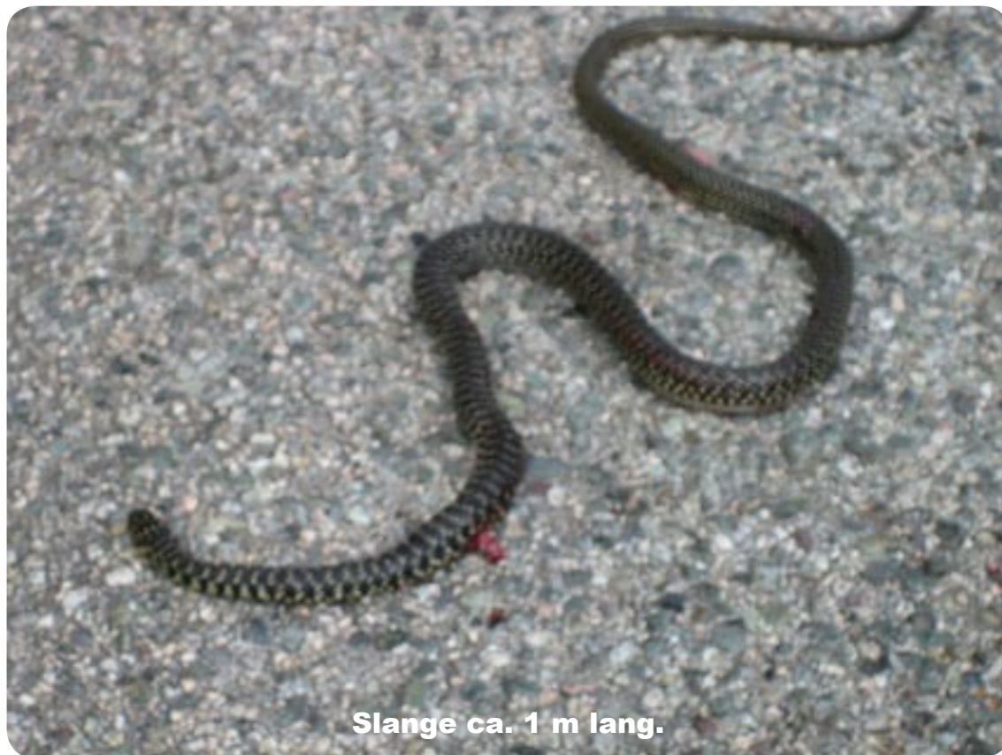
Slange ca. 1 m lang.

Vi ankom til Sartene, hvor vi har været i før, første gang så vi en butik med røgede specialiteter