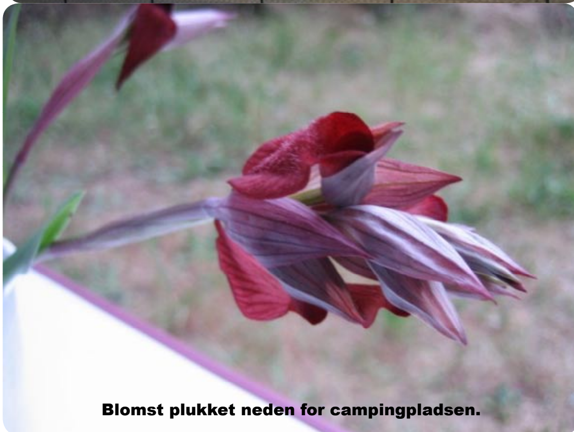
Blomst plukket neden for campingpladsen.