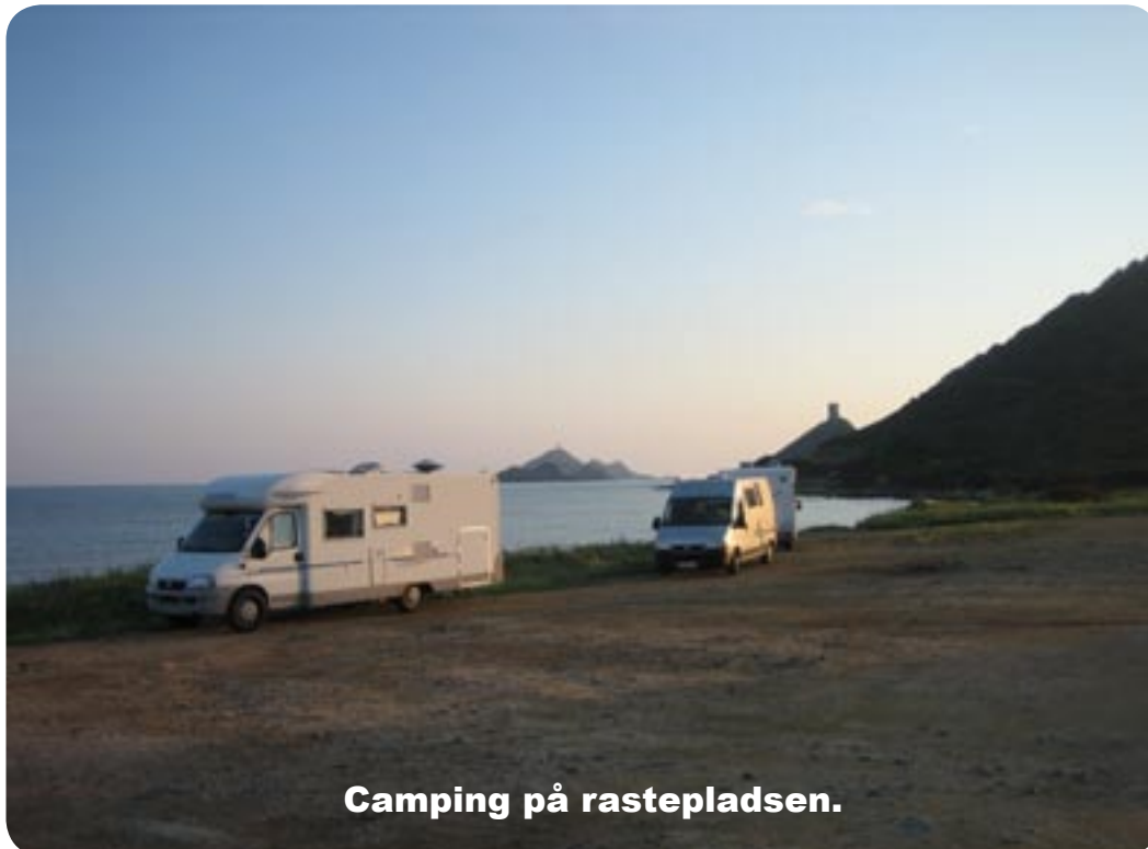
Camping på rasteplassen.

der kom 10 kunne det godt være at politiet dukkede op, den anden der holdt der var en østriger. Vi blev her.