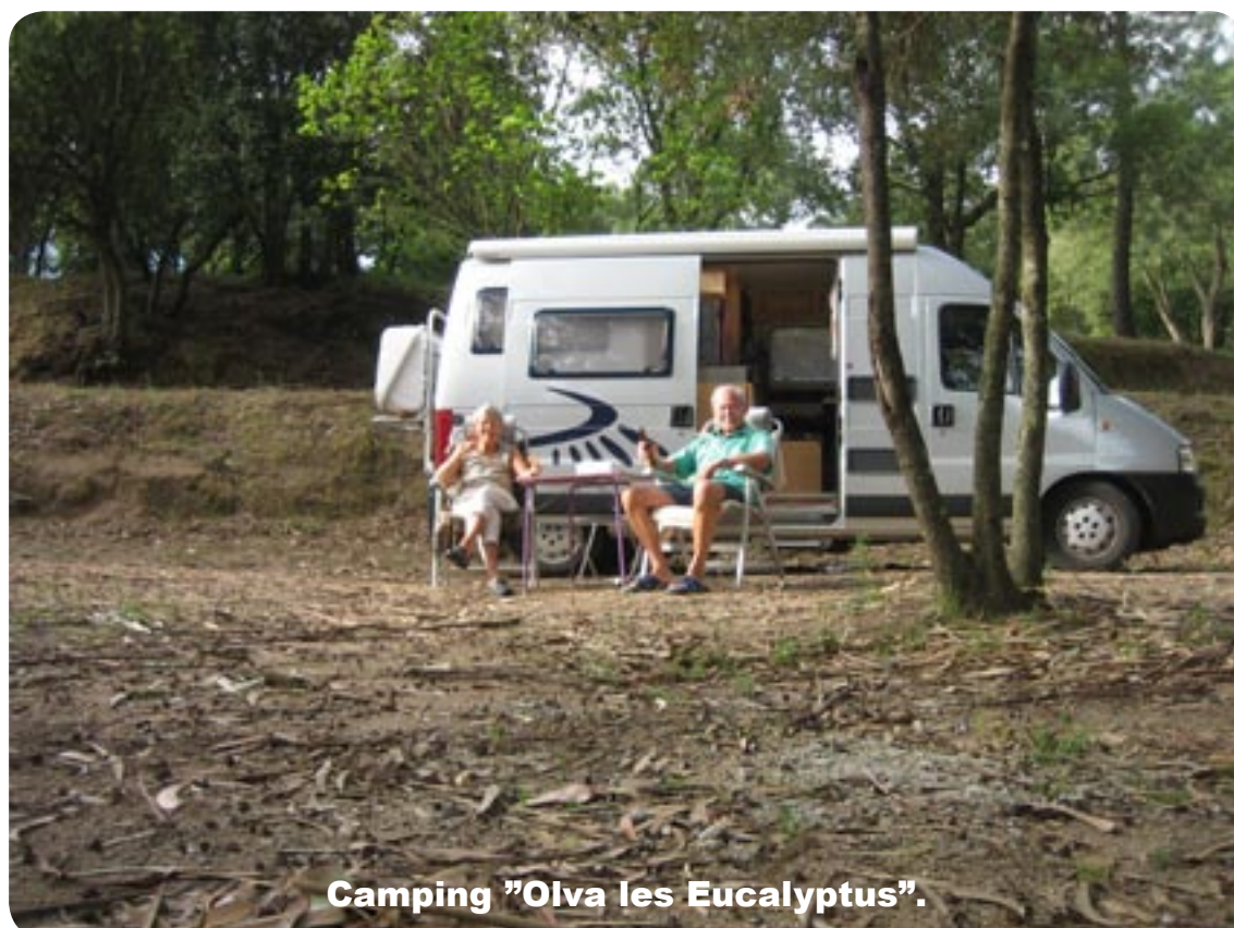
Camping "Olva les Eucalyptus".