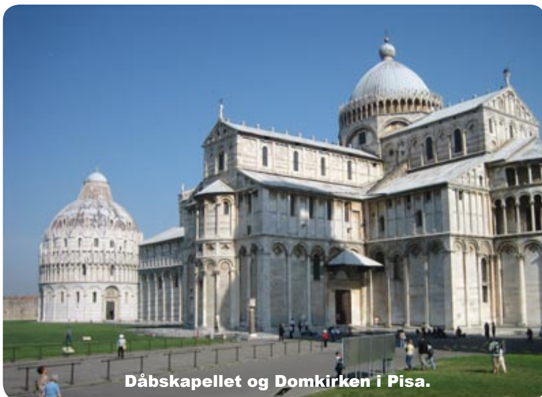
Dåbskapellet og Domkirken i Pisa.

Vi stod tidligt op fandt ud af, at der ikke var strøm på reservebatteriet, vi kunne ikke pumpe vand og måtte indstille os på at leve lidt primitivt, vand i dunke og kander.