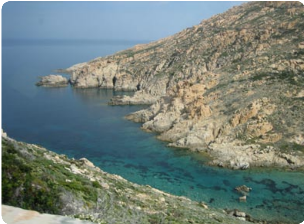
Typisk korsikansk landskab.

Vi fortsatte ad vej 197 forbi l'Île-Rousse, til tider med storslået udsigt over middelhavet til Calvi.