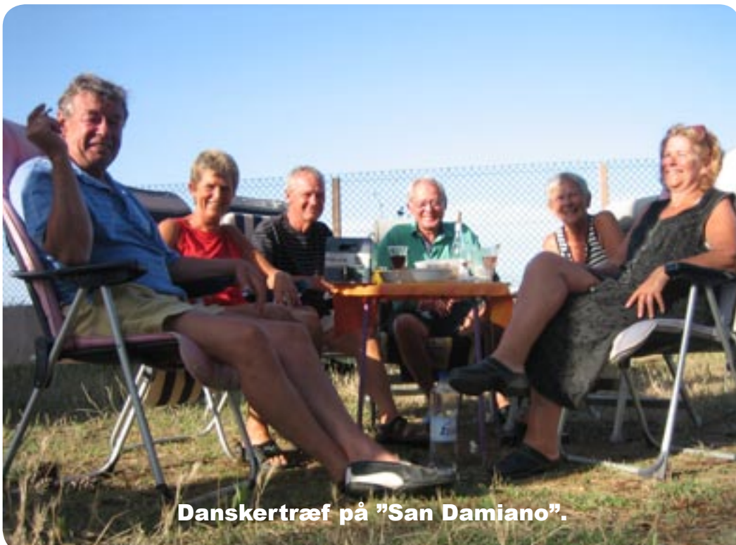
Danskertræf på "San Damiano".

Vi var på stranden og pladsen hele dagen, vi mødte nu igen de 2 danskere, som vi havde truffet ovre på camping "A Stella", vi tror, at vi er de eneste 3 hold danskere, der er her på øen.