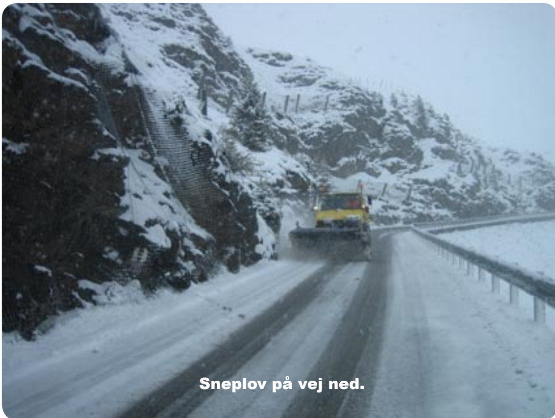
Sneplov på vej ned.