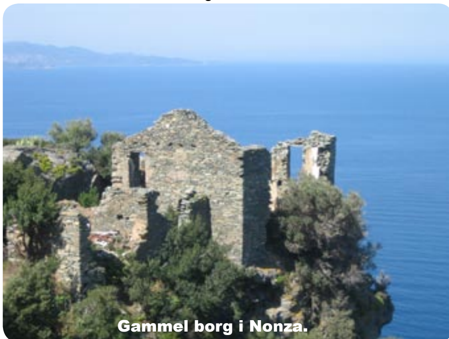
Gammel borg i Nonza.

Vi fortsatte mod Cap Corse, og vi må give Napoleon ret, det er en meget smuk ø, vi måtte gøre holdt flere gange, for at beundre de flotte klipper og den storslå-