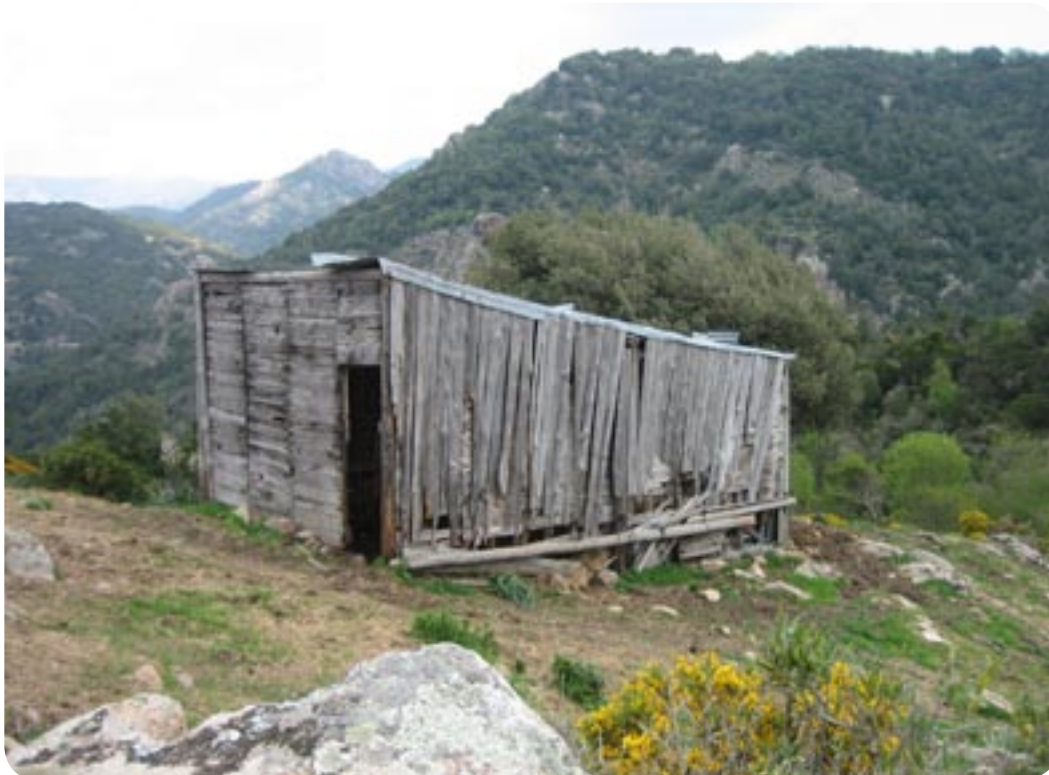
En traditionel landbrugsbygning på Korsika

post i vejsiden, hvor der kom det fineste rene bjergvand ud af et lille rør. Vi stoppede for at fylde tanken op og bilen så ikke særlig ren ud, så både for og bag fik en lille ansigtsløftning, så nu kan vi se ud igen og hvad så vi, jo vejen går gennem vild maki, der står med farverige blomster, ved Col de Marcuccio er man oppe i 600 m højde, til begge sider af vejen falder klippen stejlt