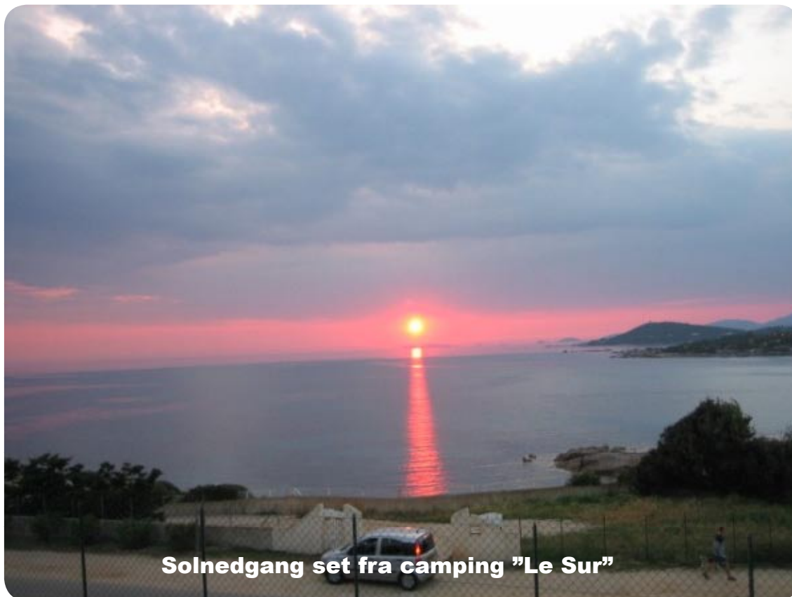
Solnedgang set fra camping "Le Sur"