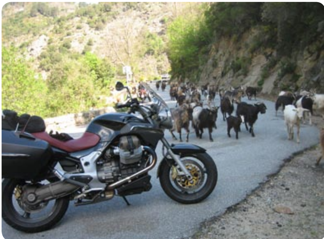
Gederne laver trafikstop.

Omkring Evisa begynder kastanjeskovene, det er i disse skove grisene holder ti. De går og roder efter nedfaldne kastanjer som er en delikatesse for dem, det ser desværre ud til, at der er sygdom i kastanjeskovene, de har mange visne grene og en del er gået ud.