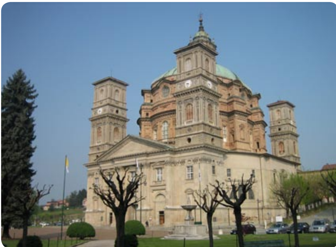
Klosterkirken” L` Eco del Santuario”, i Vicoforte.

holdt en mand på cykle bag ved bilen og gloede ind af vinduet, jeg gik ud, så forsvandt han, vi spiste, vaskede op og sad og læste.