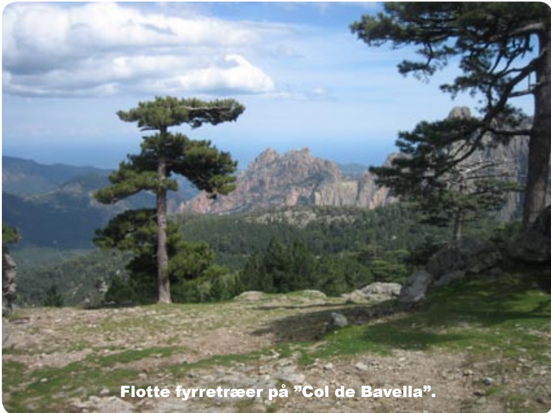
Flotte fyrretræer på "Col de Bavella".