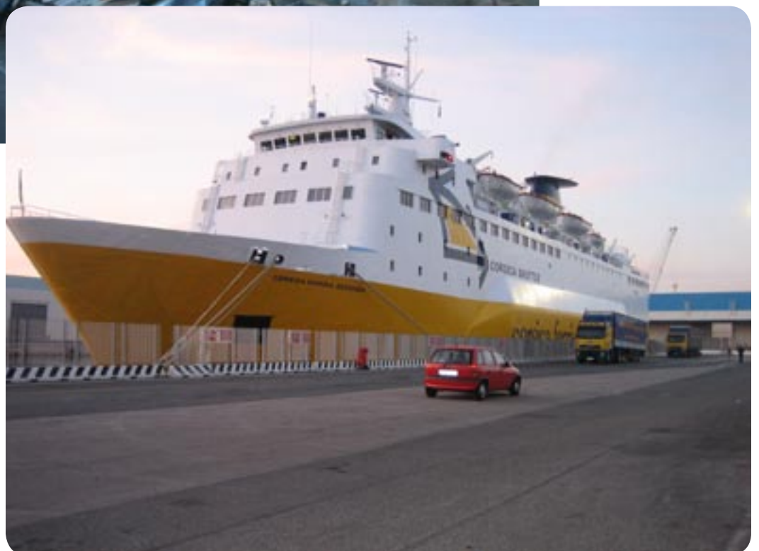
Færgen til Korsika.