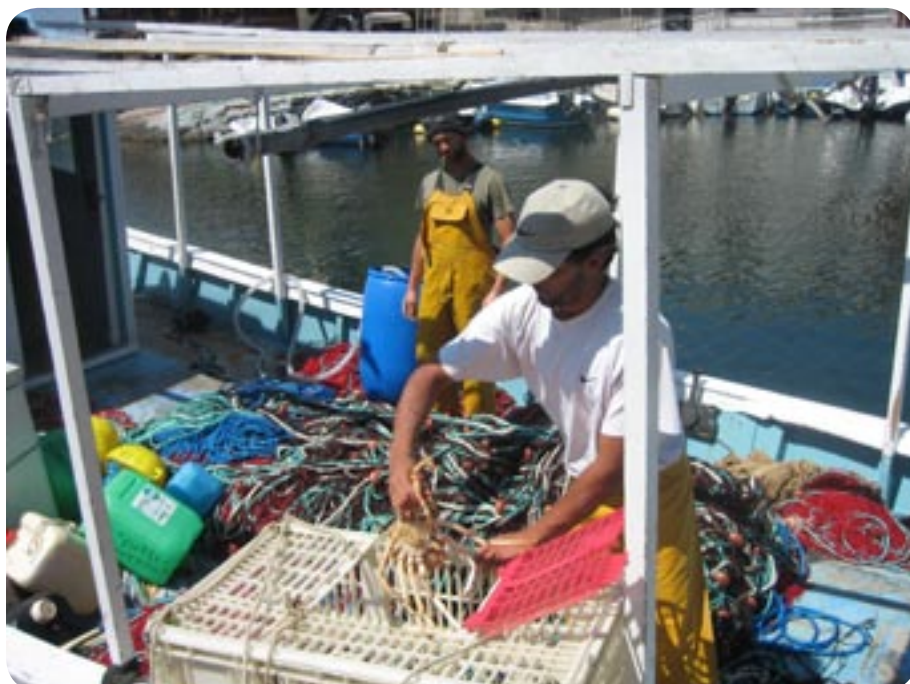
Fiskerbåd med store krabber.

Vi tog D 35 til Centuri-Port , en hyggelig lille havneby, med flere fiskerestauranter, fiskerbådene kommer ind med friskfangede fisk og store krabber.