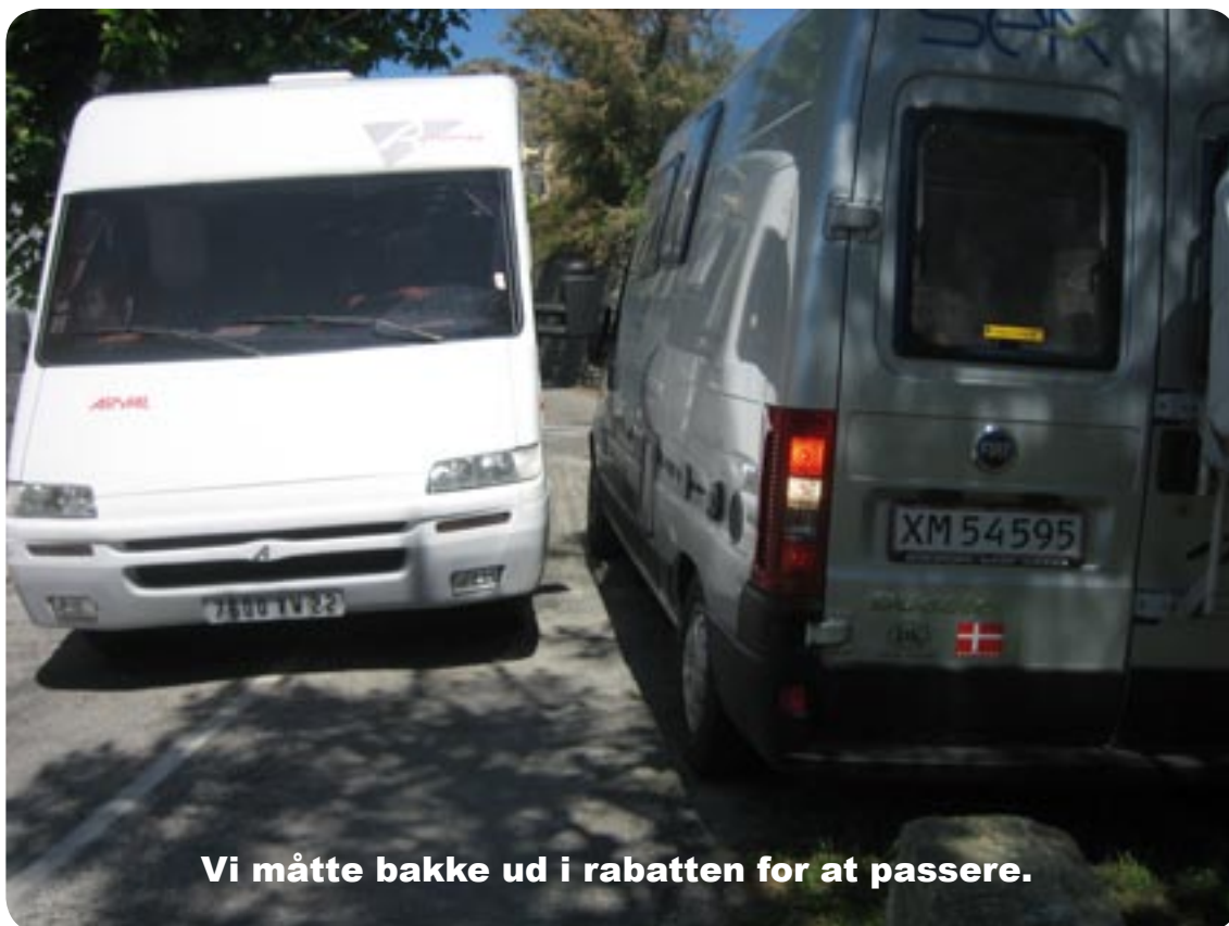
Vi måtte bakke ud i rabatten for at passere.

Inde i bugterne lå de små byer på de stejle skråninger, her var gaderne meget smalle, et sted måtte vi bakke for at passere to modkørende biler, den ene en stor motorhome, også uden for