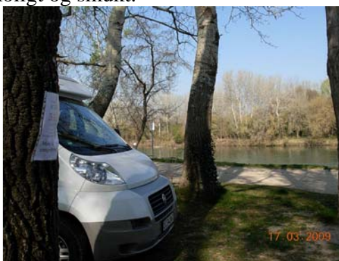
Stell-plads ved byen Comps.

Centralt i området er også en anden vidunderlig plads ved Comps (N43°51,251´ E4°36,498´). Her overnatter man for 3 € nat på en dejlig plads under træer ud mod en afgrening af Rhone og har en skøn udsigt (ingen strøm, men tømning og vand er incl.). Vi kom sent, for vi handlede undervejs i en sjov lille butik, der havde alt! Det var blevet mørkt, men ved at gå rundt med en lygte, fandt vi en plads helt nede ved vandet. I stærk blæst er det en ulempe at parkere under træerne, fordi det drysser ned på bilen. Men så kan man flytte op i læ på den store grusplads, hvor toiletter og tømningsfaciliteter er. Byen Comps har været oversvømmet mange gange af flodvandet, og derfor kan vejen ned til floden blokeres. Vi er ikke helt stærke udi det franske sprog og misforstod den lokale politidame, der opkrævede penge for overnatningen, men det hun nok sagde til os var, at der skulle være beredskabsøvelse netop denne dag, hvor de tog tid på, hvor lang tid det tog at afspærre vejen mod floden. Og så måtte vi pænt holde og vente på, at øvelsen var færdig, og vi kunne komme ud med bilen. Men vi fik da set byen og omgivelserne til fods imens. Vi vendte tilbage til denne skønne plads 3 gange. Roligt og smukt.