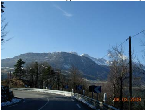
Udsigt til sneklædte bjerge.

Da vi ikke ville køre på motorvej, tog vi N85 mod Seillans over Grenoble. I starten var det en fin flad vej, men fra Grenoble var det bjergkørsel. Vejene var gode og tørre. Der var klar sol hele dagen, og turen var utrolig smuk med flotte udsigter til sneklædte bjerge.