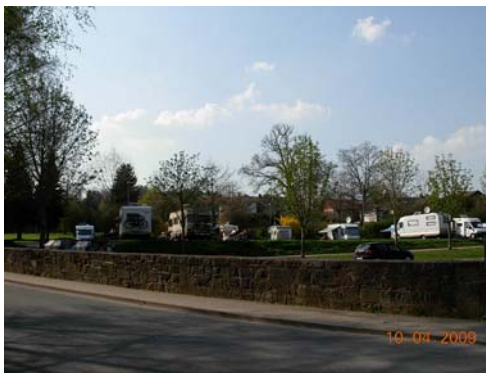
Stell-plads i Hofgeismar.

Vi har så ofte kørt igennem Lüneburger Heide på motorvejen på vej ud og hjem, men nu gav vi os tid til at krydse rundt på Heiden i flere timer på kryds og tværs. Det var nærmest skov med en smule lyng nogle steder i underskoven. Der var meget få P-muligheder, så vi fik ikke gået tur. Bagefter kørte vi til en skøn, centralt beliggende Stell-plads i Lüneburg (N53°14,726' E10°23,803'), hvor der var mange vogne, og hvor vi mødte den anden danske vogn, siden vi kørte hjemmefra.