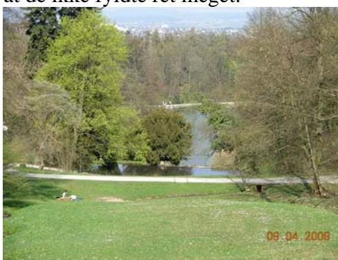
Slottet Wilhelmshöhe i Kassel.

Næste spændende sted var Kassel, hvor vi nød den pragtfulde park til slottet Wilhelmshöhe. Der var vandkunst, søer og blomstrende buske og mange mennesker der lå, gik, vandrede, klatrede mange steder, men parken var så stor, at de ikke fyldte ret meget.