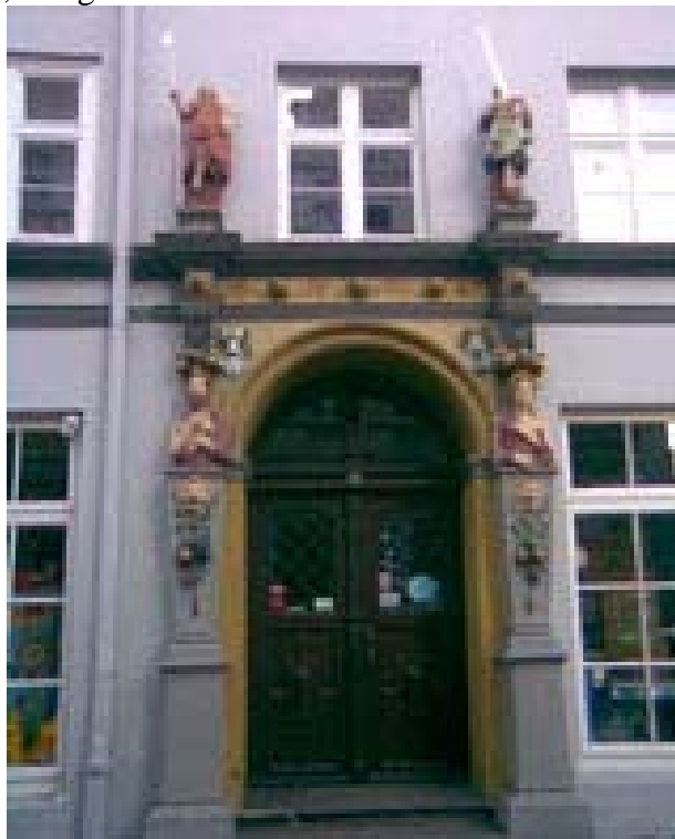
Dørparti i Lüneburg.

saltkran. Vi faldt pladask for Lüneburg, der har en meget smuk kirke og mange små, spændende gader med masser af gode, billige butikker.