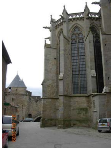
En del af borgen i Cascarsonne.

I mellemtiden fik vi set Cascarsonne gamle by, som er en by og en borg ud i ét stykke. Meget spændende at se. Der var turistboder i alle de gamle butikker. Dernæst så vi ridderborgen, hvor der i kirken var meget simple vægmalerier og ellers mest forsvarsværker, så man på alle mulige måder kunne forsvare, skyde og hælde ting i hovedet på angribere.