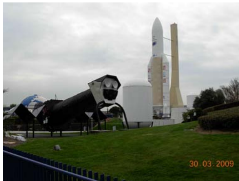
Rumfartsmuseet i Toulouse.

Og det var værd at vente på at se, selvom der var mange oplysninger, vi gik glip af, fordi alt stod på fransk. Der var en del modeller i 1:1 blandt andet Mir og en Ariane raket, der blev vist næsten alt med rumfart på små film/fjernsyn, der var rumdragter og forskellige rumkapslers indretning og et par biografer, som viste forskellige film - på 360° lærreder.