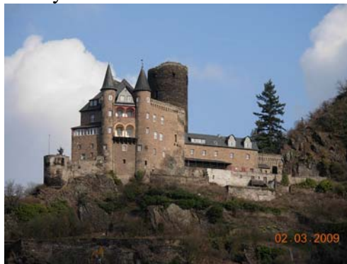
Borg højt placeret ved Rhinen.

Næste morgen kørte vi mod Koblenz, hvor vi tog vej no.9 langs med Rhinen. Det var en flot og langsom tur med udsigt til en masse flodbåde, vinmarker op ad bjergsiderne og slotte og borge højt placeret og meget dekorativt. Loreley så vi lidt ved et tilfælde.