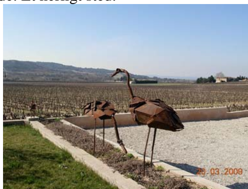
Domaine des Lauribert.