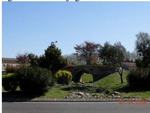
Rundkørsel i Frankrig.

På parallelvejene til motorvejen og i byerne er der mange rundkørsler, og de er ofte opfindsomt dekoreret med forskellig kunst og blomster - dejligt!