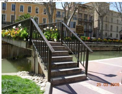
En lille del af blomsterudsmykningen i Nabonne.

Narbonne er meget spændende med smukke blomster, kanaler og gamle bygninger alle steder. Vi så katedralen udefra og dens park, og den var imponerende men lukket til kl. 14, så vi tog en kop kaffe til den åbnede, og den var utrolig flot indeni også.