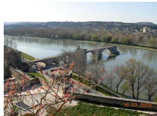
Den halve bro.

Også Nîmes er spændende - men svær at parkere i med en stor bil. Til sidst fandt vi en p-plads lidt udenfor byen ved et indkøbscenter og tog en bus ind til centrum, hvor vi nød at se et stort børneoptog indtage den arena, hvor gladiatorerne tidligere kæmpede. I arenaens gange er der spændende 3D udstillinger, som vi nær havde overset. I Nîmes er også et romersk tempel, hvor kustosoden taler lidt dansk, og de viser 3D film om romertiden.