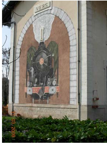
Den nedlagte jernbanestation.

var en campingplads, hvor man kunne holde gratis foran pladsen, og hvor der var en vidunderlig udsigt og 2,9 m max højde i tilkørslen under en rundbuebro. Man skal komme i dagslys for at finde det og køre sikkert derind.