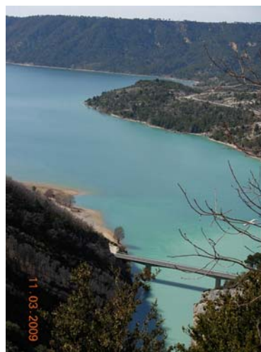
Grand Canyon du Verdon.

Det var en fin vej, vi kørte på, der var ikke megen trafik, men den var snoet og ofte med overhængende klipper. Det var ikke vejens skyld, at det tog lang tid at køre turen men pauserne, hvor vi lige skulle se os om. Et utrolig smukt område!