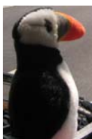
Vores lille Puppi fra Island