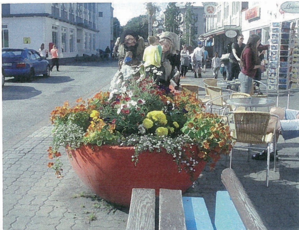
Gågaden i Akureyri

Næste punkt er så Island, og her er vi nu. Igen må jeg skrive om vejret. De første par dage var vi heldige og i Akureyri havde vi endda op til 22 grader; men ellers har det været ret koldt, og vi har fået megen regn. Aldrig har vi oplevet så dårligt vejr her i Island.