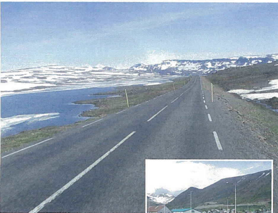
Sidste syn før nedgang til Seydisfjörður

natten. Næste dag var der lidt småregn, men jeg skulle dog alligevel en tur op til toppen for sidste gang. Der er trapper og sti hele vejen op, så det går nok.