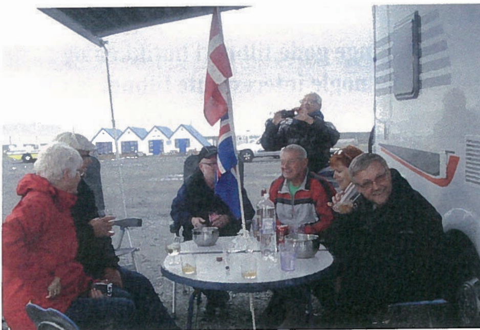
Hygge ved Jökulsálon