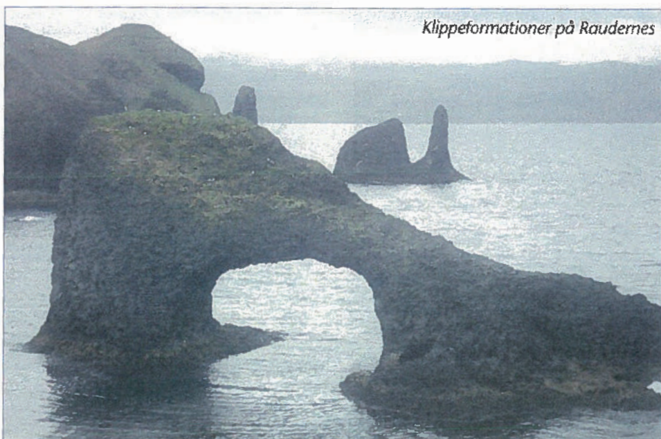
Klippeformationer på Raudenes