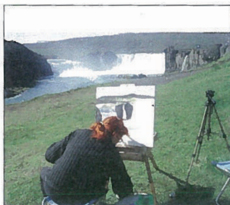
Pia maler gudemes foss

i turistsæsonen. Vi var jo som sædvanlig oppe i den flotte kirke og en tur hen til den botaniske have. Man regner ikke med, at finde så mange smukke planter i Island og så store træer, som man finder her. Vi var nu nået hen på dagen, og det var vores mening at køre til Dalvík, der kun ligger ca. 40 km fra Akureyri; men vejret var jo stadig dejligt, så hvor-