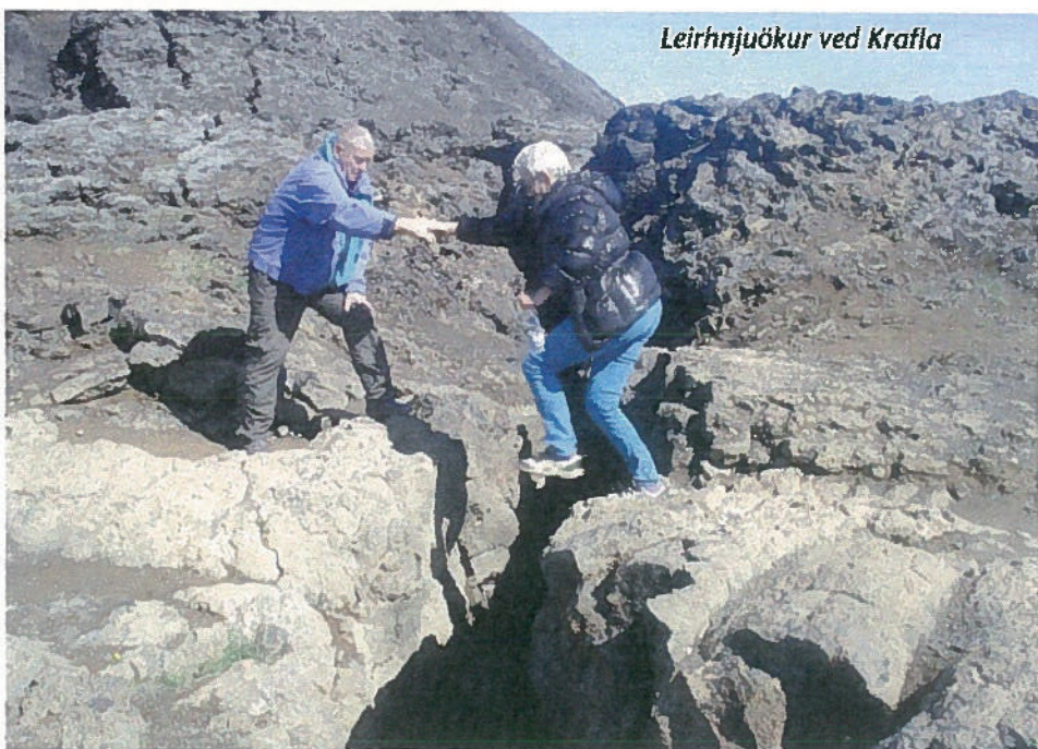
Leirhnjúkur ved Krafla