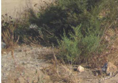
Den eneste plads kun for autocampere