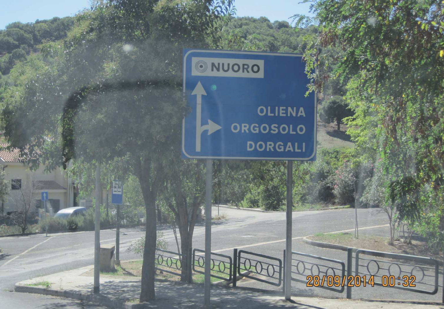
Bag ved byskiltet kan man se autocamper tømningsskilt, det var der i næsten alle byer