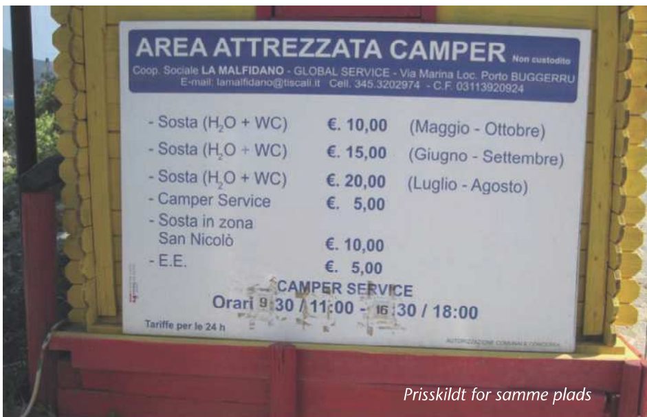
Prisskilt for samme plads

Vi kørte hurtigt sydpå til Porto Vecchio og tog en færge til Palau på Sardinien, sejltid 1 time. Det er en god ide at booke hjemmefra til begge færger. På hjemve-