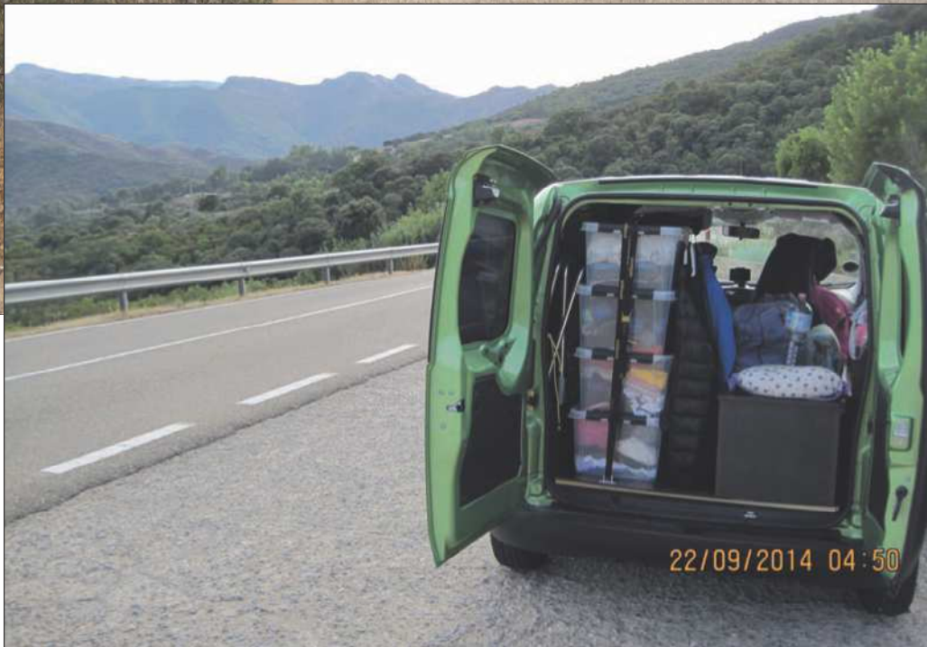
Vores lille autocamper, vi brugte meget hotel