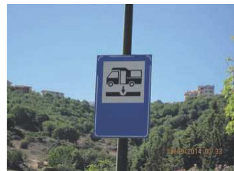
Et typisk tømningsskilt

Jeg vil ikke beskrive vores tur i detaljer men blot nævne vores rute: