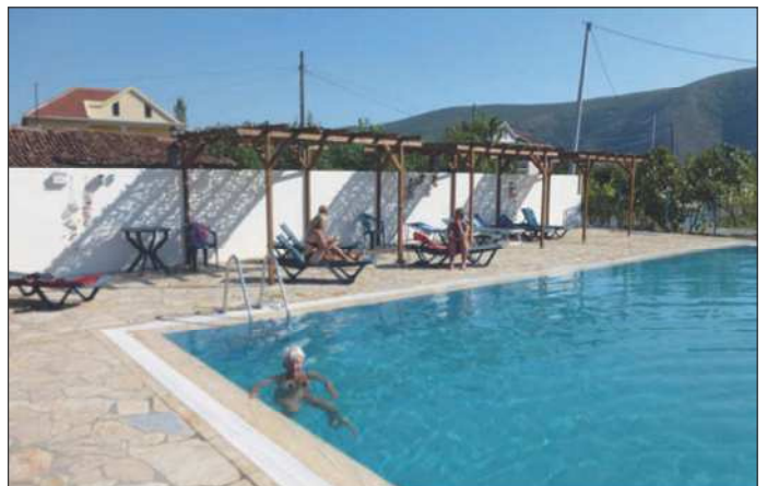
Dejligt at blive kølet af