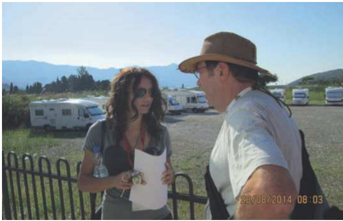
Planlægning af dagens tur