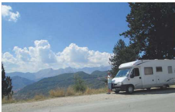
Pause på toppen