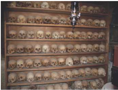
Fra en svunden tid hvor forfædre først blev begravet for derefter at blive gravet op, rensset og sat på hylder