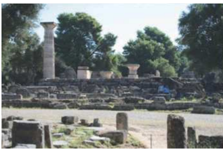
Resterne af Zeus templet, den mest betydningsfulde i Altis