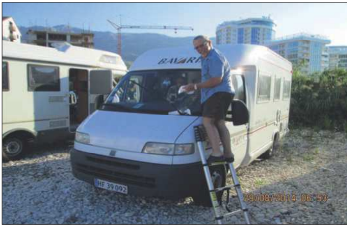
Der gøres klar til dagens tur til Albanien