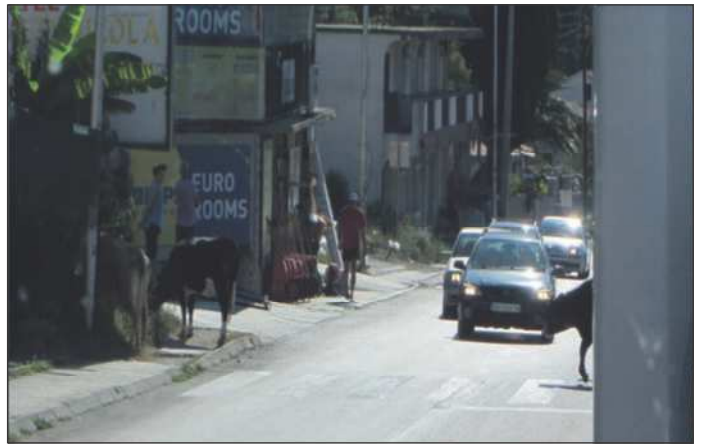
Der var køer i Albanien