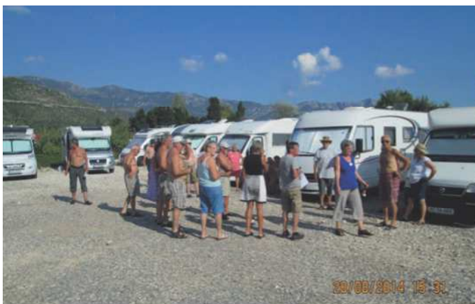
Så er der aftenmøde