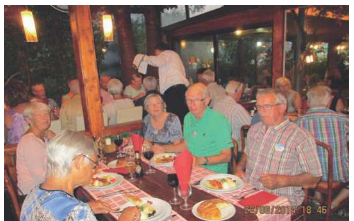
Vi spiste på restaurant Porto