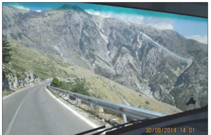
Bjergkørsel på kystvejen i Albanien