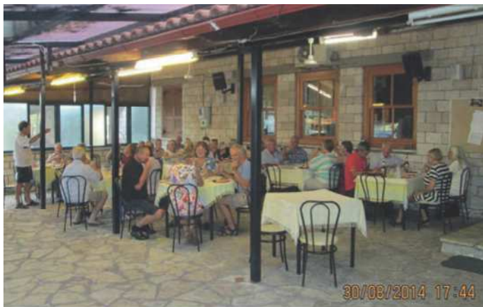
Endelig ankommet til spisningen i Ktismata