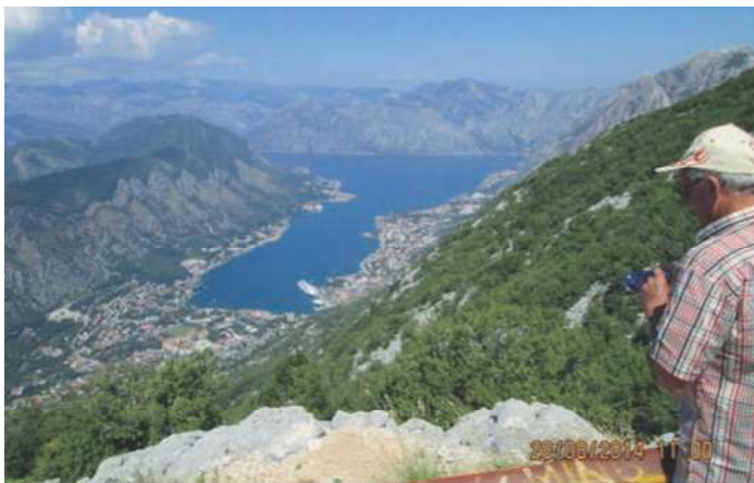
Fantastisk udsigt over Kotor fra 900 m højde