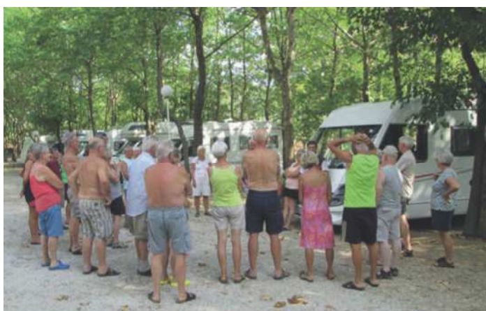
Aftensmøde i Kastraki