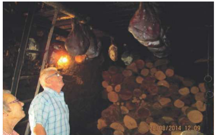
Røget skinker under loftet