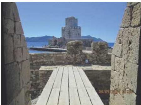
Methonifæstningen er et enormt bygningsværk

neden om den sydlige del af Albanien, inden vi kørte ind i Grækenland. Det blev også en flot tur, men lang tur, med bjerge og hårnålesving som flere af os ikke har oplevet før.