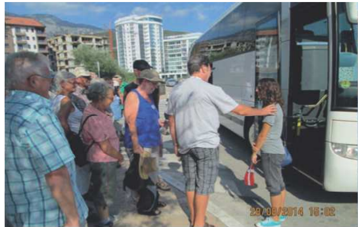
Hjemme på pladsen igen efter en rigtig god tur