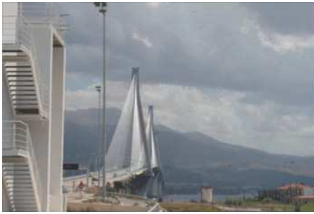
Broen ved Patra