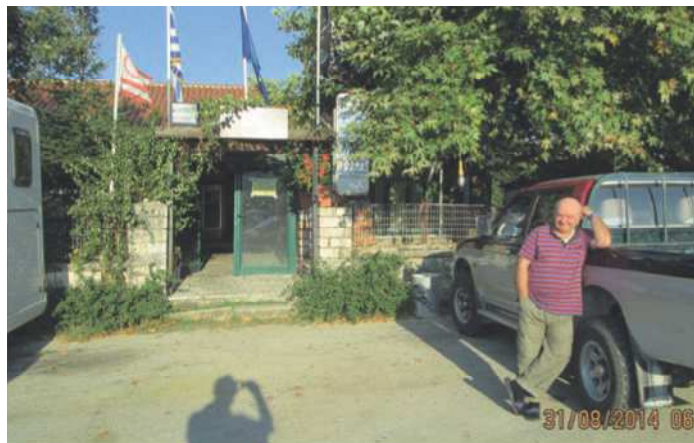
Vores vært i Ktismata