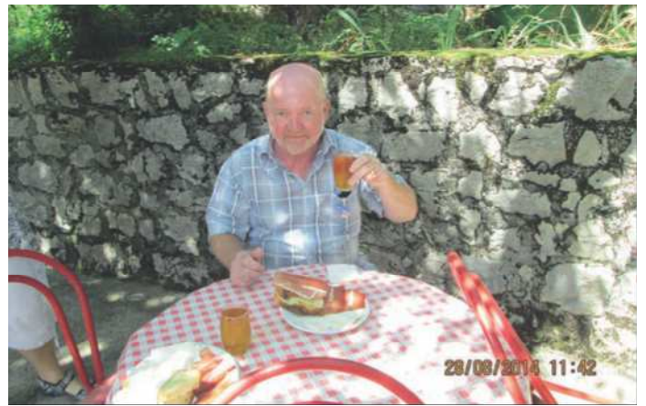
Så er der dømt øl og skinke