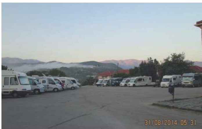
Morgen i Ktismata