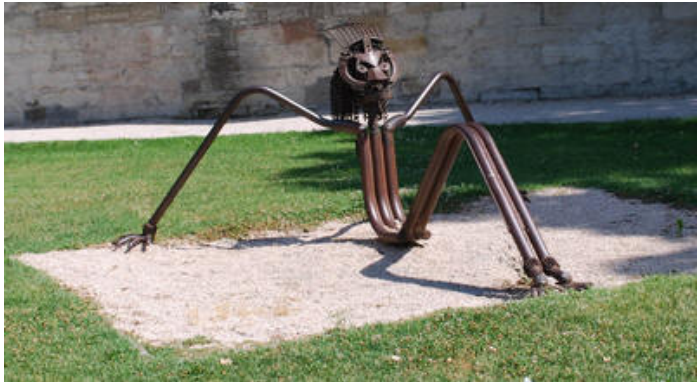
Flink mand uden for muren