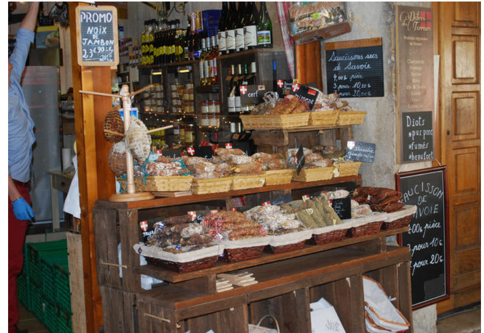
Slikbutik i Annecy

Dagen efter måtte vi en tur op i bjergene og kigge. Vi havde på pladsen fået anbefalet Col de Forclaz ved byen Montmin som det flotteste udsigtspunkt over Annecy søen og der var en super udsigt.