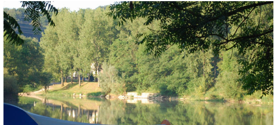
Dejlig morgen på La Plage Besancon