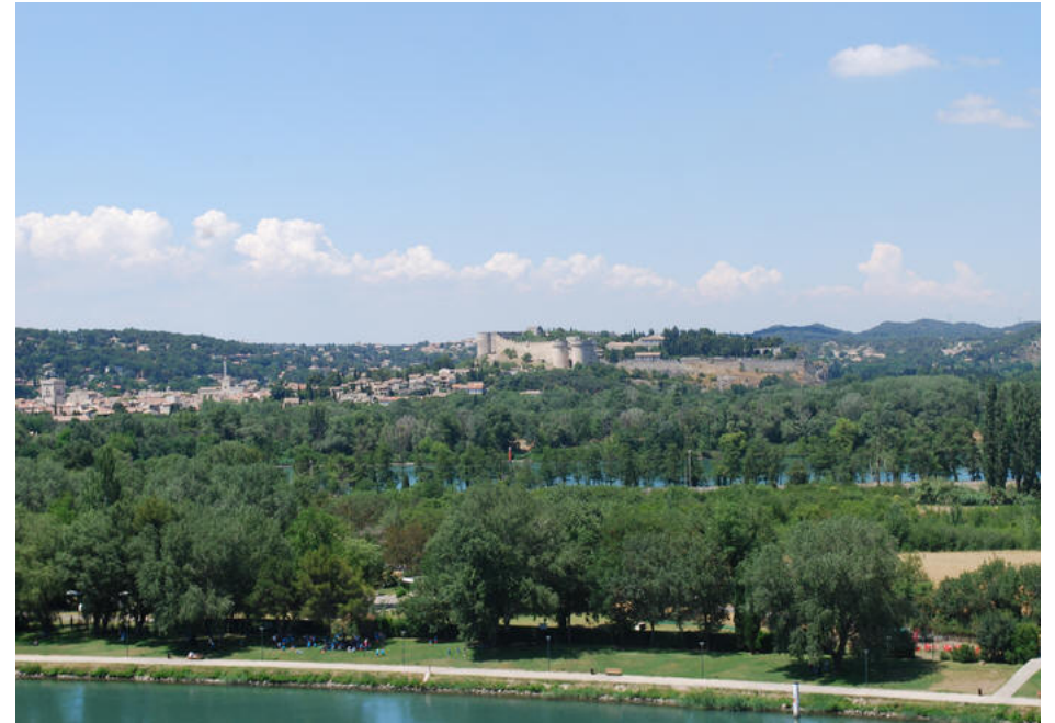
Udsigt fra højen ved paladset