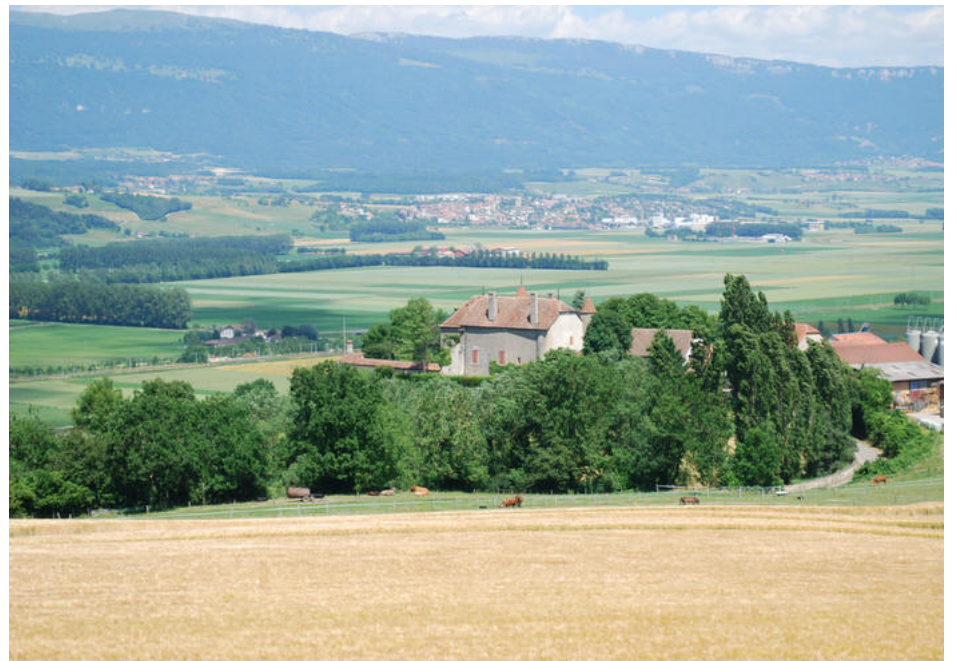
Udsigt i Sveitz