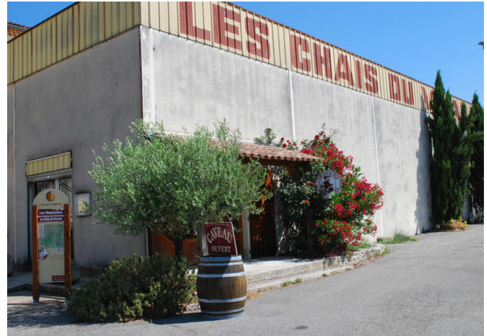
Kooperativet i Saint-Remeze

Ved hjælp af Garmin fandt vi en overnatningsplads i Besancon, La Plage og det var den god til. Kommer I på de kanter er det en rigtig dejlig plads lige ned til floden Doubs. Byen Besancon så også ud til at være et besøg værd, men vi ville gerne ha' et par dage i Alsace, så den må vente med besøg til en anden gang.