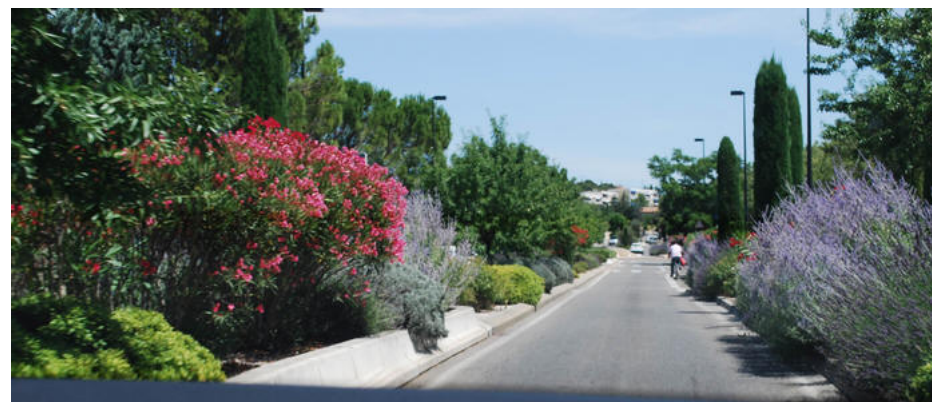
Vej i Les Angels ved Avignon