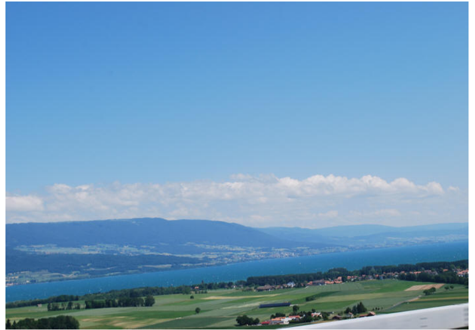
Udsigt i Sveitz