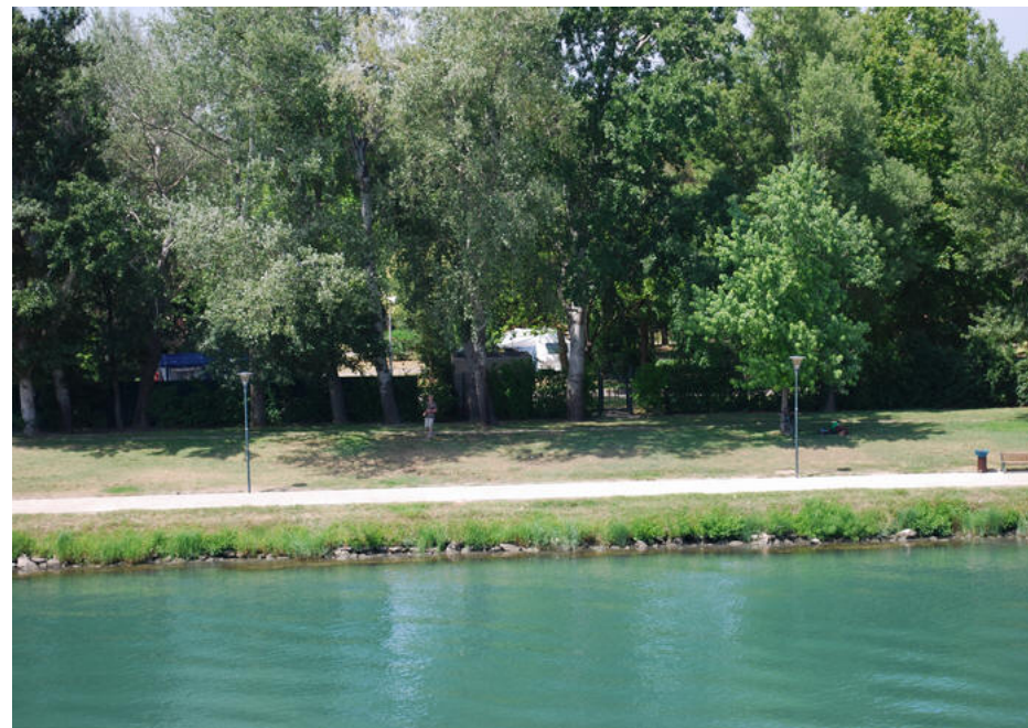
Vores plads fra Pont Avignon