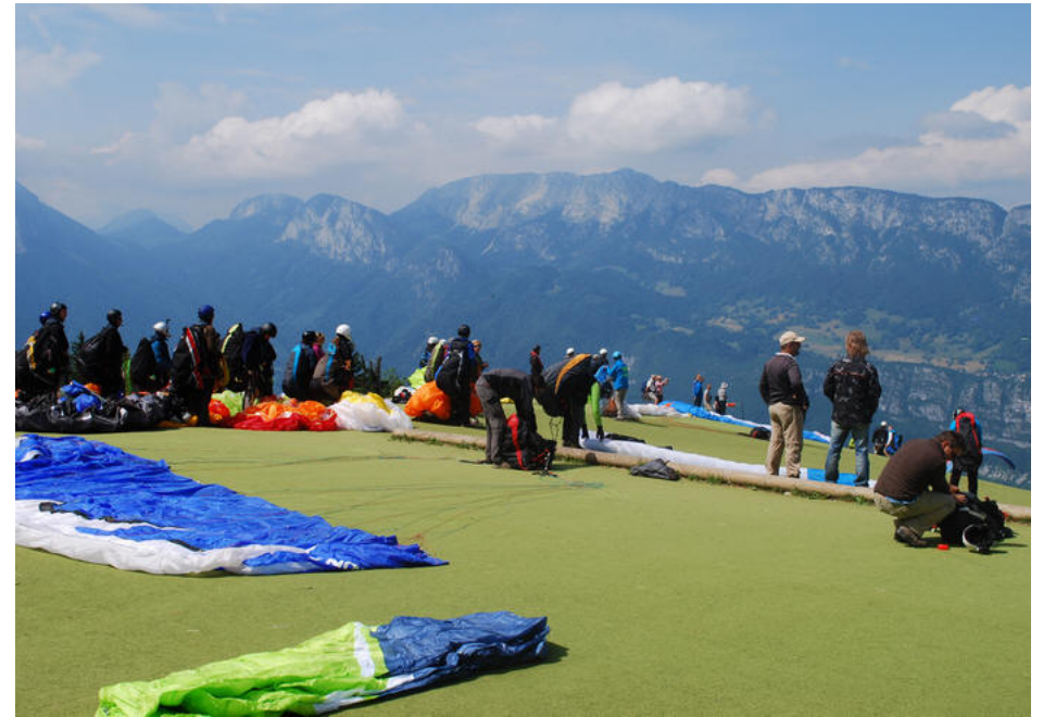
Ventepladsen på Col de Forclaz