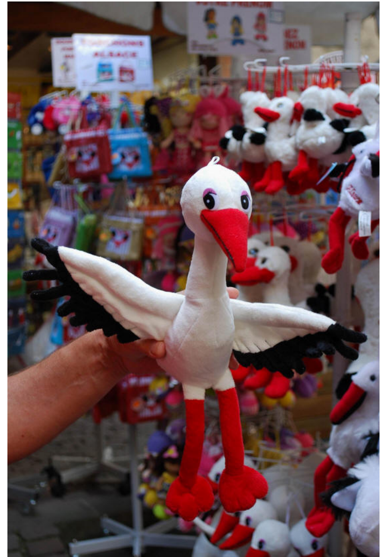
Tam stork i Riquewihr

På turen gennem Tyskland kan vi godt li' et stop og vi valgte at bruge Seecamp Derneburg hvor vi havde følt os meget velkomne på vej sydpå og det gjorde vi også denne gang. Når vi sådan kom igen og så to nætter, så skulle vi ligge helt nede ved søen.