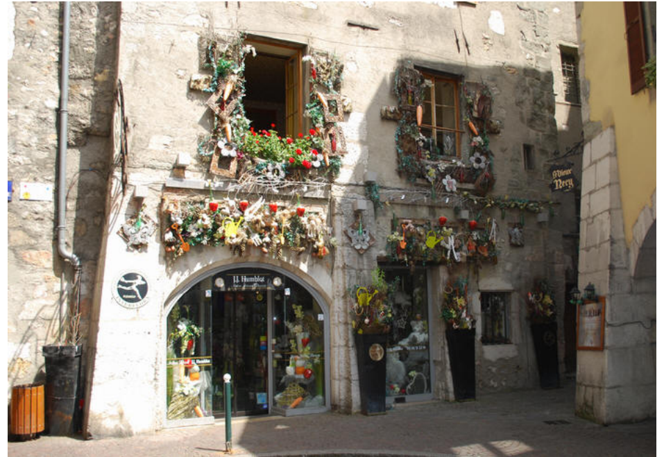
Blomsterbutik i Annecy