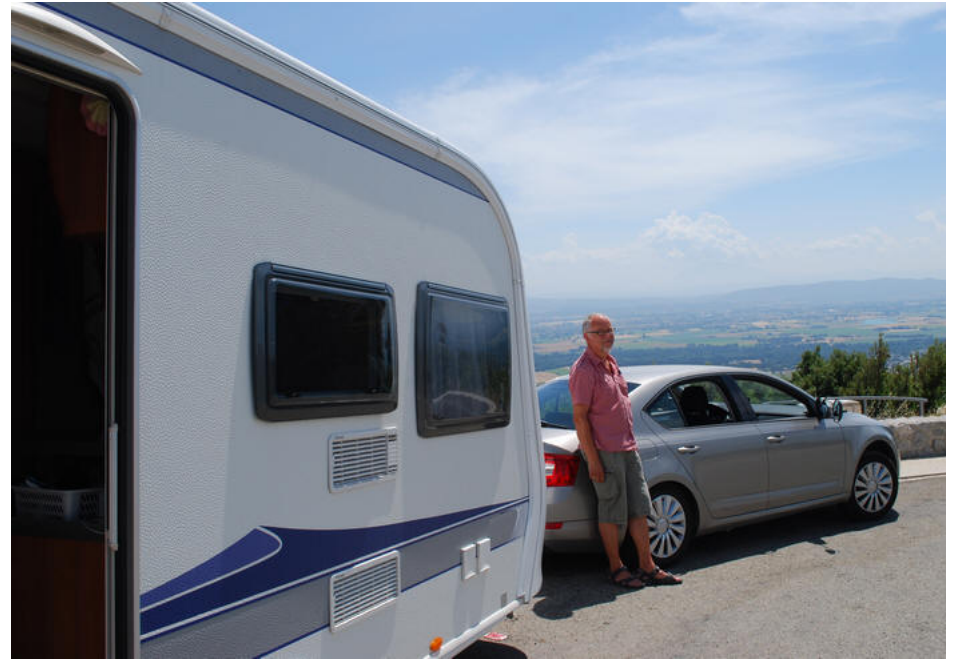
Udsigt over Rhonedalen