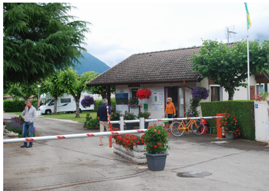
Camping le Solitaire du Lac

Mandag cyklede vi på den gode cykelsti de godt 8 km. ind til Annecy, der jo bare er en meget fin og hyggelig by. Det er også dejligt at se de flager rigtig meget for os danskere (eller mon det er fordi Savoien flag ligner det danske?). Det var dejligt at kunne cykle på en rigtig god cykelsti langt fra biltrafikken.