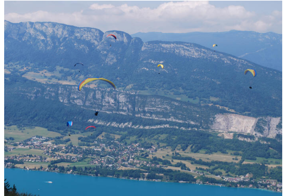
Paraglidere ved Col de Forclaz

Onsdag kørte vi videre mod syd. Turen gik over Albertville, Grenoble, Valence og vi landede på Camping du Pont d'Avignon først på eftermiddagen og fik anvist en plads med udsigt til Pont Avignon, med både sol og skygge og det er jo rart når temp. er omkring de 30.