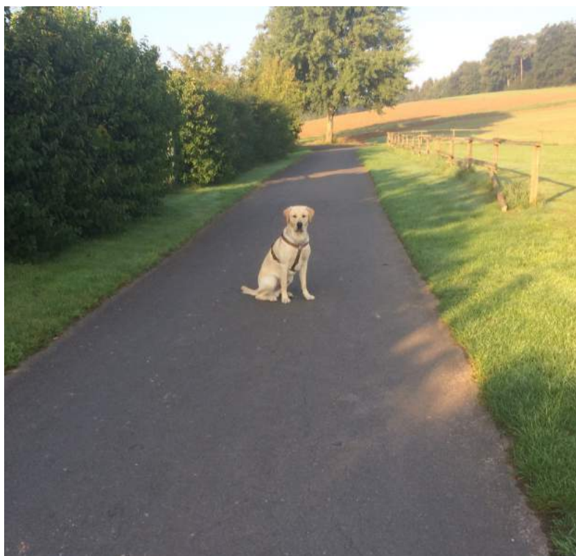
Her kan vi få morgenbrød, så Rex og jeg er på vej for at hente det.