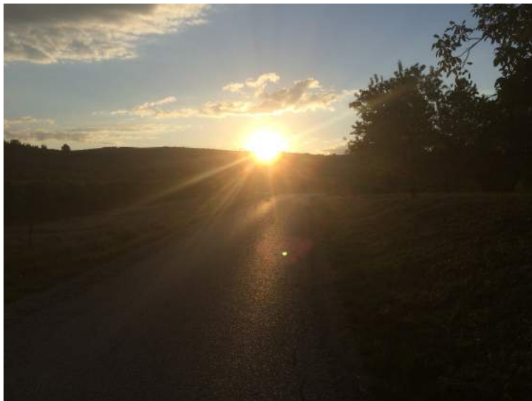
Næste dag stod sole smuk op over bjergene. Der anes dog skyer mod