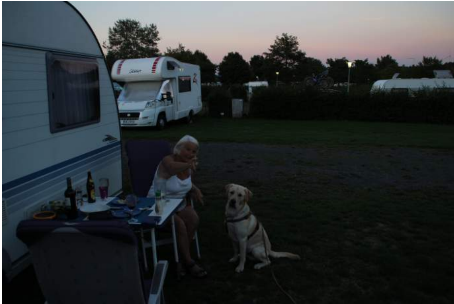
Varmen fortsatte, så aftensmaden blev nydt udenfor mens solen gik med.