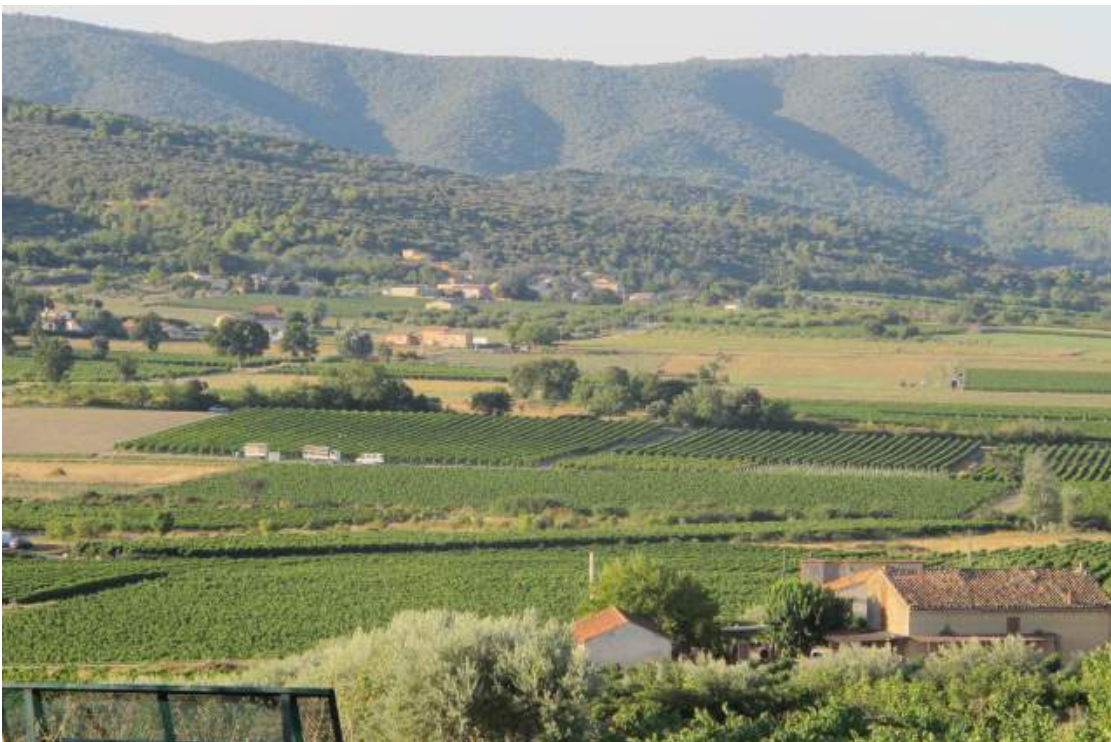
Udsigten mod Lubron bjergene og vinmarkerne.