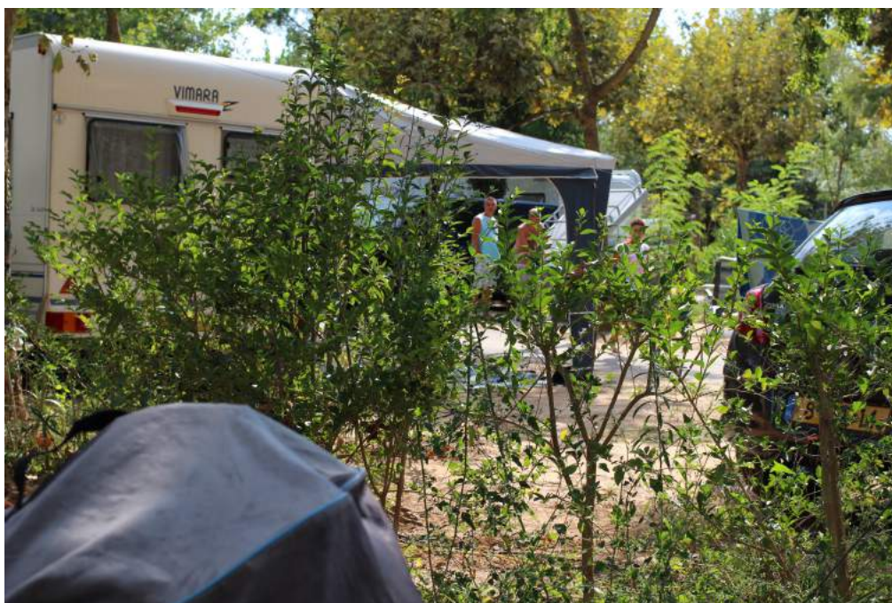
Lidt snak med genboer.