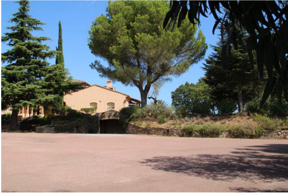
Først et besøg ved den lokale vingård.