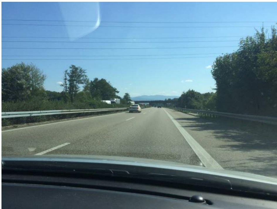
Vi ser Alperne i det fjerne, vejret er bare fantastisk.