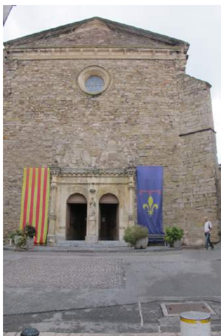
Billeder fra den gamle bydel.