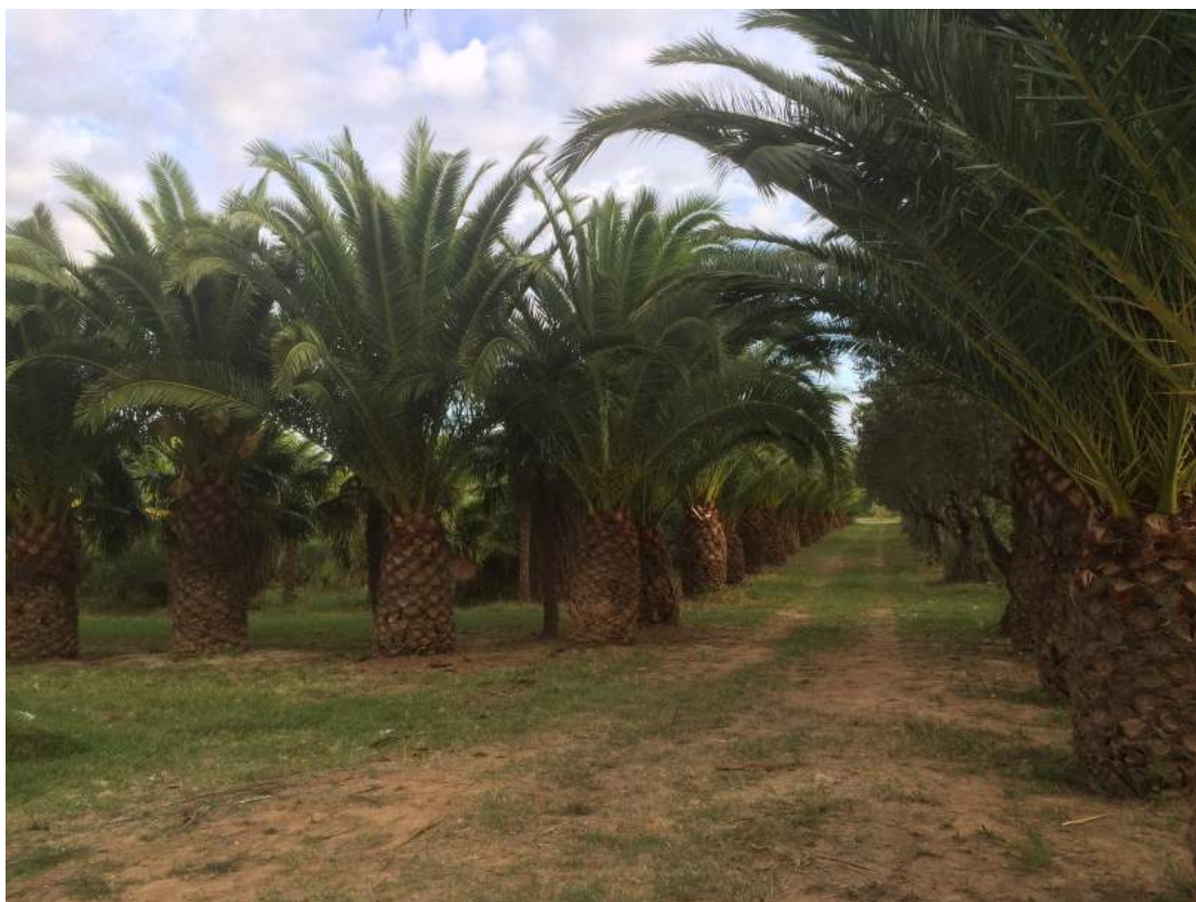
Lige overfor campingpladsen ligger denne dejlige palmelund, jo vi er kommet til syden. Der blev lovet torden til natten, og hvilket tordenvejret, troede det var verdens undergang. Det tordnede fra kl 24 til kl 8 næste morgen og