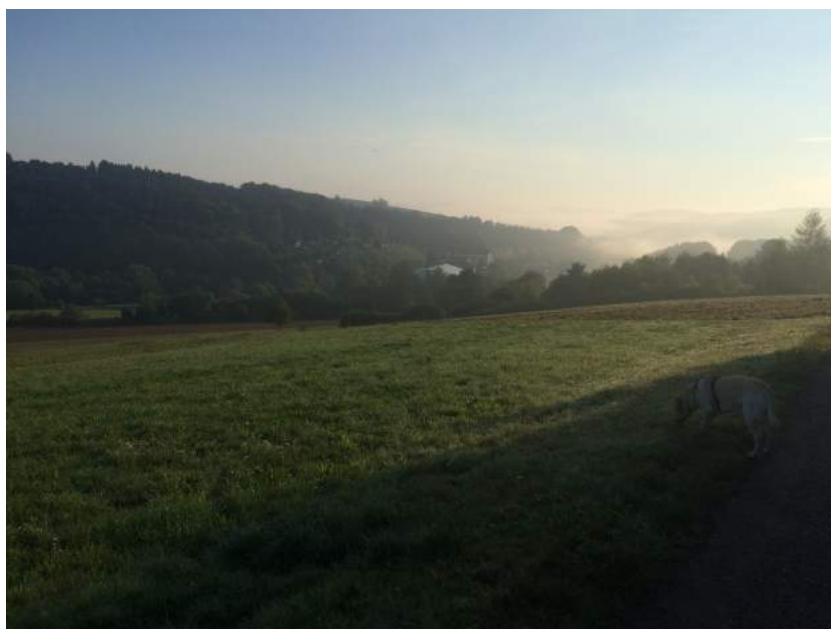
Der er en fin udsigt på vejen ned.