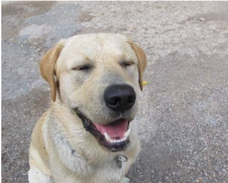
Sig ikke at en hund ikke kan smile. Rex smiler tilfreds med at være på ferie.