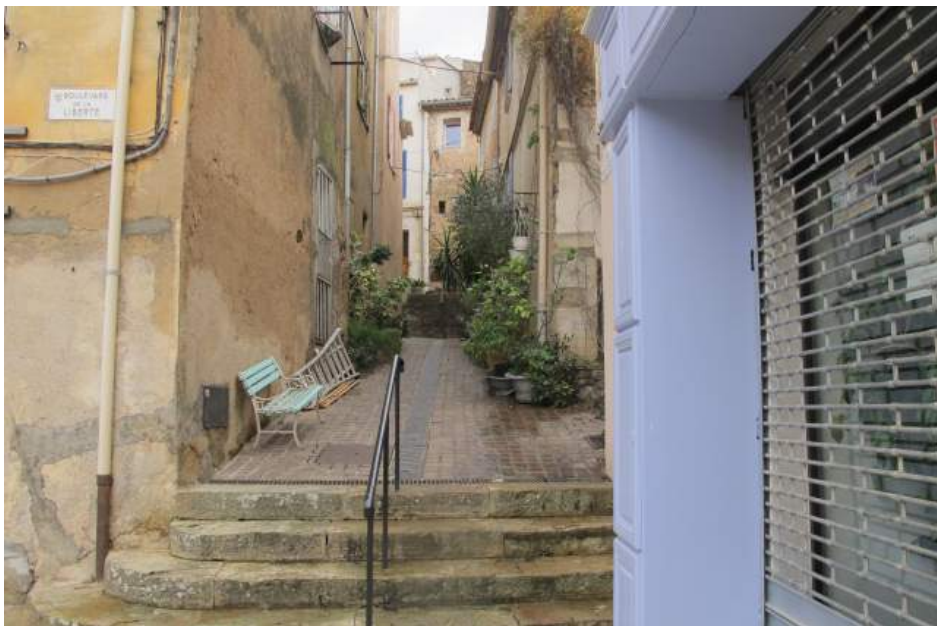
En skøn lille by, med mange gamle huse og mange smalle stræder.