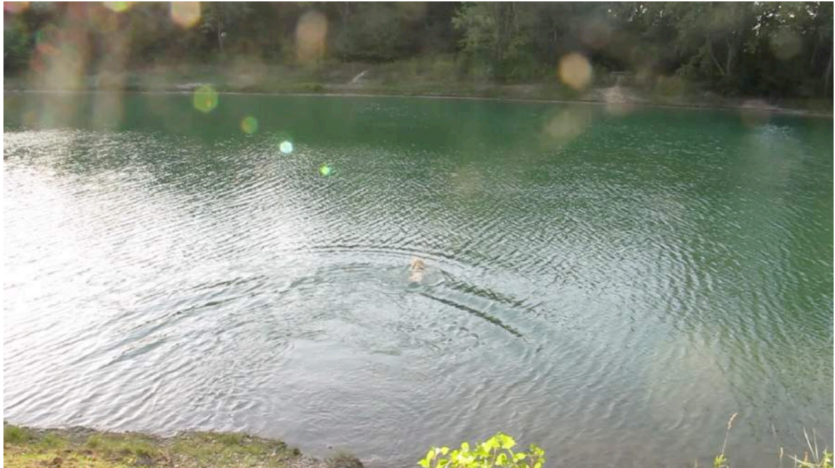
Rex nød svømmeturen i fiskesøen, hvor også Max havde muntret sig.