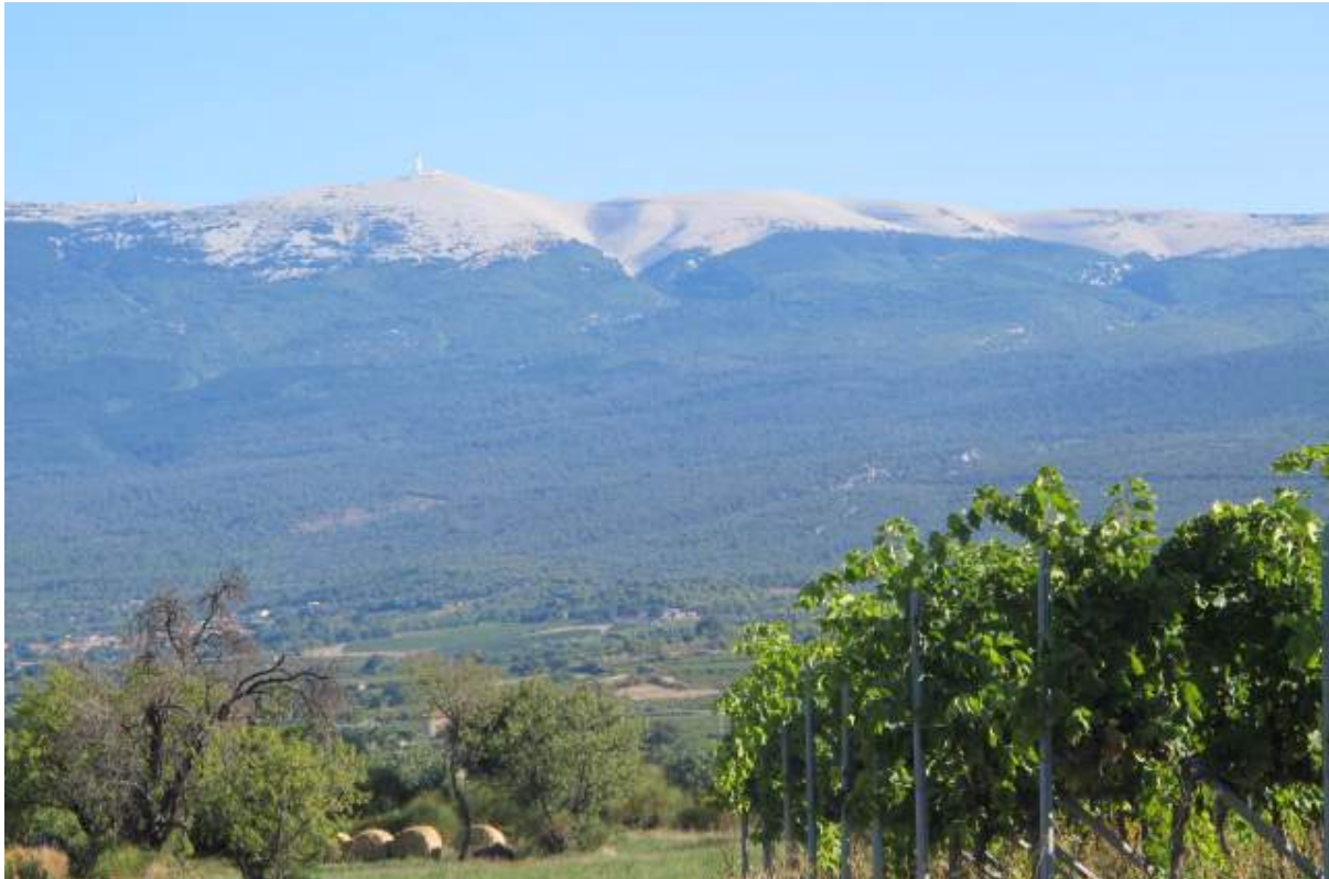
Lidt billeder fra det skønne landskab. Udsigten mod Mont Ventoux fra en skyfri dybblå himmel, ingen tegn på at Mistralen måske atter skulle få os til at flytte