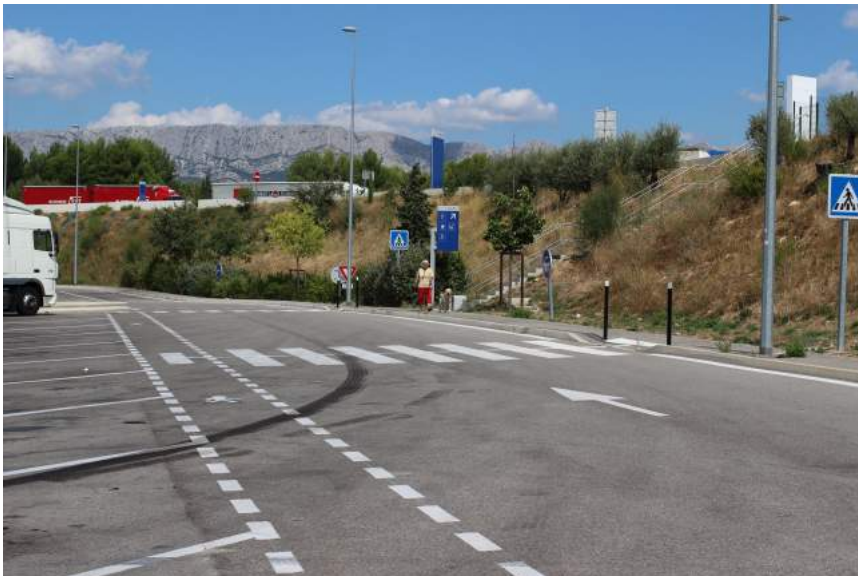
Så lige en gang mad og hundeluftning, atter er det varmt og skønt.