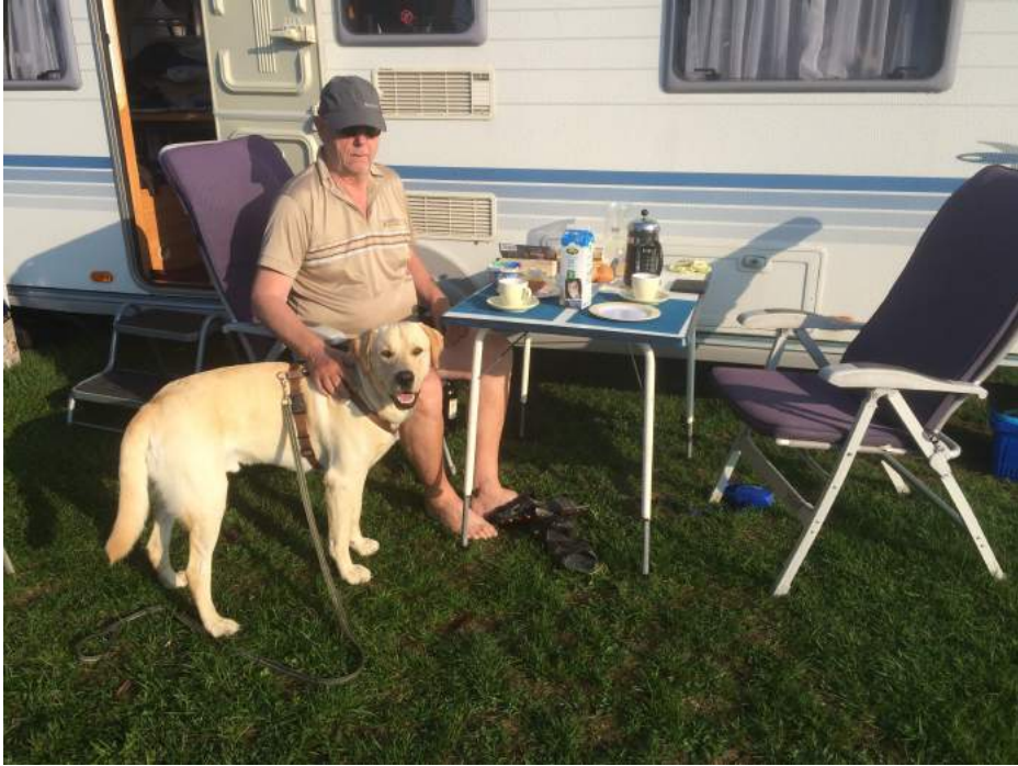
En skøn morgen med varme, morgenmaden nydes udenfor inden det pakkes sammen, næste stop Neuenburg Am Rheine.