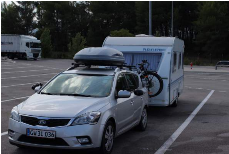
Her er vi så på vej mod Côte Azur.