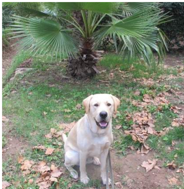
Rex fik besøgt palmen som blev Max sidste hvilplads under sydens sol.