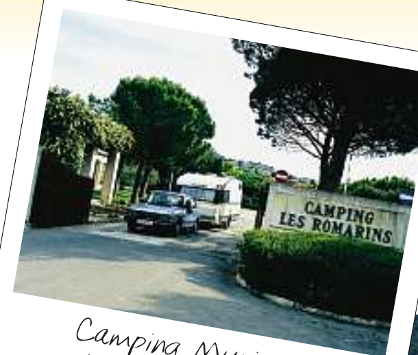
Camping Municipal "Les Romarins".