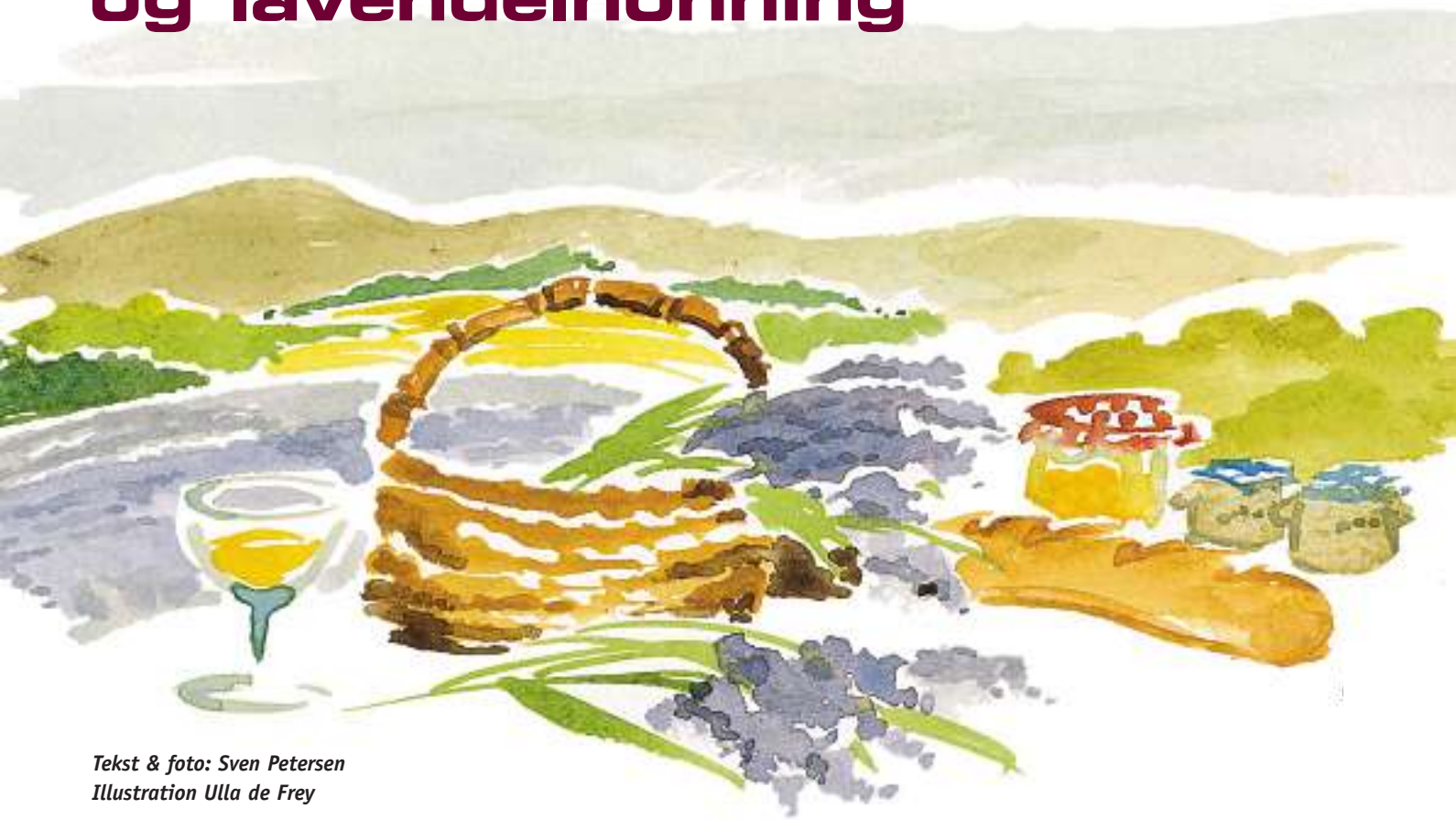
Tekst & foto: Sven Petersen Illustration Ulla de Frey

Når vi i den lange, mørke vinter går og taler om, hvor sommerens campingrejse skal gå hen, behøver vi blot at lette på låget af krydderikrukken på køkkenbordet. Så er rejsemålet næsten bestemt, og det er blevet til Provence i rigtig mange år.