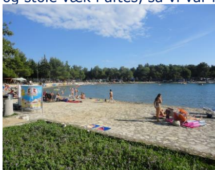
Stranden ved Camping Valkanella