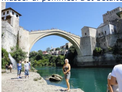
Broen i Mostar

Vi gik et par hundrede meter og var inde i den gamle bydel, som ligger lige ved den meget kendte gamle bro, som blev skudt i stykker under borgerkrigen i 1991-95. Der var et "Leben" i de små gader op til broen, hvor der blev solgt al slags "Tingeltangel", og fremme ved broen var der nogle unge fyre, som prøvede at tjene nogle håndører ved at springe ud fra broen og ned i floden. Vi fik taget nogle billeder af gaderne og broen, både oppefra og nede fra floden. Da vi gik op ad trappen, blev vi enige om, at vi trængte til lidt at spise, så vi satte os på Sadrvan, hvor vi bestilte 2 Mostar øl og 2 Mixed Grill, med 5 forskellige slags kød og masser af pommest. Det betalte vi 50 € for inkl. drikkepenge – det var det værd. Med skam at sige kunne vi ikke spise op – vi måtte sågar levne af kødet!