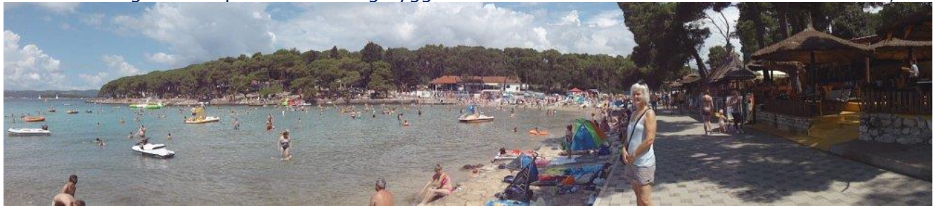
Stranden ved Camping Park Soline