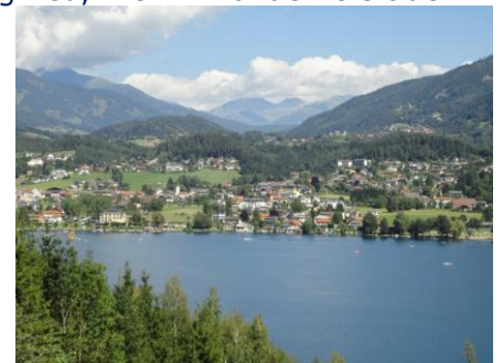
Udsigt på cykelturen

Millstätter See. Vi fulgte stien som gik langs kysten. Det gik op og ned, men vi havde hele tiden udsyn til søen enten gennem træerne eller på særlige steder frit udsyn over til den anden side. Flere steder kom vi forbi anlægsbroer for "Peter Pan" hvor vi kunne stige på med vore cykler, hvis turen var for streng, eller vi havde haft uheld. Vi var heldigvis forskånet for uheld, og vores kondi kunne lige klare turen, bare vi på de stejleste steder gik op ad bakkerne. Fremme ved Seeboden kørte vi ned til byen, hvor vi igen kom på asfaltvej. Vi kørte op gennem Seeboden og fandt et Adeg supermarked, hvor vi fik handlet lidt fornødenheder, og som det vigtigste en liter vand, som vi straks drak halvdelen af. Vi fortsatte nu ad den fine cykelsti langs Nordufer gennem Millstatt til Pesenthein, hvor vi drejede ind på campingpladsen. Efter en køretur på 2½ time og 29 km kunne vi slappe af under markisen med 29 °C. Resten af eftermiddagen slappede vi af under markisen, hvor temperaturen i skyggen nåede op på 33,1 °C. Vi var lige en tur nede ved receptionen, så vi kunne afregne 69,20 € for de 2 overnatninger. Efter aftensmaden pakkede vi markise, bord og stole væk, så vi hurtigt kunne gøre klar til at køre i morgen tidlig. Resten af aftenen hyggede vi os inde i campingvognen og fik skrevet lidt på beretningen.