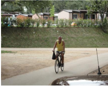
Ejflif med morgenbrød