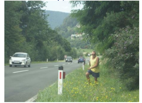
Oversvømmelsen blev afværget!