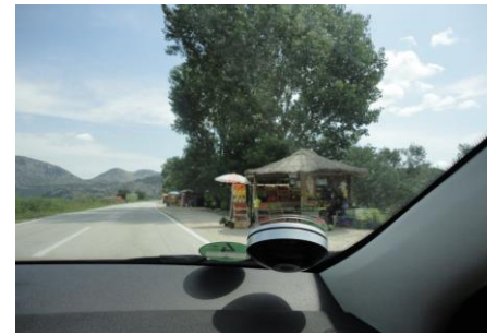
Vejboder ved Neretva Deltaet

en og kunne køre det sidste stykke frem til Dubrovnik. Her ville GPS'en have os ned gennem byen, men vi holdt hovedet koldt, og tog den lidt længere tur, som var afskiltet. Kl. 13.30 holdt vi ved receptionen og fik tildelt plads D-15. Hvis vi fandt en anden, skulle vi bare melde tilbage. Vi fik os placeret på D-15, hvor der var lidt skygge til campingvognen. Efter lidt frokost var det tid til at udforske lidt af byen, så vi tog cyklerne og satte kursen mod "den gamle bydel", som vi også nåede frem til. Det gik virkelig op og ned, og vi blev enige om, at turen i overmorgen til den gamle by, ikke er på cykel men med bus.