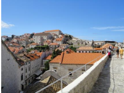
Første vue over det gamle Dubrovnik