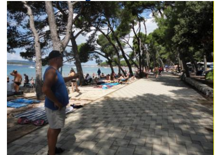
Strandpromenaden ind mod Biograd