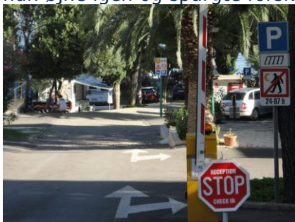
Indkørsel til Camp Seget