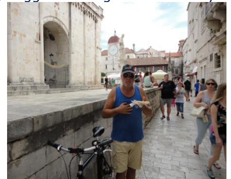
I det gamle Trogir