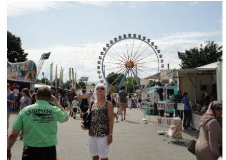
Sommerfestival i Olympia Park

forbi husene, hvor Olympiadedeltagerne havde boet den gang, og hvor Israelske atleter blev terrordræbt af Palæstinensere efter et gidseldrama under Olympiaden. Vi tog U3 direkte til Thalkirchen, og gik det sidste stykke frem til campingpladsen, hvor vi kl. 16.45, satte os udenfor i skyggen, for at slappe af efter en anstrengende, men dejlig tur. Vi kunne sidde og se, den sidste tømmerflåde komme sejlen ind, og som om det var bestilt, lagde den til lige overfor, hvor vi sad. Vi kunne følge, at det lille band på tømmerflåden gav ekstranumre, og at folk ombord hoppede og dansede. Nogen sprang i vandet for at blive kølet af. Efterhånden steg folk af flåden, så de mænd der ventede kunne begynde at skille den ad. Da den var skilt ad, blev den hentet med lastbil, så de kunne køre den ud til startstedet, så den kan være klar til morgendagens "Flossfahrt". Senere fik vi lidt let til aftensmad, og et velfortjent bad, inden vi hyggede os udenfor, imens mørket faldt på. Senere trak vi indenfor for at få en god nats søvn.