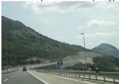
Undervejs mod Dubrovnik

Klokken 07.00 stod vi op. Vejret var lidt gråt, men efter vi havde fået markisen pakket væk og det andet pakket i bilen, begyndte solen at komme igennem. Med moveren fik vi campingvognen