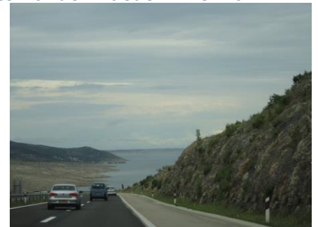
Undervejs i Kroatien

grænsen mellem Slovenien og Kroatien, som vi passerede kl. 05.45. Efter at have vist pas skulle vi efter et kort stykke på motorvejen igennem et betalingsanlæg for at trække en billet. Jeg fik ikke brug for pølsetangen (Billettangen), da jeg godt kunne nå billetten. Ved Zagreb skulle vi så betale i betalingsanlægget. Snart skulle vi igen trække en billet, som vi så skulle betale, når vi kørte af motorvejen. Vi havde nogle fantastiske vue, imens vi kørte ad motorvejen fra Zagreb mod syd, selv om vejret drillede ind imellem med veksling mellem regnbyger og solstrejf. Klokkeren 10.15 fortalte GPS, at vi skulle køre af motorvejen. Efter betaling af motorvejsafgift, kørte vi mod Bio-