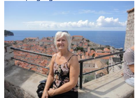
Vue over Dubrovniks tage