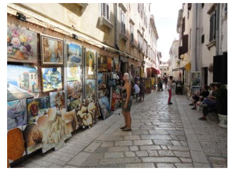
De gamle gader i Porec