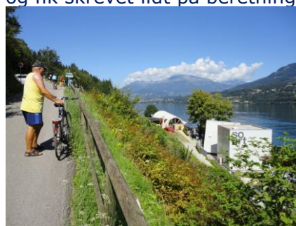
Stemmingsbilleder fra Millstätter See