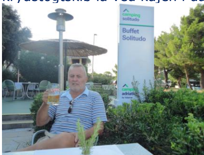
Tid til en øl