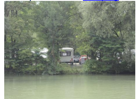
Vores plads på Camping Thalkirchen