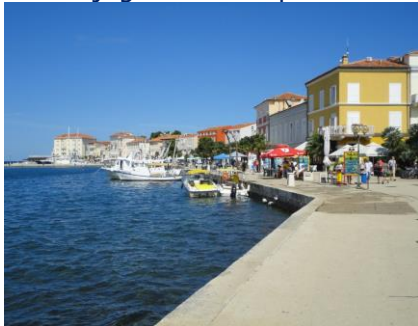
Havnepromenaden i Porec