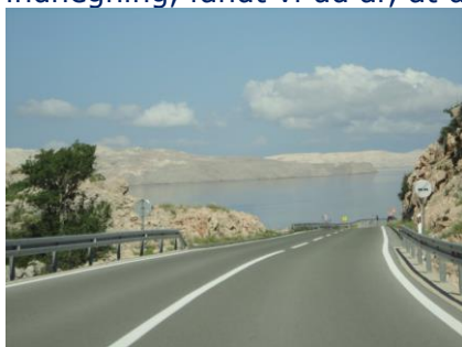
Udsigt mod "de skaldede øer"