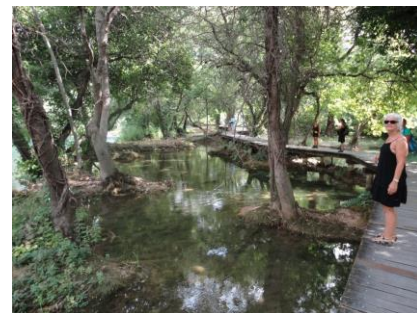
I Krka Nationalparken

Kl. 10.50 havde vi været turen rundt. Godt forpustede og godt forsvedte af turen tog vi bussen op til parkeringspladsen. Temperaturen var 27 °C, men da vi havde parkeret under nogle træer, var det hurtigt dejligt køligt i bilen. Vi tog samme rute tilbage og kunne parkere bilen ved campingvognen kl. 11.55 efter endnu en dejlig udflugt. Nu var det tid til lidt frokost med en Karlovacko øl til. Resten af dagen står på afslapning på campingpladsen, måske med en lille cykeltur langs strandpromenaden. Vi skal være klar til den lange tur i morgen mod Camping Valkanella på Istrien