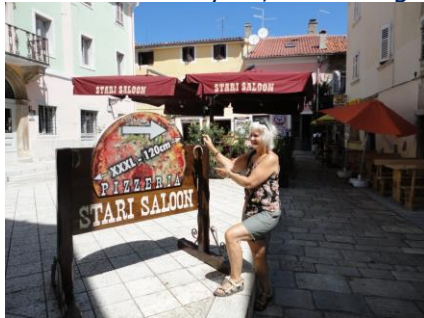
Pizzarestauranten med XXXL-Pizza