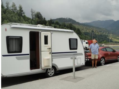
Klar til natpausen