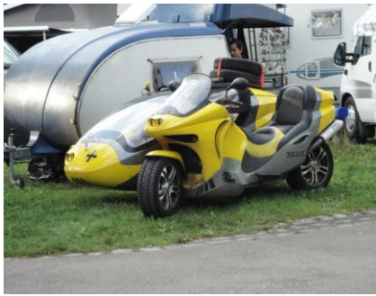
Campering på Motorcykel