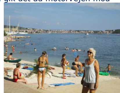
Stranden ved Camp Seget