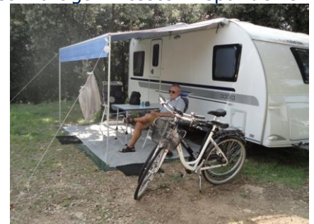
Afslapning på Camping Solitudo