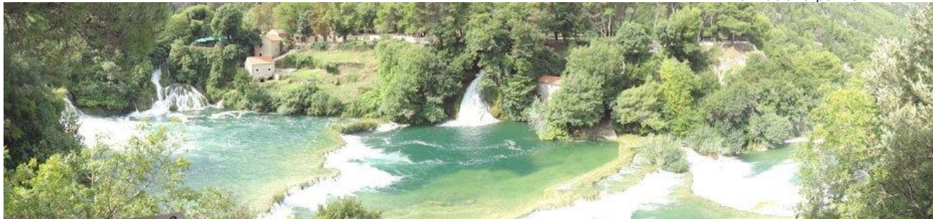
I Krka Nationalparken