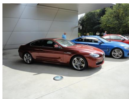
Stemmingsbilleder fra München