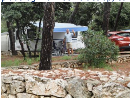
Camping Park Soline

grad og Camping Park Soline , hvor vi ankom kl. 10.45, efter at have kørt 1.800 km. Vi skulle bare finde os en plads, men da vi ikke er så fordringsfulde og kun regner med at være her i 2 overnatninger, valgte vi plads 548 som lå skråt over for Receptionen. Snart var campingvognen på plads og markisen slået op, så vi kunne få lidt at spise, og jeg kunne få skrevet lidt på beretningen. Om eftermiddagen slappede vi af under markisen, mens det regnede lidt ind imellem. Vi fik et velfortjent bad, og kikkede lidt rundt på campingpladsen. Det blev også til en tur langs