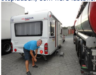
Klar til sidste natpause på turen

Vi vågnede midt om natten, kl. 04.10, ved politiets sirener, og at de i højtaleren sagde noget lignende: Kør i venstre spor. Samtidig kunne vi se lastbiler bakke på Rastepladsen, som var fuldstændig blokeret. Vi var noget forvirret, og jeg tog tøj på, for at finde ud af, hvad der skete. Det viste sig, at der på Autobahnen, var sket et uheld med en lastbil ved vejarbejdet, som begyndte lige efter rastepladsen. Uheldet havde blokeret Autobahnen fuldstændig, så det gav kaos på Rastepladsen, som flere lastbiler havde brugt for at prøve, om de kunne køre forbi noget af køen.