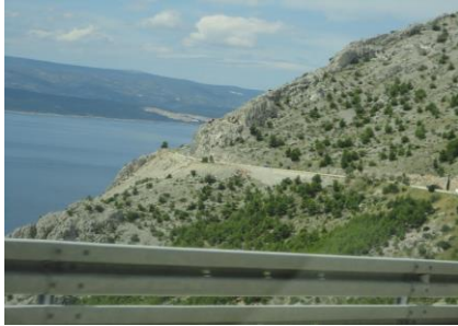
På vej mod Trogir

varm tanke til Guderup. Da vi kørte ud af Dubrovnik, skulle vi køre under den store bro og et godt stykke ud langs bugten, inden vi kunne dreje op ad vejen, som førte op til broen. Nu var vi så på Jadranska Magistrala, som vi skulle følge mod Split. Klokken 09.25 kørte vi ind i Bosnien. Der var lang kø den modsatte vej, men i vores retning skulle vi lige vise passet, og så gik det videre. Efter 10 km kunne vi så køre ind i Kroatien igen. Her var det på samme måde, bortset