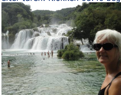
I Krka Nationalparken

Da vi stod op kl. 07.15, var der sol, 27 °C og lette skyer. Vi nød morgenmaden udenfor og gav os godt tid, så det blev til 2 blødkogte æg, men ingen "En lille en" – Det må vente til vi er tilbage efter turen. Klokken 08.40 begav vi os af sted mod Krka Nationalparken . Vi havde sat GPS til at