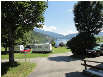
Udsigt fra Camping Pesenthein