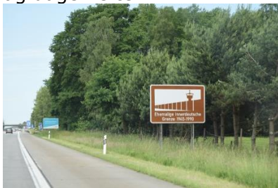
Innere Deutsche Grenze