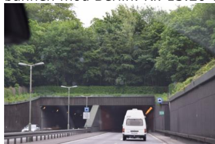
Tunnel under Tegel