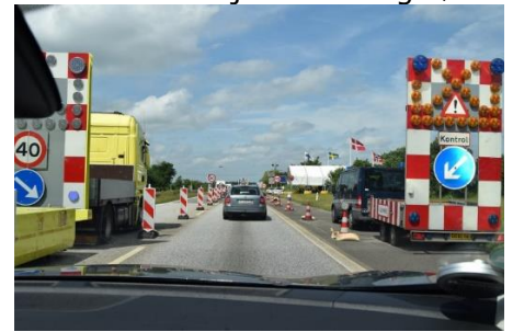
I kø ved grænsen