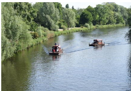
Tømmerflåder på Havel ved Potsdam

Vi vågnede kl. 07.45 og fik gardinerne trukket fra, så vi kunne nyde den dejlige udsigt ud til Spree og det flotte solskinsvejr. Kl. 08.50 havde vi spist en dejlig morgenbuffet, med alt hvad vi kunne ønske os, og gik op på værelset, for at gøre klar til dagens mission, en tur til Potsdam . Vi fik købt dagsbilletter til ABC nettet, og kunne kl. 09.00 begive os ud i det dejlige solskin og 22 °C. Vi gik ned til S-Bahn stationen Tiergarten, som ligger ca. 300 m fra hotellet, her steg vi på S-toget mod Potsdam Hbf. Fremme ved Potsdam gik vi gennem indkøbscentret, som er en del af banegården. Et rigtig flot center, som er milevidt flottere