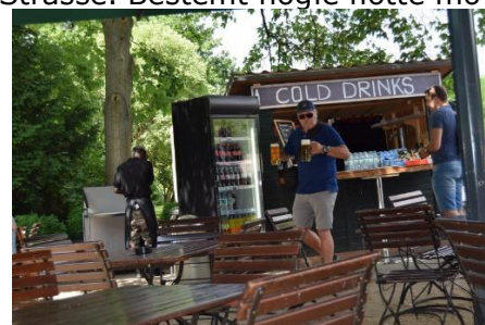
Tid til en øl ved Reichstag