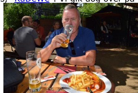
Biergarten: Fortjent øl og Currywurst

den anden side af vejen og fortsatte mod Kaiser Wilhelm Gedächtnis Kirche og Kurfürstendamm. Længere fremme lå et Karstadt varehus, så vi blev enige om at se, om de ikke havde en "Lebensmittel" afdeling, så vi kunne købe lidt til at tage med hjem. Vi fandt det vi ville og gik nu frem til S-Bahn Station Zoologischer Garten, hvor vi tog S-toget en station frem til Tiergarten. Der var 21 °C og solskin da vi kom ud fra stationen, så vi gik tværs over vejen og ind i en hyggelig Biergarten, hvor vi delte 2 Lemke Berlin øl og lidt senere en Currywurst mit Pommies. Da vi havde nydt øllen og vores forsinkede frokost,