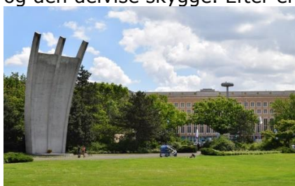
Platz der Luftbrücke

den anden side af vejen og fortsatte mod Kaiser Wilhelm Gedächtnis Kirche og Kurfürstendamm. Længere fremme lå et Karstadt varehus, så vi blev enige om at se, om de ikke havde en "Lebensmittel" afdeling, så vi kunne købe lidt til at tage med hjem. Vi fandt det vi ville og gik nu frem til S-Bahn Station Zoologischer Garten, hvor vi tog S-toget en station frem til Tiergarten. Der var 21 °C og solskin da vi kom ud fra stationen, så vi gik tværs over vejen og ind i en hyggelig Biergarten, hvor vi delte 2 Lemke Berlin øl og lidt senere en Currywurst mit Pommies. Da vi havde nydt øllen og vores forsinkede frokost,