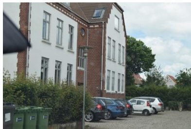
Kortegade 1, Haderslev