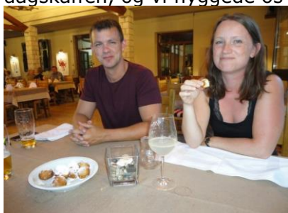
Æbleskiver "zum Abgewöhnen"