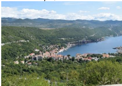
Magistralens slutning ved Rijeka