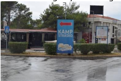
Ankomst på Kamp Strasko

Færgen var knap ½ fuld, og efter et kvarters tid, kunne vi køre fra færgen og op ad hårnålesvingene på den "skaldede" bjergside, med kurs mod Novalja. Langt op ad vejen holdt de i kø for at komme med færgen, og folk stod i en lang kø for at købe billetter til færgen. På denne side lå billetkontoret næsten helt nede ved færgen. Da vi kom op på toppen, kunne vi se ud over det næsten skaldede landskab og byen Novalja, som lå ude ved vestkysten, hvor der var en frodig bræmme langs kysten. Meget sjovt at opleve at østsiden og midten af øen er ufrugtbar, hvorimod