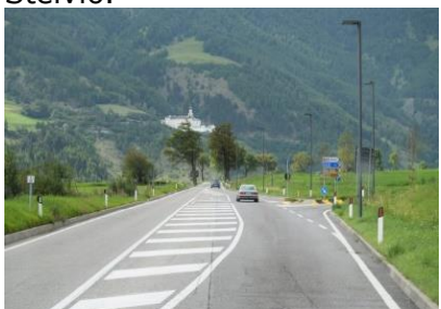
På vej mod Reschenpass

i 10 °C. Det vrimlede med mennesker på toppen, så vi næste ikke kunne komme forbi. Lidt efter toppen kunne vi dreje ind på en større grusplads, og nyde udsigten og få taget nogle billeder. Efter pausen fortsatte vi gennem 46 hårnålesving ned mod dalen. En flot tur, gennem hårnålesvingene, ned ad den, indimellem, stejle bjergside. På et sted kom 10 hårnålesving, hvor det ene sving afløste det andet, næsten uden at vi var kørt lige ud indimellem. På vej ned mødte vi to hold piger der var på vej op ad mod Stelvio passet på "Rulleski". På bukserne kunne vi se, at det var "Norske Jenter", som trænede, måske deltager de på et af de Norske langrens- eller skiskydnings landshold? 😊 Nede i Trafoi kunne man vælge 2 ruter, en til Schweiz og en ned mod Prato Allo Stelvio.