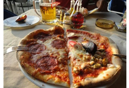
Stemningsbilleder fra Kamp Stoja i Pula