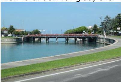
I Peschiera del Garda