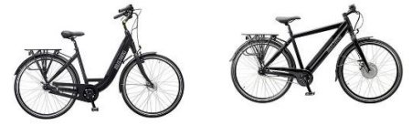
Vores nye cykler

Da vi kom hjem, snakkede vi om, at det nu kunne være dejligt, hvis vi havde cykler med på turen, og da Karin har lidt problemer med knæet, og jeg jo heller ikke kan løbe fra dåbsattesten, så besluttede vi os for, at vi måtte købe nogle Elcykler, så vi kunne tage dem med på turen. Og da vi jo skal have Chico (vores Chihuahua) med, så måtte vi se hvad "Petworld" havde, som vi kunne transportere ham i. Det blev til en lille hunde-cykelanhænger. Så nu er vi klar til cykel-ekspeditioner i de områder, vi kommer frem til. Ja, I tror nok, at vi er skøre, og det er vi måske også, men vi har det sjovt, er glade og får mange gode oplevelser. 😊