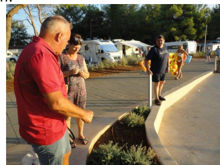
Blomster der dufter af Karry