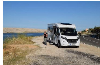
Stemmingsbilleder fra turen mod syd på Otok Pag

til Norge i 2015. Vi fortsatte videre mod syd og ved Dinjiska, kørte vi helt ude på kanten langs havet. Her holdt vi rast kl. 08.20, og nød udsigten i det dejlige solskin og 21 °C, mens vi spiste vore croissanter og fik fotograferet. (Kameraet var blevet koldt igen, mens vi spiste croissanterne ☹️) Pludselig kørte vi ud på broen, og næsten inden vi opdagede det, var vi kørt over den 315 m lange "Maslenicki Most", og var nu på fastlandet.