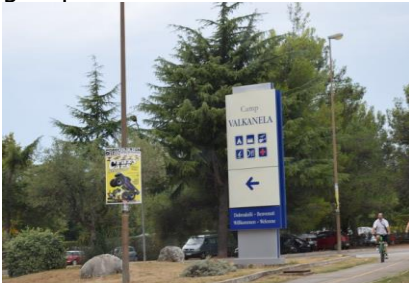
Tilbage ved Valkanella