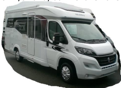
Hobby Optima De Luxe V65 GE