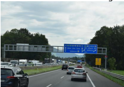
Kø mod den Tyske grænse

Efter en god nats søvn i den nye seng i autocamperen, stod vi op kl. 07.00 og gjorde os klar til at tage af sted. Klokken 08.10 kunne vi køre ud fra pladsen og sætte kursen mod syd ad A9. Der var tæt trafik mod München og videre mod Salzburg. Ved Irschenberg holdt vi et kort rast, for at købe Vignette til Østrig (€ 8,60). Videre mod Østrig tyndede det lidt ud i trafikken og fremme ved grænsen, kunne vi se at den Tyske Grænsekontrol gav kilometer lange køer for at rejse fra Østrig ind i Tyskland. Vi var glade for, at vi skulle den modsatte vej, og heller ikke senere på denne tur skal tilbage ad samme vej ind i Tyskland. Fremme hvor den Østrigske Autobahn delte sig mod Wien og mod Villach, var der stadig kø mod den tyske grænse. Jeg vil tro at køen var 7 – 8 km lang. Efter vi var kørt igennem flere kortere tunneller, kørte vi kl. 12.15 igennem den 6,8 km lange Tauerntunnel. Senere kom vi til betalingsanlægget, hvor vi