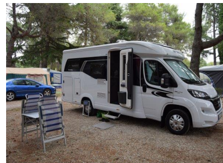
Så er vi på plads

Nåh ja, lægerne på Sønderborg sygehus, har før taget fejl, men så må vi jo tage andre steder hen. For gå ordentligt uden voldsomme smerter, det må være en menneskeret. Solen tit-tede frem ved middagstid, og vi nød eftermiddagen ude foran camperen, hvor 2 egern stod for underholdningen, ved at svinge sig rundt, og springe fra træ til træ. Ved 18.30 gik vi over til restaurant Smrikva, hvor vi spiste "Grillteller" med øl og "MisMas" til. Vi blev lidt bekymrede, mens vi spiste, for himlen blev hurtigt mørkere, og da vi kun lige var blevet færdige med at spise, så blæste det kraftigt op, så sandet begyndte at blæse rundt. Vi fik hurtigt betalt og gik hjem til camperen, hvor vi fik lukket for lugerne, og flyttet det løse udenfor ind under camperen. Så kunne vi nyde det i camperen, også da det senere begyndte at tordne og regne. Vi håber det får regnet af og buldret færdigt inden i morgen tidlig. Chico er noget utryg, men ham får vi nok trøstet. Han har det næsten som til nytår.