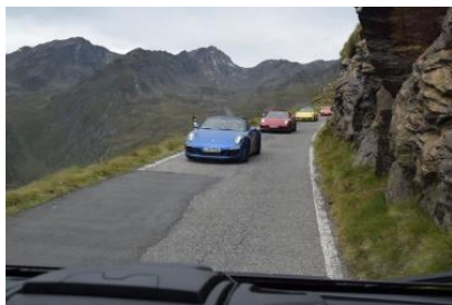
Passo del Gavia