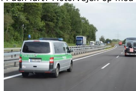
Udrykning på Autobahnen