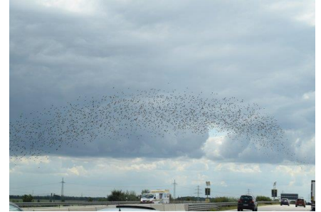
"Sort sol" over Autobahn A9

tæt trafik de sidste 2 – 4 kilometer inden fletningen. Lige efter fletningen er passeret går det igen derud af. Vi nyder vejret og landskabet. Vi ser bl.a. sværme af sorte fugle (faktisk som sort sol) flyve tværs over Autobahnen uden at ænse, at de kan blive ramt af bilerne. Senere hører vi 3 røde heste brøle, og pludselig farer 3 røde Ferrari forbi os, men snart må de bremse op, for der var vist nogen foran, der glemte at holde til højre. Det var nok danskere, for vi må sige at Tyskerne er væsentligt bedre til denne disciplin, end danskerne. Ved Raststätte Frankenwalde Süd (Innere Deutsche Grenze) tanker vi igen. Klokken er blevet 14.40, temperaturen 20 °C og der er vekslende sol og skyer. Vi kommer til flere vejarbejder, og ved de større er der det samme problem, som ved de andre med at få flettet ind, men snart fletter vejen sammen med A3 fra Würzburg, og trafikken bliver meget tæt. Efterhånden når vi Greiding, hvor vi drejer af Ausfahrt 37 og frem til Bauer-Keller, hvor vi finder plads i køen af ventende campister, som skal overnatte inden den videre tur i morgen. Temperaturen er 20 °C da vi kl. 17.30 parkerer på gruspladsen. Dejligt ikke at skulle spænde campingvogn fra og skrue støtteben ned, men vi får nu alligevel den obligatoriske "rejsegilde øl". Senere går vi ned på restauranten, hvor vi nyder dejlig mad med mørk øl til. Klokken 21.30 går vi til køjs for at være friske til morgendagens videre tur mod varmere himmelstrøg.