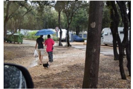
I regn og slud skal hunden ud!