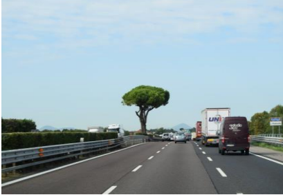
På motorvejen mod Verona

Vi stod op kl. 06.30, så vi var klar til at afregne kl. 07.00, som der stod i campingpladsfolderen, men der var lukket. Jeg snakkede med en af vagterne, og han fortalte at receptionen først lukkede op kl. 08.00, men han kunne da tage strømmen fra, så vi var klar til at køre. Klokkeren 08.00 stod jeg klar ved receptionen, og fik tjekket ud, så kl. 08.15 kunne vi trille ud af pladsen i 17 °C.