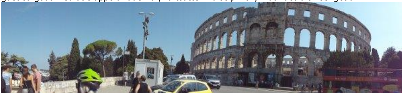
Den Romerske Arena i Pula

Eftermiddagen brugte vi til at slappe under pavillonen foran camperen. Det blev vist også til en lille blund indimellem. Aftensmaden var de sidste af Karins frikadeller, med brød og tomat / Mozzarella salat til. Da det var gået så godt med at slappe af udenfor, fortsatte vi disciplinen, indtil det blev sengetid.