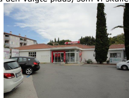
Supermarkedet i Ankaran

Tilbage "på sporet" kom vi hurtigt fra til Ankaran og kunne køre ind foran receptionen til Camping Adria. Det blev noget af en forestilling, at få sig meldt til. Først stod jeg i kø ca. ½ time, inden jeg kom frem til skranken ☹️. Så fik jeg at vide, at jeg skulle finde en plads, og komme tilbage ☹️. Så stod jeg igen i kø en ½ times tid, inden vi fik lov til at køre ind på den valgte plads, som vi skulle ligge på en nat ☹️. Nå, kl. 15.50 kunne vi trille ind på plads 77. Da vi var godt tørstige, gik jeg ned til campingpladsens butik, men den var lige lukket (kl. 16.00), så det gav ingen øl, til at køle os ned med ☹️. Tilbage i camperen fandt jeg Google Maps frem og kunne se, at der muligvis var en indkøbsmulighed på den anden side af hovevejen, ca. 500 m fra campingpladsen, så det måtte jeg lige se på. Heldigvis var der et Mercator supermarked, så jeg fik øl og andre fornødenheder. Karin sad og slikkede det solskin, som tittede mellem træerne, da jeg kom tilbage til camperen. Hurtigt fik vi os lidt at køle ned på. Karin en Limonj og jeg en kold Staropramen øl.