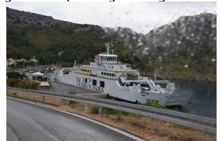
Færgen til Otok Pag

torden og ikke et uheld. 😊 Vi fandt hurtigt hen til Magistralen (Hovedvej 8), som vi fulgte langs kysten. Det var en fantastisk flot tur, med flotte udsigter og meget afvekslende terræn. Efterhånden var vi nået frem til Prizna, hvor vi drejede ned mod færgen Prizna – Zigljen (Pag). Vejen ned til færgen snoede sig ned af den stejle bjergside i store hårnålesving, og vi kunne se, at færgen lå klar til vi kunne køre ombord. Vi var nok så fokuseret på, at komme med færgen, at vi ikke så / opfattede skiltet med, at vi skulle købe billet i et skur ca. 200 m før færgen, så da vi kørte ind på færgen, blev vi meget bestemt bedt om at bakke ud og køre op for at købe billet. Nå skidt, vi kørte op og fik ikæbt billetten, ved en noget mere imødekommende person. Så kørte vi ned og ud på færgen, som kl. 11.30 lagde fra og satte kursen over mod Otok Pag.