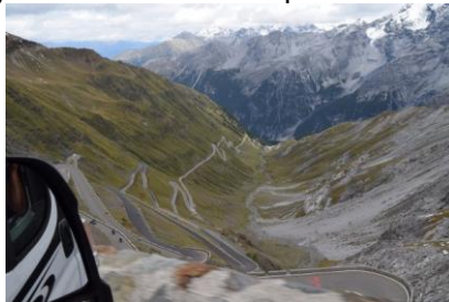
Passo del Stelvio