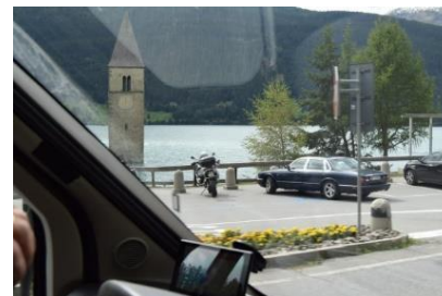
Kirketårn i "Stausee"