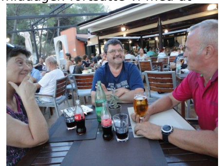
Aftensmad på Smrikva