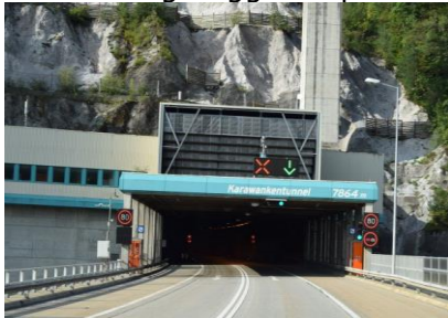
På vej gennem Karawankentunnel

Vi vågnede kl. 06.30, det var kun 9 °C udenfor, og da vi trak fra vinduerne kunne vi se, at der var fuldstændig dugget til på forruden. Vi kunne også mærke, at græsset var iskoldt, da vi gik på det.