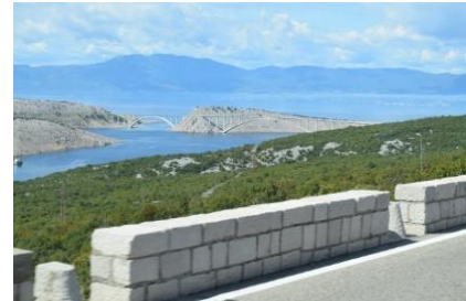
Fra turen op ad Magistralen