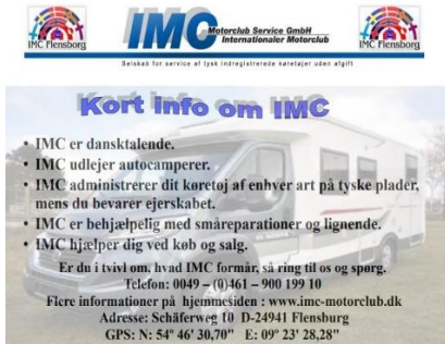
Hvad er IMC