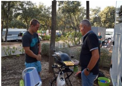
Far og søn griller