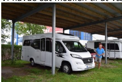
Så er Camperen parkeret

Vi havde sat mobilen til at vække os kl. 06.20, så vi kunne nå frem til IMC, inden de åbnede.