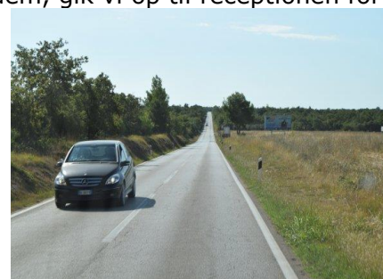
På vej mod Pula

Klokkeren 09.10 kunne vi, i 27 °C, køre ud fra Kamp Valkanella, og sætte kursen mod Pula. Vi valgte at tage landevejen, og nød at vi ikke skulle køre med den brede campingvogn efter bilen, da vejen var ret smal. Mange steder kun 2,50 m i hvert spor, og da campingvognens bredde er 2,45 m, så er der nu ikke meget at gøre med. Vi kørte forbi Limski Kanal, eller Lim-