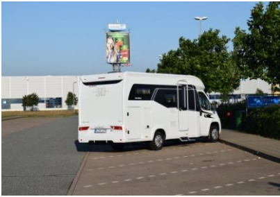
Første billede af vores Autocamper!

bahn A24 på vej mod Berlin. Der var stadig langt mellem bilerne på Autobahnen, og kl. 11.20 drejede vi i 21 °C og solskin, ind på Raststätte Fläming, hvor vi nød vores medbragte frokost, bestående af de obligatoriske Laksesandwich og et pølsebrød. Efter vi flettede sammen med trafikken fra Rostock og satte kursen mod Potsdam, blev trafikken meget tættere, måske har vi ramt et færgetræk? Nej det er vist den tyske trafik ved storbyerne, for det fortsatte også efter vi passerede Potsdam, og videre mod syd ad A9 mod München. Vi kom til nogle vejarbejder, hvor der, når Autobahnen snævres ind fra 3 til 2 baner, er kø. Nej nærmere