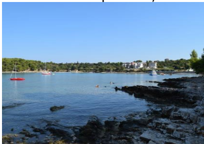
Der snorkles ved Kamp Stoja

fjorden, som den kaldes på dansk. Det var lidt svært at få billeder fra camperen, idet beplantningen skærmede meget af, så vi kun kunne få nogle enkelte indkik, men skidt vi har jo set det mange gange tidligere. Omkring kl. 10 kunne vi se Pula's skyline foran os, hvis man kan kalde den sådan. Vi fulgte skiltningen mod Stoja, og kørte forbi den gamle "Romerske Arena", og videre langs havnen, inden vi drejede af mod Kamp Arena Stoja, som ligger 3 km fra Pula centrum. Vi fik os meldt i receptionen, hvor de sagde, at vi kunne finde os en plads, hvor vi ønskede at slå os