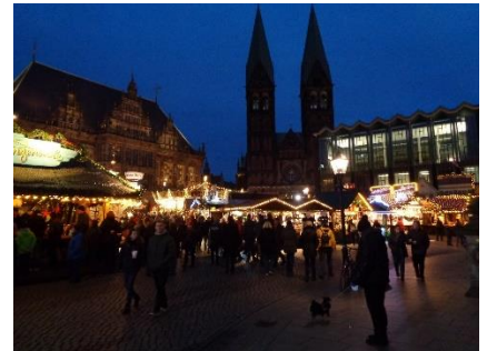
Indtryk fra Julemarkedet i Bremen