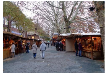
Julemarked ved Sørøverne

Vi hyggede os fantastisk, mens vi gik flere gange rundt på markedspladsen og rundt om de gamle bygninger. Efter rundturen gik vi tilbage til den del af julemarkedet, som lå langs floden, og fik os en "Schnitzel mit Kloblauchsoße im Brot". På markedspladsen var der traditionelt julemarked med "Glühwein, søde sager og Bratwurst". Vi syntes det var hyggeligt og mere "luft", at gå gennem markedsdelen langs floden. Efter vi havde fået lidt godt at spise og drikke gik vi tilbage til Camperen hvor vi hyggede os, efter besøget på det, vi syntes, "var det flotteste / bedste Weihnachtsmarkt vi nogensinde har besøgt". 😊 🇩🇪