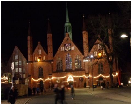
Oplyste gamle huse

under rådhuset på Markt Lübeck, og gik gennem julemarkedet. Det var lidt mere "sammenklemmt" end i Bremen. Vi fortsatte gennem "Historischer Weinachtsmarkt", inden vi, efter en "Glühwein und Knacker mit Brot", gik hjemad mod camperen, hvor vi hyggede resten af dagen med at læse lidt. 📖