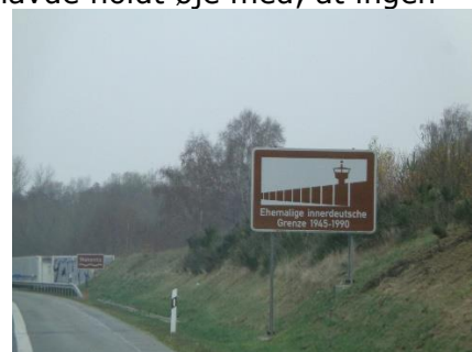
Markering af den gamle grænse

Wohnmobilpark Westhafen, Wismar, N 53 53 40 - Ø 11 27 06