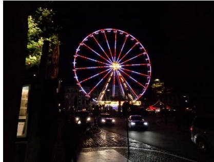
Indtryk fra Julemarkedet i Lübeck