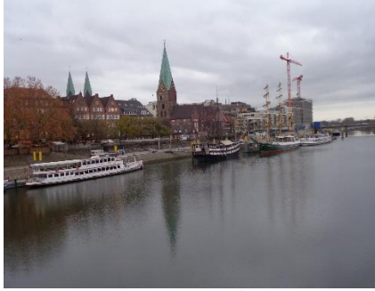
Skibe i havnen på Weser

Da vi gerne ville tidligt til Bremen, valgte vi at tage Autobahnen. Først skulle vi igennem Lüneburg, hvor folk var på vej til arbejde, men det gik let, og snart var vi på Autobahnen med kurs mod Hamburg. Ca. 20 km før Hamburg drejede vi over på A1, som vi fulgte frem til Bremen. For at nå frem til Stellpladsen skulle vi gennem Miljøzone, men da vi kører i en Camper med Euro6 motor, er det ingen problem. Vi blev lidt overraskede over, hvor få Campere der holdt på den store Stellplads. Der var slet ikke samme belægning som i Hamburg og Lüneburg, så vi kunne vælge lige den plads, vi havde lyst til, og kunne hygge os i Camperen indtil vi ville gå ind til Julemarkedet i Bremen Altstadt 🇩🇪.