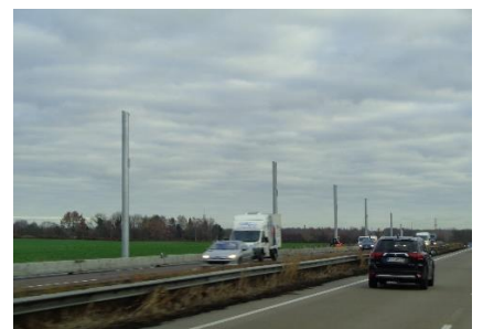
Master til hvad?

Det var mørkt, da vi stod op. At det var mørkt, var måske fordi camperpladsen lå skønt under nogle træer. At det var koldt, var nok fordi vi stod op en time tidligere op, end de andre steder, da vi skulle ud på turens længste tur, nemlig til Lübeck. Vi kørte ind gennem Bremen, som er "Miljøzone", men vi kører med "Euro6 motor" og har grønt Miljømærke, så uden problemer kunne vi køre ad hurtigste rute ud af Bremen og fortsætte på Autobahnen med kurs mod Lübeck. 😊