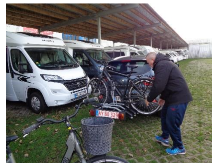
Cykler tages med hjem for vinteren

Vel hjemme blev tingene lagt væk, der blev vasket og gjort klar, så vi er klar til næste sæson 🧊 😊 😊 😊. "We'll be back" 🙄.