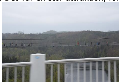
Hængebro ved Dæmning