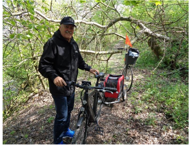
På stien mod Goslar