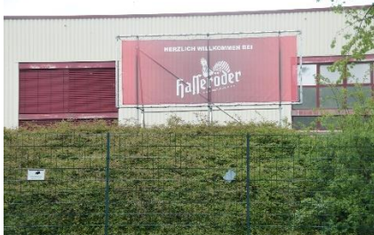
Hasseröder byder velkommen, men vi følte os ikke velkommen.

mennesker ude på broen. Vi var også kørt forbi mange gående fra parkeringspladserne, som gik langs vejen mod hængebroen. Da vi kørte over den høje dæmning, kunne vi se over til menneskerne, der gik parallelt med os ude på hængebroen. Der var godt nok langt ned. Senere kom vi til Rübeland, hvor der var mange mennesker på gaden, som ville besøge de mange huler i området. Vi fortsatte mod Wernigeode, hvor vi havde planlagt, at overnatte og besøge Hasseröder Bryggeriet. Men lige inden vi kom til Wernigeode, begyndte det at regne kraftigt, så vi blev enige om at springe en overnatning på en Parkeringsplads over, og i stedet køre til Harz Camping. Forinden var vi et smut forbi bryggeriet, men måtte opgive besøget, idet deres P-plads kun var til små personbiler, og ikke havde plads til en Camper på 7,5 m. Nå pyt, så må vi besøge Hasseröder Bryggeriet en anden gang, vi er i Harz, og vejret er godt. Vi