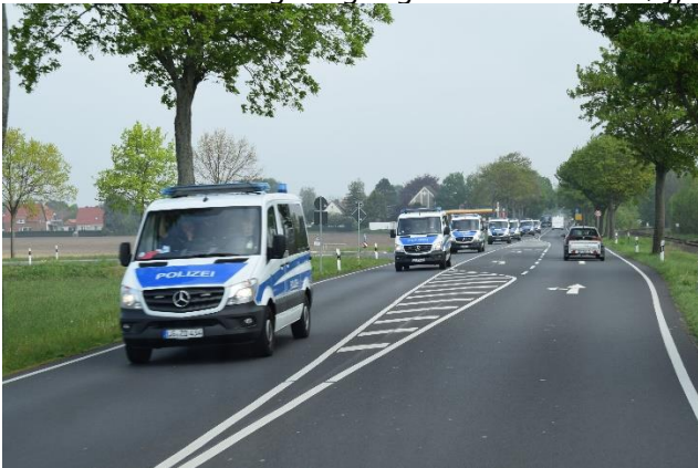
Politiet er undervejs