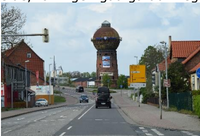
Undervejs mod Neustadt / Harz

Vi havde sovet godt, mens regnen havde trommet på taget, stort set hele natten. Vi vågnede tidligt ved, at det var lidt køligt i vognen – Gasflasken var løbet tør – Vi lagde os over på den anden side, for ingen gad gå ud i regnen for at skifte flaske. Vi sov alligevel til ved godt 7 tiden, hvor jeg