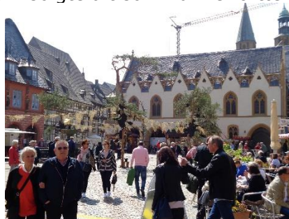
Indtryk fra Goslar