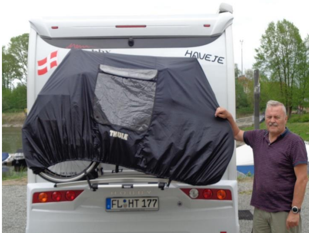
Så er der navn på "Haveje"