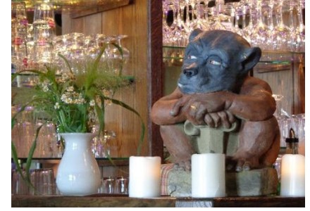
Trold i restauranten

Efter en forfriskning valgte vi at gå op gennem skoven til en borgruin, hvor vi efter den stejle opstigning nød borgruinen, men nok mest den dejlige fadøl, som vi fik i den hyggelige restaurant. Efter vi havde nydt udsynet ud over området, gik vi ned til campingpladsen, hvor vi fik et dejligt bad, inden vi nød det ved Camperen resten af dagen.