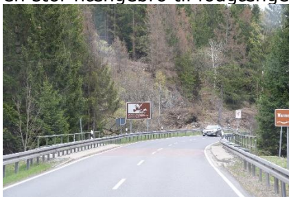
Zonegrænse krydses igen - igen

mødt af Heks, som stod på gaden, hang i lygtepæle og i træer, og mindede os om Walpurgis. Kort efter Hohegeiß drejede vi mod Rappbodetalsperre, hvor der ved siden af den store dæmning var en stor hængebro til fodgængere. Det var en stor attraktion, for vi kunne se, at der var mange