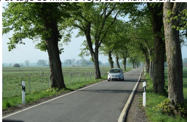
Ad smalle veje i det tidligere grænseland

Efter en stille og rolig nat, kunne vi efter morgenmaden, som den første Camper trille ud på vejen og sætte kursen mod syd. Vi havde besluttet os for, at tage de mindre veje, så vi kunne følge Elben mod sydøst, og frem til Magdeburg. På første stykke krydsede vi grænsen mellem Niedersachsen og Mecklenburg-Vorpommern (Vest og Øst) flere gange. Vi kunne tydeligt se, at der var stor forskel på vedligeholdelsen af husene og specielt i øst stod "gamle udrangerede / forfaldne landbrugsbygninger" fra tiden med de store kollektive landbrug. Efterhånden var vi helt inde i det "tidligere Østtyskland", hvor vi kørte gennem lange strækninger med skov. Nogen steder var der skilte i vejsiden, der fortalte, at det var livsfarligt, at gå ind i skoven, da der ikke var ryddet op for farlig ammunition. Da vi kørte igennem en landsby, kunne vi se, at der på en mindre gård, ud over køer, heste, grise og får også gik nogle langhårede lamaer i en indhegning. Lidt "sjovt."