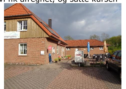
Camping am Waldbad i Neustadt

tog en af "Harald Nyborgs" en-gangs regn poncho på, og fik koblet en anden gasflaske på, så vi fik varme på. Efter morgenmad trillede vi op til receptionen, hvor vi fik afregnet, og satte kursen mod næste mål. Da vi kom ud fra Campingpladsen, valgte vi at køre en anden vej ud til den store vej mod Magdeburg. Vi ville hellere køre en mindre omvej, end på den ujævne betonvej. Vi fik set lidt andet, og slap for de store rystelser, inden vi nåede den store vej mod Magdeburg. Vi snakkede lidt om, det nu var klogt, at køre til næste overnatningssted, eller om vi ikke skulle køre til "Dora Mittelbau", som vi ellers ville besøge i løbet af dagen. (Dora Mittelbau er hvor Hitler byggede sine V2 bombere, og som var et vigtigt mål, som de allierede og Russerne satte alt ind på at komme først til) Vi besluttede os for at køre til "Dora