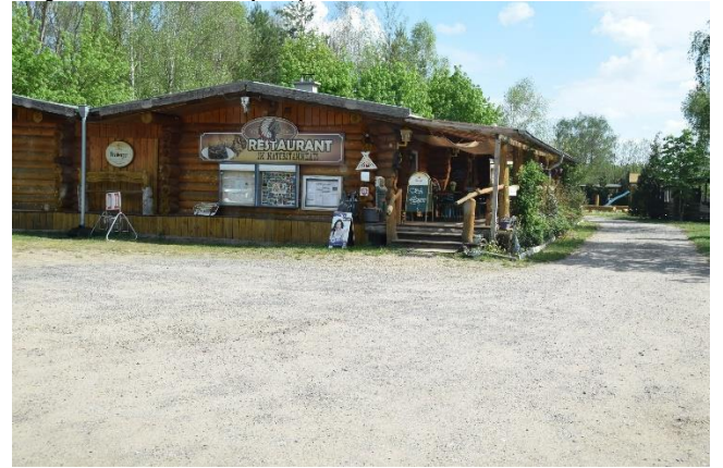
Receptionen ved Das Indianer und Tipi-Dorf

op. Vi måtte lige køre en runde og finde en anden vej frem til Camperpladsen "Am Winterhafen". Her var fyldt godt op, og da vi syntes, det var noget simpelt, og uden orden, så besluttede vi os for, at finde en campingplads, som lå et stykke nord for Magdeburg. Vi satte kursen mod Das Indianer und Tipi-dorf, Bertingen. Det første stykke fra Magdeburg var på fin Bundesstrasse, senere ad landeveje og de sidste 5 km, ad betonvej, som var så ujævn, at det mindede os om vores tur til Polen. Heldigvis viste det sig, at vi kom frem til en hyggelig lille campingplads, hvor vi kunne holde på et dejligt eng-areal. Vi faldt pladask for receptionen og den lille restaurant i bjælkehuset, så vi var nødt til at gå derop til aftensmad, men desværre var der kommet flere udefra, så alt var optaget. Så i stedet nød vi en ostemad og et enkelt glas vin i Camperen.