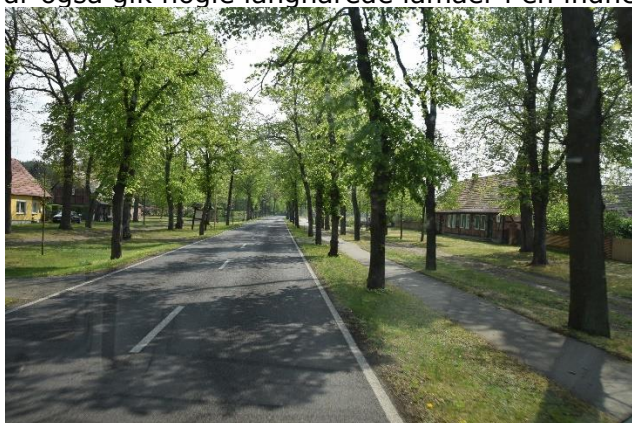
De typisk "østtyske landsbyer" ved Elben

Længere nede langs Elben, blev landsbyerne mere særprægede, idet husene lå 10 - 15 m fra vejen og arealet ind til husene var græsribat, hvor beboerne kunne parkere. De næste mange landsbyer, som lå med en afstand på ca. 2 km, var alle med græsribat foran. Jeg tror, det er et levn fra "Den kolde krig" eller måske Verdenskrigene, hvor der skulle være plads i landsbyerne til militærtransporter på langs af Elben, så man hurtigt kunne komme frem. Da vi senere kørte på endnu mindre veje, og kom til landsbyer, så var der brosten på vejen igennem byen. Ikke noget som Chico syntes om. Det gjorde vi heller ikke, for det rumlede og bumlede, men vi huskede vores tur til Polen sidste forår. Og ved siden af den, var dette småting. Efterhånden som vi nærmede os Magdeburg, blev vejene større og landet mere åbent. Snart kørte vi ind i Magdeburg, og blev snydt af GPS'en, eller var det af kommunen, der havde sat midlertidige skilte