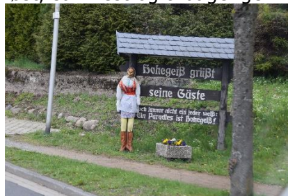
Hekse i Hohengeiß