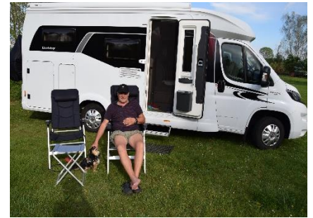
Stemningsbilleder fra Das Indianer und Tipi - Dorf