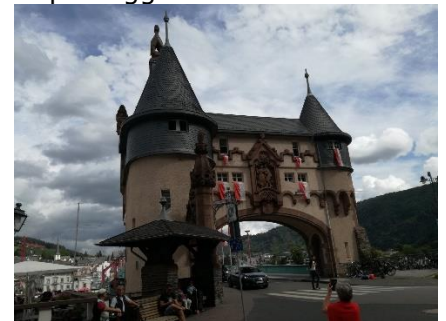
Port til Broen i Traben-Trarbach

Vi startede med at køre "nedstrøms" langs Mosel til broen, som førte os over til Reil. Her kunne vi køre langs Mosel, ad en mindre vej og senere en cykelsti frem til Traben-Trarbach.