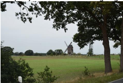
Vi kører på Deutsche Mühlenstrasse