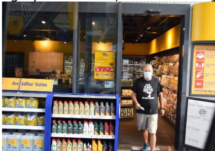
Så er der tanket Diesel

Vi havde alt stående i entreen, så det var let at få læsset ud i bilen, og vi var klar til at køre hjemmefra kl. 08.00, og sætte kursen mod Flensburg og vores Camper hos IMC. Her fik vi læsset om og byttet bilerne, så vores Kadjar kunne hygge sig i carporten til, vi vender tilbage.