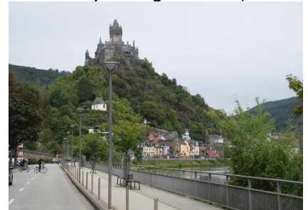
Borgen i Cochem

tidligt afsted, besluttede vi os for at følge Mosel til Koblenz. Det var en dejlig tur, kun afbrudt af et indkøb i REWE i Cochem. Efter indkøbet fortsatte vi mod Koblenz, hvor vi kørte over på B9, så vi kunne køre langs Rhinen, med udkig til de mange borgruiner og ikke at glemme Loreley klippen, hvor mange søfolk i gamle dage måtte lade livet da "die Loreley" sang så kønt, at de glemte at styre skibet, og derfor forliste. Vi kom fint forbi Loreley, godt nok på modsatte bred af Rhinen, og kunne