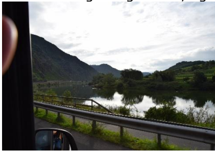
Undervejs langs Mosel

I dag var det Chico, der bestemte hvornår vi skulle stå op. Kl. 06.30 ville han ud for at blive luftet, så vi fik tidlig morgenmad, og kl. 08.00 kunne vi køre ud fra den dejlige Camperplads. Da vi var