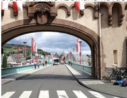
Et kig over broen mod Trarbach

I Traben-Trarbach kørte vi under den flotte bro, som forbinder de 2 bydele som giver bynavnet. Vi fortsatte lidt ad promenaden og drejede op i byen, så vi kunne komme over broen til den anden side af Mosel, hvor vi kørte gennem "Brückentor", og var i Trarbach. Her gik vi en tur i de gamle gader, inden vi fortsatte vores rundtur ad "Moselradweg" til Enkirch, hvor vi drejede ind gennem den smalle hovedgade. Fremme ved den "prisbelønnede" slagter fik vi købt kød ind til grillen, og ved bageren et dejligt brød. Den lille købmand havde middagsslukket, så vi kørte tilbage til camperen, hvor vi fik en dejlig frokost, og slappede af efter en dejlig cykeltur på 22 km. Senere tog vi igen cyklerne og udforskede byen lidt, inden vi fik handlet lidt ved købmanden og kunne tage tilbage til camperen, for at smage på en af flaskerne. Senere grillede vi de lækre steaks med "grillede Bratkartoffel". En lækker aftensmad, som vi nød med et enkelt glas dejlig vin i det dejlige vejr. Men ad aftenen trak vi indenfor, så jeg kunne få skrevet lidt, men