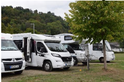
Vi holder i forreste række mod Rhinen

Det havde regnet lidt om natten, men da vi stod op, var det dejligt vejr, og det så ud til at solen kunne få jaget nogle af skyerne væk. Formiddagen nød vi med at kigge på skibene, som sejlede forbi. Efter frokost startede vi en gåtur, hvor vi ville gå langs med den gamle bymur, som er resterne af et stort fæstningsværk, fra ca. år 1320, med mange tårne og en større borg. Mange af tårnene er restaureret, og står som de så ud for mange hundrede år siden, andre er delvis restaurerede og giver sammen med borgen og bymuren indtryk af et næsten uovervindeligt fæstningsværk. Borgen er helt restaureret og benyttes i dag som "Jugendherberge" (Vandrerhjem). Det er meget bogstaveligt, at det er "Jugendherberge" for det er kun unge, som kan gå op ad den stejle sti med bagage, og stadig have luft til at bede om overnatning. Fremme i syd enden af Bacharach fandt vi starten på stien rundt om bymuren.