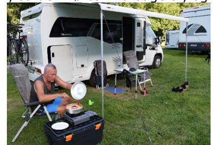
Så er der gang i vores Omnia

vinmarker, og med slotte på bjergene langs Rhinen. Kort før Koblenz kørte vi over Rhinen og videre ned mod Mosel, som vi, i 20 °C og solskin, fulgte frem til Traben-Trarbach, hvor et skilt i indkørslen til pladsen fortalte, at alt var optaget – 0 ledige pladser. Nå, vi havde set en Camperplads, hvor der var ledige pladser, ca. 4 km før Traben-Trarbach, så den kørte vi tilbage til, og fandt en dejlig plads. I 21 °C fandt vi kl. 13.30 en plads på " Wohnmobilstellplatz Enkirch ", hvor vi fik os placeret med udsigt til Mosel. Efter en velfortjent "rejsegilde-øl" fik vi set os om på Camperpladsen, og senere en lille tur i vinbyen Enkirch, hvor vi fik købt et par flasker lokal Moselvin ved en ældre mand, som havde en lille købmandsforretning. Tilbage ved camperen nød vi resten af dagen i solen, og fik en smagsprøve på den ene af de nyindkøbte moselvine. Det var nu ikke vinen, der fik os til at beslutte, at blive nogle dage her, men de gode muligheder for cykelture langs Mosel. Nu glæder vi os til morgendagen, hvor vi tager en rundtur på cykel til Traben-Trarbach. Godnat!