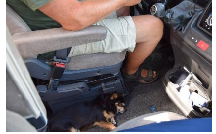
Chico nyder vi er i Flensborg

re udenom motorveje, indtil vi havde krydset Elben øst for Hamborg. Det blev en rigtig flot tur, hvor vi kørte ad mindre veje gennem skovstrækninger, majs-, kartoffelmarker gennem Lüneburger Heide. Solen var flink til at skinne på os på turen mod Lüneburg hvor vi, mellem aspargesmarker, kørte over på B404 og krydsede Elben. Et vejarbejde fik os til at tage en alternativ vej, men ved Trittau kom vi igen tilbage på B 404, som senere gik over i A21 mod Kiel.