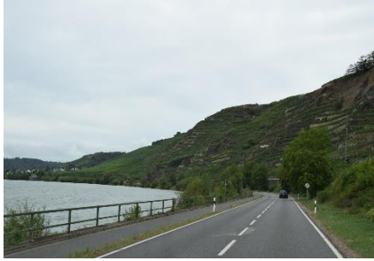
Vinmarker ved Mosel

mundten. I en af Ruhrbyerne, kunne vi se busserne køre i midterrabatten på Autobahnen, lidt specielt så det ud, men trafikken hindrede os i at finde den logiske forklaring. Efter vi kom fri af Ruhr-området tyndede det ud i trafikken, og vi kunne nyde turen videre, nu ad Bundesstrasse gennem