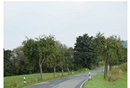
Frugttræer som vejtræer

Vi nød morgenen lidt længere, end vi plejer, da vi kun skulle ud på en tur på ca. 200 km. Vi havde hørt, at der var store problemer med vejarbejde og køer på A7 omkring Fulda, så det passede fint, at vi ikke ville køre på motorvej. Vi kørte fra Camperpladsen kl. 08.30 og kørte ad snoede veje gennem skove og over de små bjerge i Weser Bergland. Undervejs på turen mod Uslar, kunne vi se ned til Lippoldsberg, vi lige havde forladt. Efter vi havde handlet lidt fornødenheder i Uslar fortsatte vi ad Märchenstrasse, hvor der på en strækning, groede æbletræer langs vejen. Senere kørte vi igen, igen over på B3, hvor vi flere steder så campingvogne med hjerter på. (Nok ikke fordi de var glade for os – men at de var glædespi...) Selv om vi flere gange kørte over på andre veje, så kom B3 til at forfølge os, idet vi 4 - 5 gange kom ind på B 3 igen. Undervejs kørte vi forbi Kz Bergen - Belsen, og fremme i Bergen forbi det store militære område, som også stammer fra 2 verdenskrig. Længere fremme kørte vi forbi " Bechlingen War Cemetery " for faldne allierede soldater. Endnu en gang kørte vi over på B3, inden vi det sidste stykke kørte på en kommunevej frem til " Süd-See Camp " hvor vi kl. 12.30 fik parkeret, og sagt tak for en dejlig afslappende og afstressende tur, med fantastisk flotte landskabelige oplevelser. Her nød vi den sidste eftermiddag og aften på denne tur.