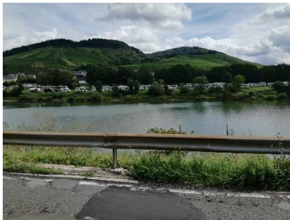
Vi ser over Mosel til Camperpladsen

Vi havde god tid og nød morgenmaden, inden vi fik cyklerne taget ned fra camperen og gjort klar. Chico's vogn blev samlet og sat fast på min cykel, og kl. 10.45 kunne vi trille af sted i det dejlige vejr. Havde besluttet os for at tage en lille rundtur med 2 broer, så vi kunne køre langs Mosel på begge sider af floden.