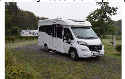
Så holder vi i "Haltern am See"

Ved Münster kørte vi over på A43, som vi fulgte, til vi drejede ind mod Haltern am See. Vi fandt let frem til vores overnattingsplads, " Wohnmobilpark Haltern am See ", hvor vi parkerede på plads 25, kl. 15.30. Efter vi havde betalt og fået sat strøm til, nød vi aftenen i camperen.