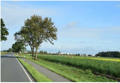
Der arbejdes i Aspargesmarken

re udenom motorveje, indtil vi havde krydset Elben øst for Hamborg. Det blev en rigtig flot tur, hvor vi kørte ad mindre veje gennem skovstrækninger, majs-, kartoffelmarker gennem Lüneburger Heide. Solen var flink til at skinne på os på turen mod Lüneburg hvor vi, mellem aspargesmarker, kørte over på B404 og krydsede Elben. Et vejarbejde fik os til at tage en alternativ vej, men ved Trittau kom vi igen tilbage på B 404, som senere gik over i A21 mod Kiel.