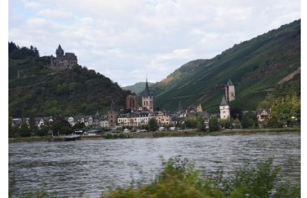
Kik over Rhinen til Bacharach

Ved Wiesbaden kørte vi over på A66 frem til Frankfurt, hvor der var vejarbejde og langsom kørsel. Kort efter kørte vi over på A5, som vi fulgte op gennem Taunustal. Efter et godt stykke kørte vi fra for at følge forskellige Autobaner og B3 i retning mod Kassel. I Kersten Hausen fik vi tanket diesel til 0,999 €. Det billigste på turen. Vi kørte nu over på A49, som vi fulgte til Hof Geismar, hvor vi igen kom over på B3, og senere ad mindre veje langs floden Weser til Lippoldsberg, hvor vi ankom kl. 13.20 på Stellplatz " Landhotel zum Anker ". Her fik vi parkeret med "snuden" ud mod Weser, så vi kunne se, de få kanoer der sejlede forbi, men vigtigst så vi kunne se den lille færge " Märchenfähre Lippoldsberg ", som blev trukket over floden af strømmen. (Strømmen i Weser sørger for at færgen sejler. Der er en wire tværs over Weser, hvor den hænger