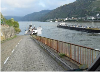
Vi tager færgen over Rhinen til Kaub

Efter vi havde nydt morgenmaden, gjorde vi os klar til at forlade Bacharach for denne gang, men vi kommer igen! Vi havde besluttet os for, at vi ville køre langs Rhinen mod Rhüdesheim, så vi tog færgen over Rhinen til Kaub, og kørte mod syd på B42. Der var vejarbejde tre steder, men vi var