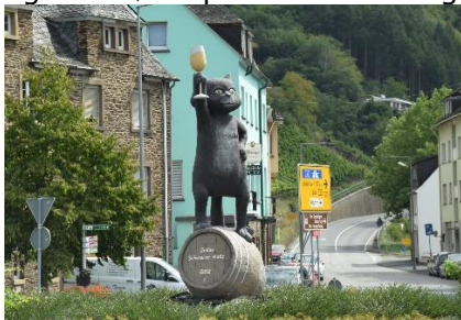
Så er vi i Zell am Mosel

Også her til morgen kunne vi se, at skyerne hang lavt, men ikke så lavt som i går. Til gengæld var de længere om at trække op over toppene. Hen ad formiddagen tog vi cyklerne for at køre i modsat retning af i går, nemlig med mål i Zell, ca. 15 km væk. Vi fulgte Mosel Radweg, men fremme i Riedel må vi have misset et af skiltene, for vi kørte ad hovedgaden gennem den lange smalle by, og kom først på Mosel Radweg, da byen sluttede. Efterhånden var vi fremme ved rundkørslen i