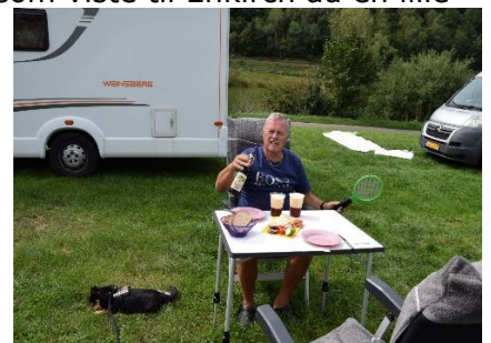
Så er der frokost, og hvepsejagt

by vi kom til, var Reil efter 10 km gennem vinmarkerne, her skulle vi ad broen over Mosel, så vi kunne komme tilbage til Enkirch. For enden af broen så vi et skilt som viste til Enkirch ad en lille vej op gennem vinmarkerne, så den valgte vi. Heldigvis kunne elcyklerne hjælpe os på ad de stejle veje, hvor vi havde en fantastisk udsigt ned over Mosel. Næsten fremme ved Enkirch gik det igen stejlt ned ad, så bremserne blev brugt flittigt, indtil vi trillede ind gennem byen og ned til Camperpladsen. Her kunne vi dele en velfortjent "Dunkel" efter dagens cykeltur på 34 km. Senere slappede vi af i solen foran camperen, og kunne se mørke skyer komme over bjergkanten, men det blev kun 17 dråber, og efter lidt tid tittede solen frem igen. Efter dejlig afslapning kunne vi pakke Chico's vogn i stuerummet og sætte cyklerne på Camperen, så vi var klar til at køre mod nye mål i morgen.