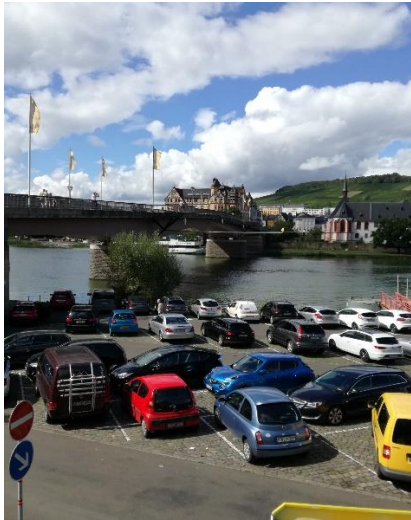
Så er vi nået til Bernkastel-Kues

Vi vågnede efter en god nats søvn, og kunne se at skyerne hang lavt ned over dalen. Vi nød morgenmaden, og kunne se skyerne kravle længere op mod bjergtoppen, og efterhånden begyndte solen at titte frem mellem skyerne. Nu var det tid til at begynde dagens "mission", nemlig en cykeltur til Bernkastel-Kues ad Mosel Radweg, en tur på 55 km inden vi igen kunne være tilbage ved Camperen. Heldigvis har vi elcykler, så vi startede den kønne tur langs Mosel, hvor vi kørte forbi Traben-Trarbach, og kunne se ind til Camperpladsen, vi kørte forgæves til i torsdags. (Vi er glade for byttet til Enkirch). Længere fremme kom vi til Graach am Mosel, hvor den fine Camperplads er lukket. Mosel Radweg går mellem floden og