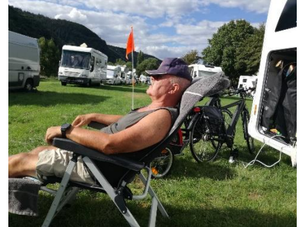
En træt gammel mand efter 55 km

Vi vågnede efter en god nats søvn, og kunne se at skyerne hang lavt ned over dalen. Vi nød morgenmaden, og kunne se skyerne kravle længere op mod bjergtoppen, og efterhånden begyndte solen at titte frem mellem skyerne. Nu var det tid til at begynde dagens "mission", nemlig en cykeltur til Bernkastel-Kues ad Mosel Radweg, en tur på 55 km inden vi igen kunne være tilbage ved Camperen. Heldigvis har vi elcykler, så vi startede den kønne tur langs Mosel, hvor vi kørte forbi Traben-Trarbach, og kunne se ind til Camperpladsen, vi kørte forgæves til i torsdags. (Vi er glade for byttet til Enkirch). Længere fremme kom vi til Graach am Mosel, hvor den fine Camperplads er lukket. Mosel Radweg går mellem floden og