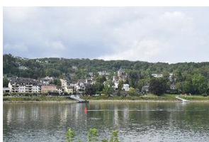
Stemning ved Rhinen

Dagens etape: 332 km. Turen indtil nu: 814 km.