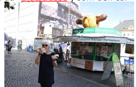
Vi nød en Original Thüringer Bratwurst

Marstall am Kegelplatz" som nu er Hovedarkiv for Weimar. Jeg troede, det var her, Weimarrepublikken var blevet til, men det store bygningskompleks, har en anden og mørkere historie, idet det var "Gestapo-Leitstelle" fra 1936 til slutningen af 2. verdenskrig, med alt det "onde", som fulgte med. Det var nu tid til at sætte næsen mod Campingpladsen, og nu gik det op ad bakke de næste ca. 5 km, inden vi drejede ind ad " Blutstrasse ", som den ca. 5 km lange vej ind til " Kz Gedenkstätte Buchenwald " hedder. Vi skulle dog kun køre 1 km, inden vi drejede ind i skoven, og ad skovveje kom tilbage til camperen, hvor vi fik et stort glas vand, inden vi nød et glas kølig hvidvin i skyggen bag "naboens" camper. Resten af dagen nød vi det dejlige vejr ved camperen. Det meste af eftermiddagen i skyggen, idet temperaturen udenfor nåede op på 31 °C, ihvertfald efter termometret i skyggen under Camperen (Har nok været et par grader lavere i skyggen). I camperen var det 32 °C selvom vi havde termomåten på forruden. Da det begyndte at blive mørk, trak vi indenfor, selv om temperaturen udenfor stadig her kl. 08.45 er 26 °C. Forhåbentligt falder temperaturen, så vi kan få en god nats søvn, inden vi i morgen tager cyklerne til "Kz Gedenkstätte Buchenwald", som i øvrigt var " Sowjetisches Speziallager Nr 2 " i tiden efter 2. verdenskrig.