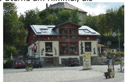
Her sælges træsnitte arbejder

Vi kørte fra Camperpladsen kl. 09.00, i 20 °C og sol fra en skyfri himmel i retning mod Elben og Pirna, hvor