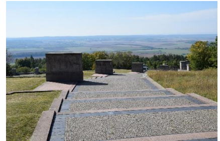
Fra Mindeparken med den flotte udsigt fra Ettersberg