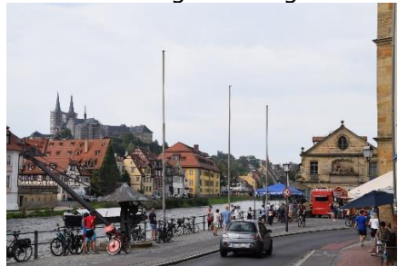
På vej ind i Bamberg