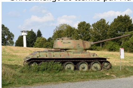
Russisk T33 Tank