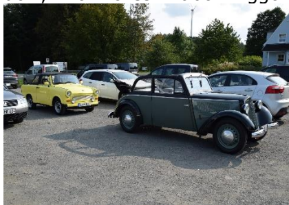
Trabi og IFA luftes