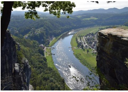
Udsigt fra Bastei til Elben

dens tuden, når den lagde til ved anløbsbroerne dybt under os. Området har for mange år siden været en fæstning, som ikke kunne indtages, og der er stadig velbevarede rester fra fæstningen, bl.a. Basteibrücke som stadig hænger mellem klippeformationerne, og giver adgang til selve fæstningskomplekset. Hvis man går forbi fæstningskomplekset, kan man ad stejle stier komme de mange meter ned til bredden af Elben. Det var nu ikke noget for os, for så skulle vi jo igen op ad bakken, for at komme til cyklerne, så vi kunne køre tilbage til Camperpladsen. Vi nød de mange fantastiske vue over Elben