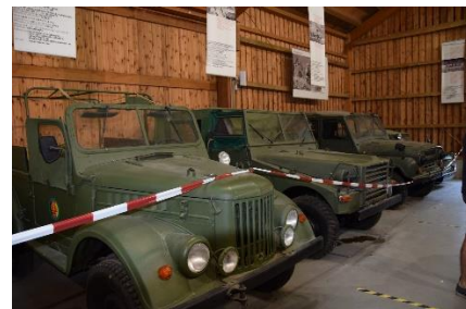
Udsnit af DDR vognpark