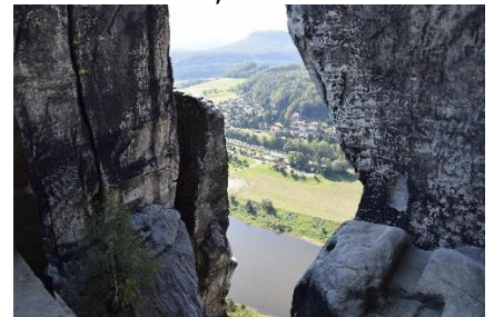
Udsigt til Elben fra Basteibrücke