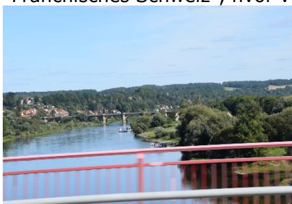
Vi kører over Elben ved Pirna

vi ikke havde lyst til at holde på en P-plads, blev vi enige om at fortsætte til Dresden, hvor vi havde gode minder. Efter et stykke på mindre veje, kom vi igen ind på A13 mod Dresden, og i 20 °C og stærk sol kørte vi nu mod Dresden. Fremme ved Dresden drejede vi ind mod Camperpladsen, ved en Camper forhandler, men her blev vi vinket væk af en Camper på vej ud – Alt optaget. Vi blev hurtigt enige om, at så kørte vi bare efter næste mål ved Bastei, syd for Dresden. Kort efter Dresden kørte vi ind i "Sächsisches Schweiz", hvor der er små bjerge, som ligner dem vi kender fra "Fränkisches Schweiz", hvor vores Bayeriske venner bor. Undervejs på Autobahnen kunne vi se