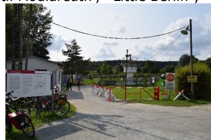
"Little Berlin" - Mödlareuth

14.10 på parkeringspladsen for "Museum zur Geschichte der Deutschen Teilung". Efter en velfortjent rejse-øl gik vi over for at se Mödlareuth, hvor der er genrejst mur og restaureret nogle af de gamle effekter fra delingen af Tyskland. For dem som ikke kender til Mödlareuth / "Little Berlin", så er det en landsby, hvor der løber en lille bæk, som er grænse mellem Thüringen og Bayern og dermed var grænse mellem DDR og Vesttyskland. (Mit første kendskab til byen var i forbindelse med en ZDF-serie " Tannbach " som DR viste på dansk fjernsyn for et par år siden – Lige siden har det været et stort ønske at se byen. Du kan se mere her: www.museum-moedlareuth.de – Stedet ligger tæt på A9, som mange tager på bilferie mod syd, så hold en pause og lad historien give dig en oplevelse.) Som sagt parkerede vi Camperen på parkeringspladsen, hvor flere Campere kom til for at overnatte. Vi brugte eftermiddagen og aftenen på at udforske byen og området, og kunne gå i seng med en stor oplevelse og eftertænksomhed om, hvordan historien kan ramme forskelligt, bare i en lille landsby med 50 indbyggere. Her var nogen heldige og andre uheldige, alt efter på hvilken side af bækken de boede. Og så var der dem der flygtede eller prøvede, og dem der blev taget / skudt var de rigtig uheldige – Skrækkeligt at tænke på. Må noget lignende aldrig ske!