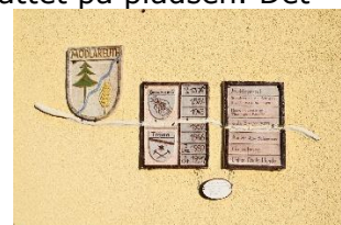
Opdeling på husmur

Da vi vågnede, kunne vi se, at der var 9 andre campere, som havde overnattet på pladsen. Det var den flotteste morgen at vågne op til med skyfri himmel og solen der var stået op og skinnede ned til os. Efter morgenmaden kunne vi kl. 09.20 i høj sol og 16 °C køre ud fra pladsen, mens tankerne om fortiden, for ikke ret længe siden, rumsterede i hovedet. At mobilsignalet var væk i Mödlareuth havde nok forstærket vores følelse af, at være tilbage i tiden. Vi kørte op mod Juchhöh, og der var igen signal på vores telefoner. Oppe på toppen drejede mod Gefell og fulgte de mindre veje mod