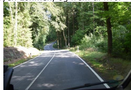
Vejen mod Bastei

borgen "Königsstein" og nogle af toppene fra "Bastei". Nu kribledede det lidt, for vi var "brændt af" 2 gange og skulle 3. gang være lykkens gang, at vi fandt en plads for natten? Vi drejede fra Autobahnen og ned mod Pirna, som ligger ved Elben, som vi kørte over og blev ledt gennem byen Lohmen, og frem til hvor vejen mod Bastei starter. Her skulle være en Camperplads, så vi drejede ind på parkeringen, men kunne ikke få det til at passe med, at der skulle