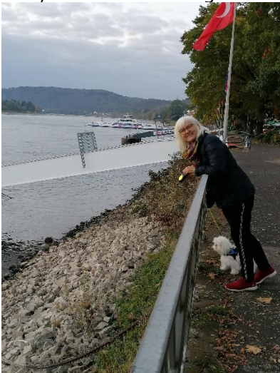
PyHa Her fandt vi plads for natten

Vi var enige om, at stå tidligt op, så vi kunne komme ned til Camperen og gøre klar til tidlig afgang. Det lykkedes meget godt, og kl. 08.20 kunne vi i 7 °C køre ud fra IMC, og sætte kursen mod A7. Der var meget trafik i begge retninger, hvilket nok skyldes, at den nordtyske efterårsferie sluttede og den danske lige er begyndt. Vi kom dog gennem Hamborg uden de store problemer, da vi kunne bruge erfaringerne fra sidste tur gennem Elbtunnel og vælge de bedste baner.