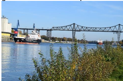
Udsigt over NordOstsee Kanal (NOK)

Det var en flot morgen, da vi stod op i 4 °C. Da vi kørte af sted var det klart vejr og vi kunne se en fantastisk flot rød morgensol komme op over træerne. Fremme ved "det omvendte hus" i Bispingen kørte vi ud på A7, og først ved Seevetal kom vi til første vejarbejde, og det varede til gengæld indtil vi havde passeret Hamborg. Trafikken gled fint mod, og gennem Hamborg, nok mest fordi der var 3 kørebaneer, og at lastbiler havde overhalingsforbud. Det betød at højre spor var fyldt med lastbiler, og at vi andre kunne køre med rimelig hastighed forbi alle lastbilerne.