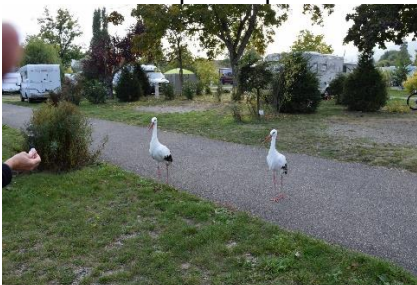
Velkomstkommiteen i Turckheim

Efter dejlig morgenmad gjorde vi klar til at køre videre, og kl. 08.40 kunne vi i 5 °C køre ud fra Camperpladsen og sætte kursen ad B9 langs Rhinen mod Bingen. Vi havde nogle flotte udsyn over Rhinen i det svage morgenlys, hvor disen hang over bjergsiderne. Ved Bingen kørte vi over på A61, hvor vi var heldige med at der var overhalingsforbud for lastbiler. Der var dog en god trafik, måske fordi de i delstaten lige var begyndt på efterårsferien, ligesom i Danmark. Senere drejede vi over på A65 og ved sidste by før grænsen, Kandel drejede vi af for at finde en tankstation, der havde bedre priser på diesel end Autobahnens 1,889 €. Midt i byen lå en lille tankstation, hvor en tankvogn var ved at fylde diesel så tankene, så vi fik fyldt på til 1,529 €, og med 50 ltr var der 18 € sparet. (135 kr. – vanvittig på en ½ tank).