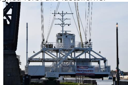
Svævefærgen starter snart???

Meistere", hvor der kun var 2 ledige pladser i 3 række. Vi nød udsigten ud over Nord OstSee Kanal og over mod Rendsborg, og gik en lille tur inden frokost. Efter frokost gik vi en tur ud til Jernbanebroen, for at se på hængefærgen, som var kommet på plads under broen, men endnu ikke var i drift. Tilbage til Camperen nød vi solen og udsigten mod NOK og fik et glas hvidvin fra Alsace. Da solen forsvandt og det blev køligere, trak vi indenfor og nød resten af dagen.