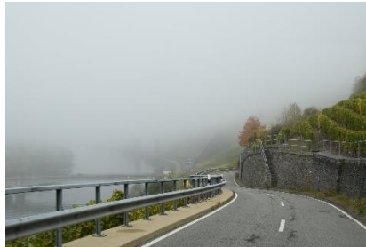
Vi kører gennem tågen