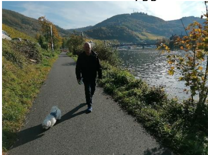
Gåtur langs Mosel

ring i solen var fyldt med mennesker, som nød en kop kaffe, et glas vin eller en øl. Vi fik igen fotograferet huset med skiltet, som er højaktuelt i Danmark i disse dage: "BEIM WEIN IST ES, WIE IN DER POLITIK, MAN MERKT ERST HINTERHER, WELCHE FLASCHEN MAN GEWÄHLT HAT." (Husk det når I går til kommunevalget i november.) Efter turen rundt i Bernkastel gik vi tilbage til Camperen, hvor vi nød et koldt glas lokal Moselvin fra vinskråningen der hedder "Himmelreich". Efter lidt let aftensmad hyggede vi os i Camperen, til det blev sengetid.