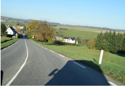
Stejlt ned ad i landsbyen

Vi stod op til skyfri himmel og 2 °C. Efter morgenmad kunne vi kl. 08.10 vinke farvel til receptionen og køre ud til motorvejen N83, hvor vi drejede mod Strasbourg. Bilens udtermometer viste -1 °C og vi kunne se, at markerne flere steder var helt hvide af rimfrost, og der var meget diset ud over markerne. Ved Selestat kørte vi over på A35 og flere steder kunne vi se store stå i det lave vand i regnvandsbassinerne, nok for at fange frøer. Fremme ved Obernai drejede vi over på D500 og senere over på D422, som vi fulgte frem til Saverne. Undervejs så vi også her store på jagt.