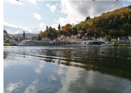
Krydstogtskib på Mosel

jeg udtalte vinnavnet forkert, men skidt vinen smager godt. Kort efter Kröv kunne vi dreje fra B53 ind mod Rissbach og kort efter ned mod Mosel og "Moselstellplatz Traben-Trarbach", hvor vi parkerede Camperen. Efter middag begyndte der at komme huler i skyerne, og vi kunne gå langs Mosel ind til Traben-Trarbach og ad broen over Mosel. Efter at have gået lidt rundt i Traben, kunne vi gå tilbage over broen til Trarbach og nyde solen på vej tilbage til Camperen. Nu var det tid til at nyde et koldt glas vin og slappe af resten af eftermiddagen. Senere startede vi den elektriske pande og kunne nyde Pasta med Gyros til aftensmad og slappe af, indtil vi gik til køjs for, at være friske til morgendagens etape mod nord.