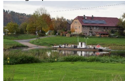
Kabelfærgen over Weser

Det var stadig mørkt, da vi kørte ud fra Moselstellplatz Traben-Trarbach i 10 ° C og kørte ad Vinruten til Enkirch, hvor vi drejede fra for at køre op over Hunsrück. Det begyndte at lysne, mens vi kørte gennem de mange kurver op gennem skoven mod den store flyveplads Hahn. Her kørte vi over på Hunsrück Hohenstrasse, som vi fulgte gennem store vidder, marker med høje vindmøller og skove hvor træerne var "trukket i fantastisk flotte farver". På et længere stykke var det også på Deutsche Alleen--strasse. Kort før Koblenz kørte vi over på A61 og over højbroen over Mosel, med en flot udsigt ud over Mosel og vinmarkerne. Efter Kreuz Koblenz kørte vi over Rhinen, og senere over på A3, som vi fulgte til Limburg, hvor vi drejede fra for at køre Bundesstrasse B49 mod Giesen, hvor vi flere gange skiftede veje, inden vi kom over på B3 mod Kassel. Her kom vi igen på Autobahn, indtil vi drejede fra for at køre gennem nogle hårnålesving ned til Hann. Münden. Her kunne vi følge mindre veje langs Weser, indtil der ved Oedelsheim var