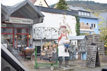
Nackt-arsch, derfor vinens navn

Efter en god nats søvn stod vi op, så vi kunne nå at hente morgenbrød ved bagerbilen, som kom på pladsen kl. 08.00. Da vi lukkede døren op, for at gå til bageren, blev vi noget overraskede, for der var slet ingen tåge over Mosel, og temperaturen var oppe på 11 ° C. Der havde været et skydække, som havde holdt på varmen, som en dyne over os. Da vi kørte kl. 09.40, valgte vi at køre tilbage til Bernkastel-Kues, for at handle i Lidl, som ligger i bydelen Kues. Da vi kom over broen, blev vi mødt af vejarbejde, så der var omkørsel. Ja, så fik vi da også set Kues. Efter at have handlet vand og brød, fulgte vi Mosel og på vinruten kom vi bl.a. gennem Kröv, hvor vi kender vinen "Kröver Nacktarsch". I byen står figurer af en mand, som slår en knægt i den bare ene med en kæp – Derfor Nackt – Arsch. Det gik først op for mig i dag, at