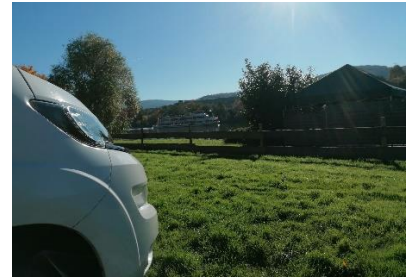
Udsigt til Mosel