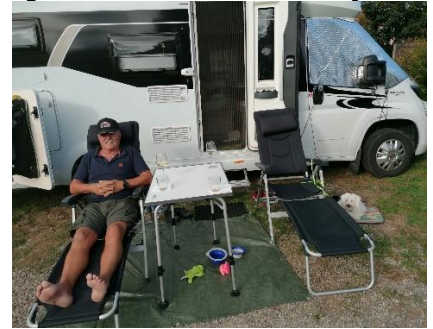
Afslapning i solen ved Camperen