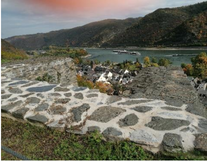
Udsyn over Bacharach fra gåturen

Dagens etape: 92 km. Turen indtil nu: 765 km.