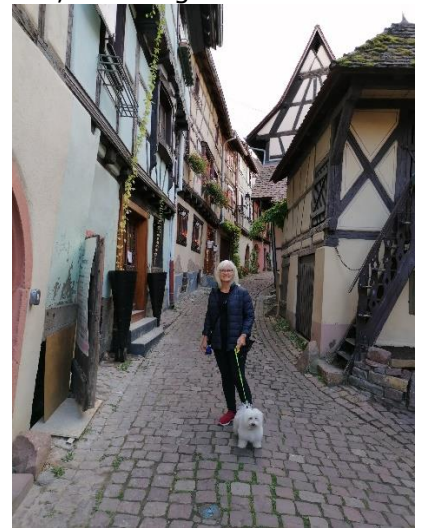
Gåtur i Eguisheim

Vi havde den korteste etape foran os, så vi tog den med ro med morgenmaden. Det var en dejlig morgen med lyst og lunt vejr, og vi kunne se 2 storke sidde og knebre på reden ved campingpladsen. Ovre på stadion sad der også en stork på en af de store lysmaster. Kl. 10.20 kunne vi i 16 °C køre ud gennem bommen, og satte kursen mod næste stop. Vi valgte ikke at følge GPS'en, men tage den mindre vej, langs vinruten, igennem Wintzenheim. Ved Eguisheim kørte vi i udkanten af den gamle bydel og fandt let frem til "Camping Des Trois Châteaux" hvor vi kl. 10.45 i 19 °C, kunne parkere Camperen på plads 72. Vi sad og nød solen, indtil vi midt på eftermiddagen gik en tur ind i Eguisheim gamle bydel, hvor vi fik købt "Alsacepølser" og et "Paine", inden vi gik tilbage til Camperen hvor vi slappede af resten af dagen.