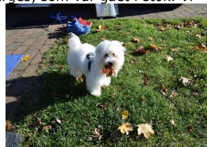
Boris nyder at være fremme

I Burgdorf fik vi tanket diesel, og måtte igennem en mindre omkørsel, inden vi var på rette spor igen, ud over Lüneburger Heide og en flot natur med majs og asparges, som var gået i stok. Vi kørte igennem Bergen, som kendes fra WW2 og KZ lejren Bergen-Belsen, og her ligger en stor militær kasserne. Det var i øvrigt også her SS, som passede KZ-lejren havde hjemme under WW2. Kort efter drejede vi af mod Wietzendorf, og snart kunne vi dreje ind på "Wohnmobilstellplatz SüdSee Camp", hvor vi parkerede Camperen i sol fra en skyfri himmel kl. 12.30. Vi nød frokosten foran Camperen i 14 °C, dasede lidt i solen indtil vi hen ad eftermiddagen gik i bad og senere nød et par lækre Pizza på terrassen foran restauranten "Pier One". Tilbage ved Camperen nød vi resten af dagen og aftenen indtil sengetid.