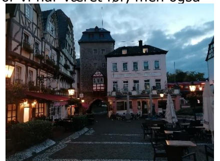
Linz am Rhein, Flot og hyggelig by