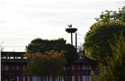
Camping Storkene i Turckheim

Dagens etape: 10 km. Turen indtil nu: 1.067 km.