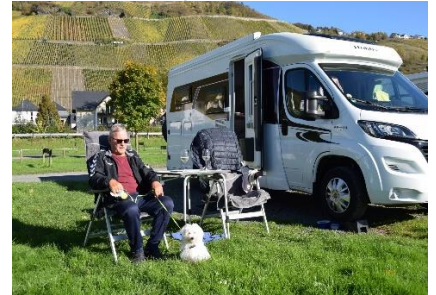
Hygge i solen

forskellige Autobahner kunne vi i Kreuz Saarbrücken køre over på A1 mod Trier / Köln. Der var et par vejarbejder undervejs, hvor kun 1 bane var fri, så vi glædede os over, at det var søndag og derfor ingen lastbiler på vejene. Ved Mehring drejede vi fra i 11 °C, for at køre ad mindre veje frem til Mosel, så vi kunne følge floden frem til Graach an der Mosel. Det gik ned ad mod Mosel, og vi kunne se ud over et hvidt hav af dis, som lå i dalene under os, Snart måtte vi køre ned igennem disen og efterhånden kunne vi se Mosel, og nu var det, der før havde været dis for os, ændret til at være skyer over vore hoveder. (Som vi var med fly.) Skyerne lettede mere og mere, og vi så en stor flok stære som ved "sort sol", men solen manglede. Efterhånden fik solen mere magt, og flere steder kunne vi køre i sol det sidste stykke frem til "Sun Park" i Graach, hvor solen skinnede, da vi kl. 11.30 parkerede på plads 19 med næsen ud mod Mosel. Her kunne vi se, at skyerne langsomt kravlede op ad skråninger på den anden side af Mosel, og til sidst forsvandt helt, så vi havde en skyfri himmel. Om eftermiddagen nød vi solens dejlige varme og et glas kølig hvidvin i stolene udenfor Camperen. Efter vi havde gået en tur i Graach, kunne vi, inden solen forsvandt bag vinskråninger, nyde aftensmaden udenfor. Da solen forsvandt blev det hurtigt køligere, og vi trak indenfor for at nyde aftenen i Camperen.