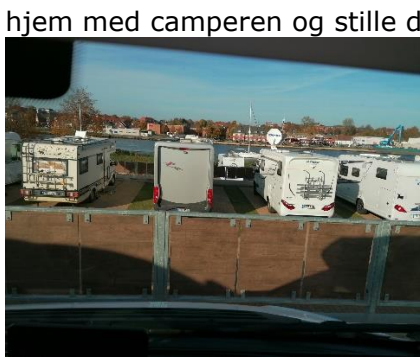
Farvel til NOK for i år