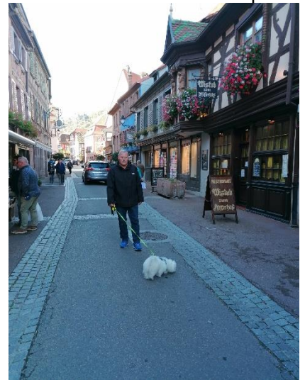
Gåtur i Ribeauville