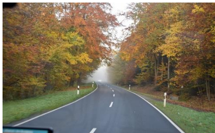
Gennem skovens flotte farver

Dagens etape: 205 km. Turen indtil nu: 1.983 km.