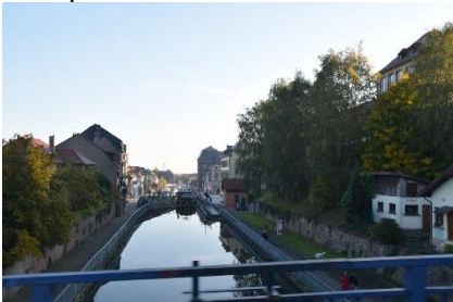
Sluse på kanalen