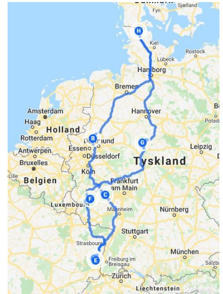
Første udkast til turen