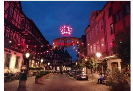
Aftentur i Bacharach

Vi fik en god nats søvn, og vågnede godt udhvilede kl. 07.00. Temperaturen udenfor var kun 5,5 °C, men indenfor var der dejligt lunt. Efter at have nydt morgenmaden og det flotte udsyn til de mange skibe, der sejlede forbi, gjorde vi klar til at tage det sidste stykke mod dagens mål. Kl. 09.15 kunne vi dreje ud på B42 og kørte langs Rhinen ned mod Koblenz, hvor vi kørte over motorvejsbroen til den anden side. Her fulgte vi B9 langs Rhinen frem til Bacharach, hvor vi drejede ind på "Wohnmobilstellplatz Sonnenstrand", og fandt os en plads i første række med "snuden" ud mod Rhinen. Efter lidt frokost gik vi en tur ind til Altstadt, hvor vi fulgte bymuren stejlt opad til vandrehjemmet, som ligger i en gammel borg, højt hævet over Bacharach. Efter en stejl nedgang kom vi ned til et tårn på bymuren, hvor vi kunne komme ind gennem en smal port og videre ind i Altstadt. Vi gik en runde i den flotte gamle by, inden vi gik gennem porten i Marktturm og over til promenaden langs Rhinen, som vi fulgte tilbage til Camperen. Her nød vi resten af dagen med det flotte udsyn over Rhinen.