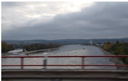
Vi kører over Rhinen

Dagens etape: 376 km. Turen indtil nu: 1.778 km.