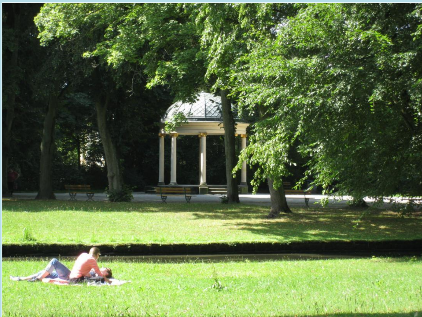
Sommer i byens park.

Wagners bopæl, sponsoreret af hans velgørere, under ombygning. Den ligger op ad byens smukke park. I øvrigt er 2013 Wagners 200 års fødselsår. Derfor gøres der særligt meget ud af ham i år.