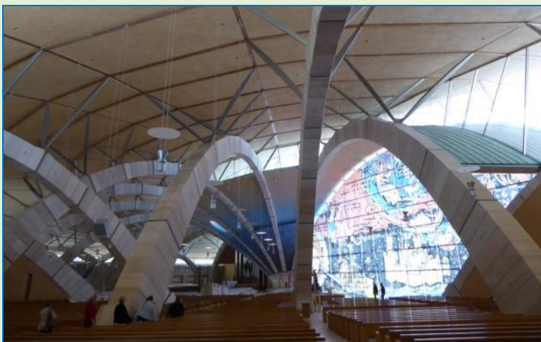
Dette er det indre af en kirke og minder ganske svagt om en edderkop. Meget imponerende.