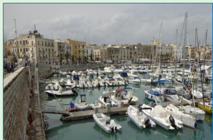
Trani-impresioner: den kunsthistorisk interessante katedral↑, hvor der i begyndende regnvejrs ventes på brudeparret↑↑, og havnefronten.

Efter endt bytur bliver det en Hymer-frokost om bord, inden vi kører videre mod den ovenfor omtalte stellplads neden for Castel del Monte . Man kan vist ikke sige, at den er overfyldt; tværtom. Senere kommer der en camper mere, så er vi da ikke alene.