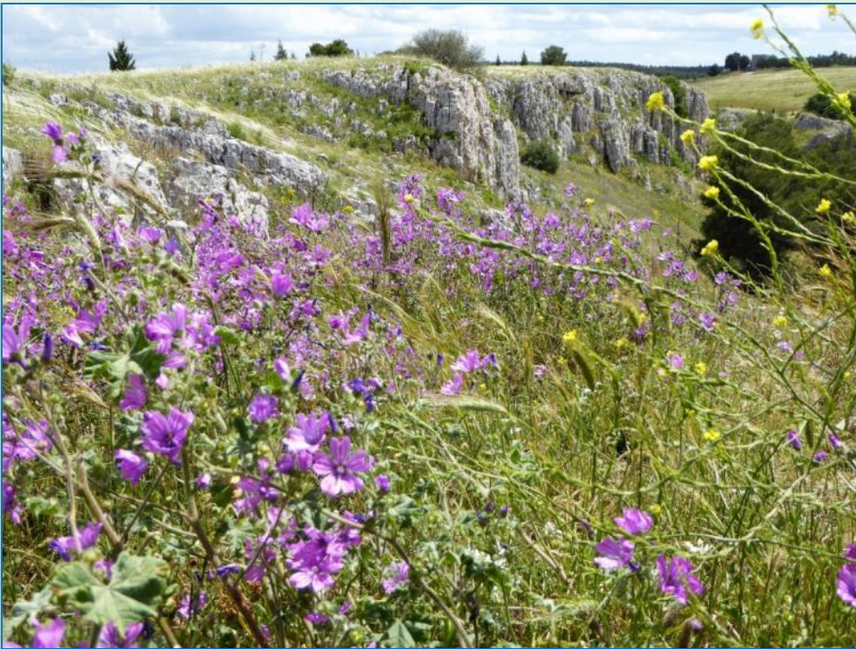
Et frokoststed undervejs: Blomsterhav og smukke udsigter

Efter en nat på stellplads og en lav vandbeholdning stiler vi nu mod en campingplads. Det bliver "dei Trulli" (ACSI), der ligger i cykelafstand til byen. Men at finde frem til den!! Det tager lang tid, inden vi er på rette spor, vi drejer mange forgæves runder, fordi både GPS'en og vi bliver temmelig forvirrede over de mange lukkede veje og forbudsskilte, især rettet mod autocampere.