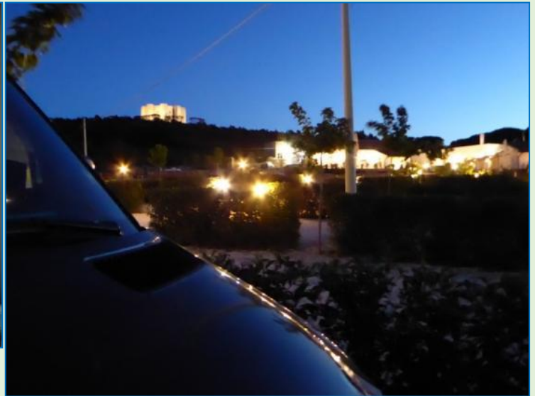
Castel del Monte gennem stuevinduet og efter mørkets frembrud. De andre belyste bygninger er Azienda'ens.

Dagen bød ellers på sightseeing i Trani , en by med to stjerner pga. den romanske katedral og borgen. Flotte er begge dele, om end kirken pga. et bryllup var lukket, og kastelet afstår vi fra, idet vi bliver overrasket af en kraftig regnskylle, som også bevirker, at bryllupsselskabet forføjer sig hurtigt, efter at brudeparret er trådt ud af kirken. Vi har sat bilen et stykke fra den gamle bydel ved havnen – for en sikkerheds skyld bag lås og slå. En stellplads længere inde kan vi ikke finde, selv om der skulle være en. Den er muligvis optaget af personbiler.