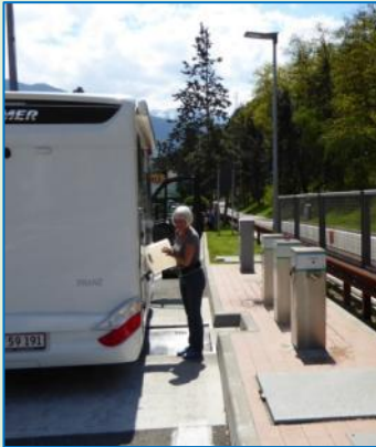
← Tømnings- og påfyldningsfaciliteter i Sydtyrol

Lige efter Brennerpasset ser vi, at der på en rasteplass skiltes med camperservice. Det skal vi da prøve! Og sandelig, her er både til tømning og påfyldning af vand, viser det sig. Senere opdager vi, at der ved mange tank-stationer i hele Italien findes lignende servicefaciliteter for autocampere. Der kan man bare se.