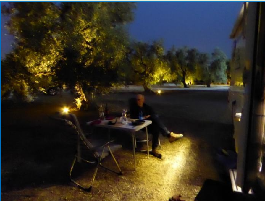
Mørket er faldet på og belysningen er tændt. Spots'ene er nedfældet i jorden og stråler opad, som giver en absolut "speciel effect".

Da mørket falder på tændes pladsens belysning. Det er et tæppe af små spots nedfældet i jorden, som lyser opad gennem de gamle oliventræers glitrende løv. Campingpladsen ligner eventyrland med den smukkeste campingplads-belysning, vi længe har set.