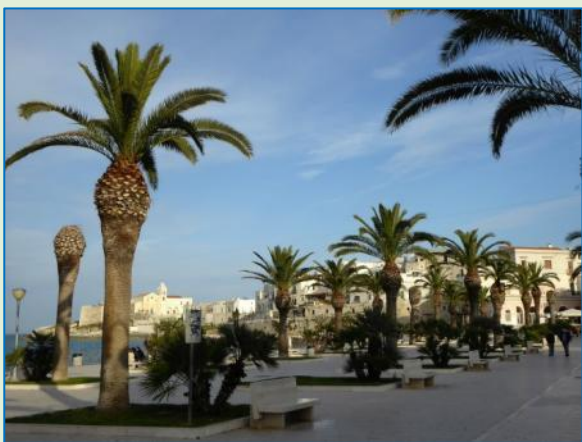
Impressioner fra Vieste. Det er en dejlig by, ikke for stor, ikke for lille, i rimelig gåafstand fra campingpladsen. Smukt beliggende på den kuperede Gargano-halvø med stejle klipper og bjergtagende landskaber.

Igen går dagen med at dase, læse osv. Indtil kl. 16, hvor vi tager os sammen og cykler ind til byen for lidt mere udførlig sightseeing. Vieste ligger på en bakket spore ud til havet. Øverst oppe er et castello (militært område), for foden af det katedralen, der er flot pyntet i anledning af helligdagen og processionen, der senere i aften skal vende tilbage med statuen af jomfru Maria (iflg. vores naboer).