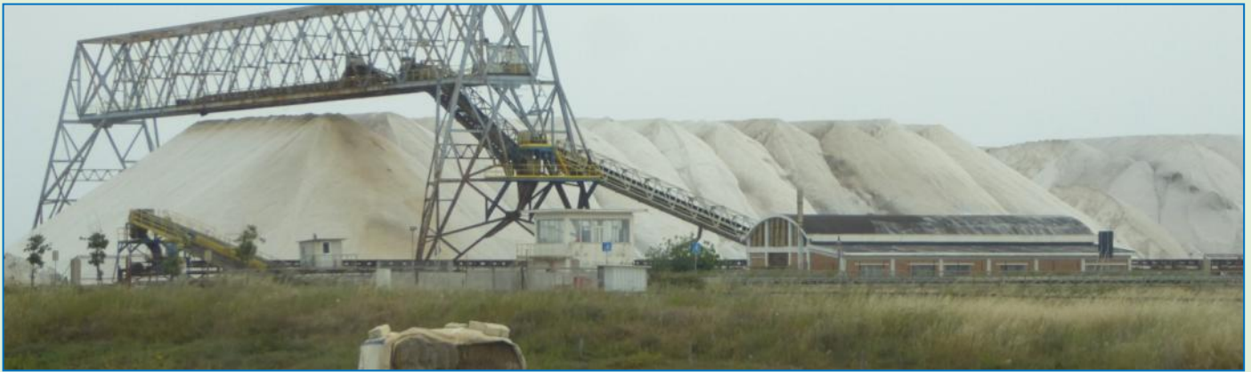
Salt, salt, salt - det er ikke til at forstå, at det på et senere tidspunkt lander rent og kridhvidt på køkkenbordet.

Trani, som skulle være seværdigt, har heller ingen campingplads. Den finder vi så ved den lille badeby Bisceglie . Koordinaterne til den opgivne ACSI-adresse er forkerte, vi krydser lidt hvileløst frem og tilbage i ingenmandsland. Til sidst får vi øje på en ældre herre i vejkanthen, der fægter vildt med armene og gør tydeligt, hvordan vi når frem til campingpladsen. Som er et sympatisk stykke indhegning med gamle oliventræer og derfor også hedder "degli ulivi", og hvor vi får en venlig velkomst. Her er hyggeligt at være. Vejret er imidlertid – og har været det hele dagen – noget