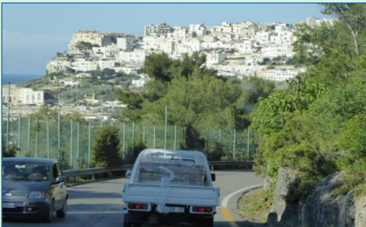
←Vi nærmer os Vieste, en hvid by, der klumper sig sammen omkring en spore ud til Middelhavet. I romertiden hørte denne del af Syditalien til "Magna Graecia", og det er derfor, byerne minder om dem man kender fra Grækenland.

I dag, lørdag, er vi så nået frem til Apulien, turens egentlige mål. Vi begynder med Vieste på Gargano-halvøen. Den sidste del af strækningen hertil er Franz' ilddåb: op og ned ad hårnålesving og meget smalle bjergveje, men heldigvis næsten ingen trafik.