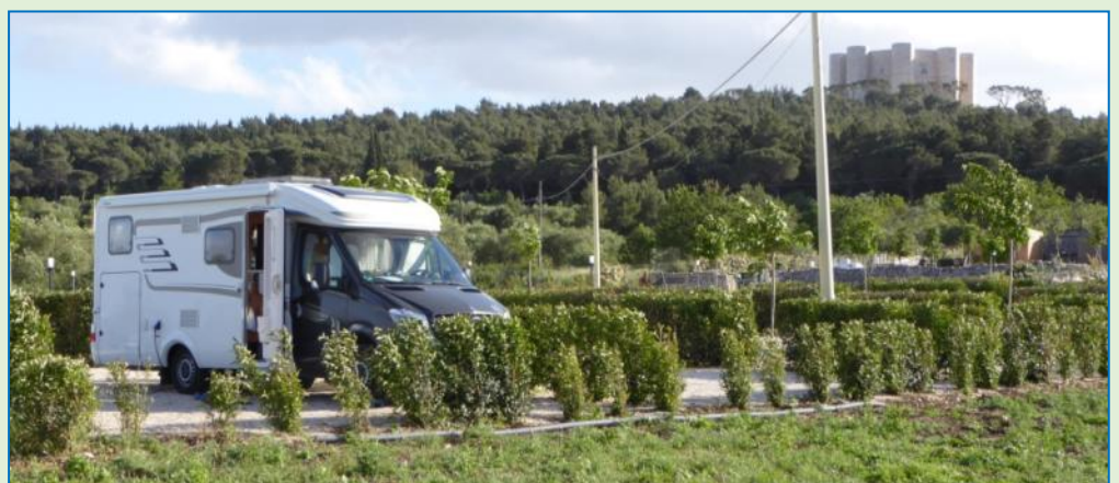
Stellpladsen tæt på Castellet

Nu står vi her på en (campingpladsagtig) stellplads næsten lige neden for Castel del Monte , stauferkejser Frederik IIs mysterieomgærdede ottekantede middelalderbygning fra 1200-tallet og UNESCO verdenskulturarv, der majestætisk knejser over os på en pinjeklædt bakketop. Stellpladsen er tilknyttet en "Azienda" med restaurant, og alt er meget velholdt og stilig men åbenbart stadig i sin vorden. Her er hverken vand eller tømningfaciliteter, selv om de iflg. stellpladsguiden altså skulle være der. Derfor var vi også lidt skødesløse med vores vandforbrug med det resultat, at vandbeholdningen nærmer sig bunden. Men ingen vandhane her, så jeg køber i baren et par dyre 1½ liters flasker drikkevand for al tilfældets skyld.