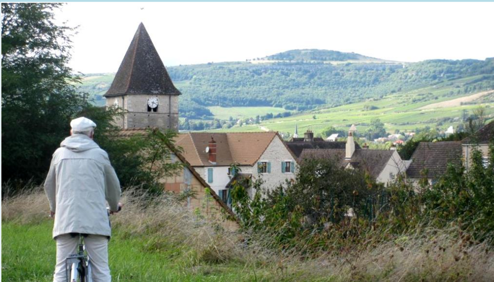
På cykeltur til vinbyen Santenay, hvor vi kommer forbi denne lille by. Landskabet er typisk: blide bakker af moderat højde og vinmarker.