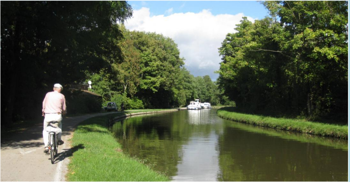
Cykeltur langs Canal du Centre mod Santenay. Kanalbådene kan man leje til at holde ferie på. Dem er der nogen stykker af, det er tilsyneladende en meget populær ferieform.