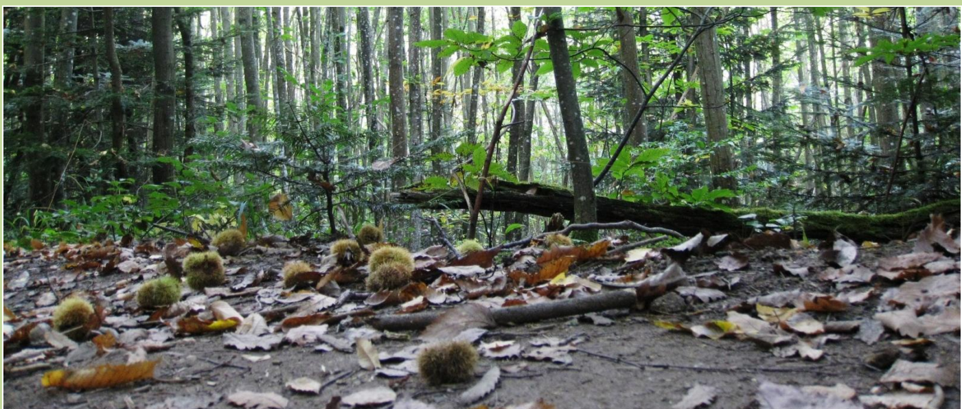
Spisekastanier. De er ved at være modne og pletter fra træerne, hvor det stikkende hylster brister, indeholdende 2 kastanier.