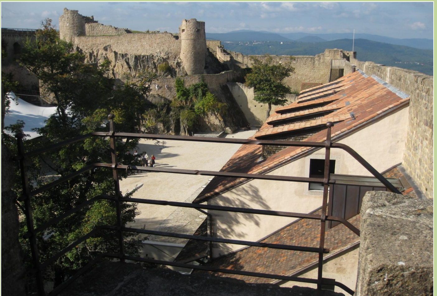
Her er den indre borggård mest rester af borgens tårn- og beboelsesdel i det ene hjørne. Tilbygningen med det skrå tag huser et museum. Nedenfor: Blik mod Colmar