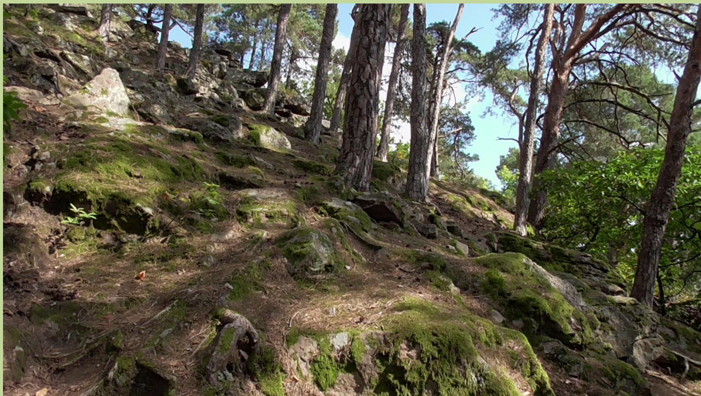
Nu har vi forladt vinområdet og skal gennem skoven. Vejen begynder at blive stejl.