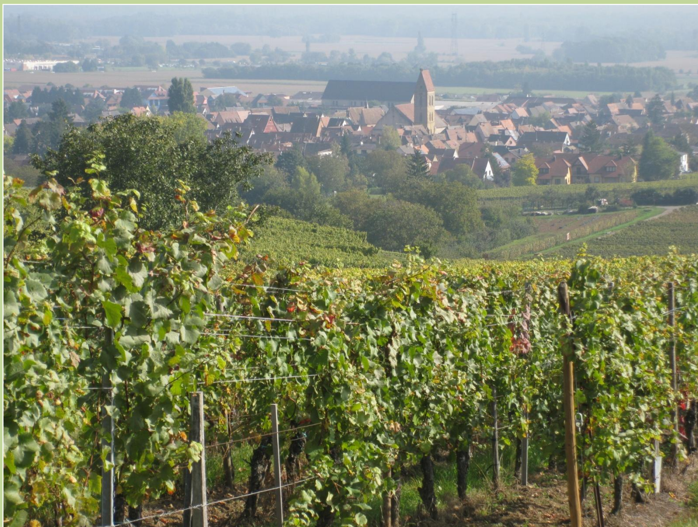
Typisk Alsace - det kunne være hvor som helst i dette velsignede stykke Frankrig. Her: Eguisheim