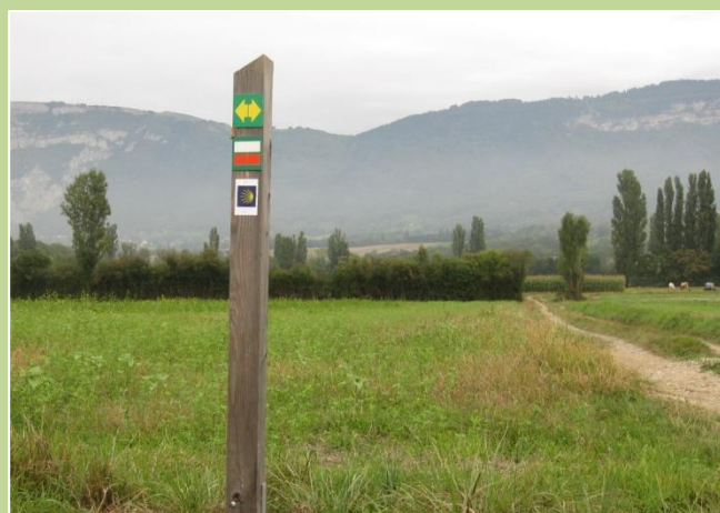
Landskab syd for Genève

Fra vores mellemstop på campingpladsen Les Colombiers i Neydens, ganske få kilometer syd på Genève. Efter en lang køredag trænger vi til at gå en lille tur i omegnen af pladsen. Herfra kan man nå langt omkring - helt ned til Santiago de Compostella i Spanien. Den berømte pilgrimsvej "Camino" går forbi her, som det ses på nederste markering.