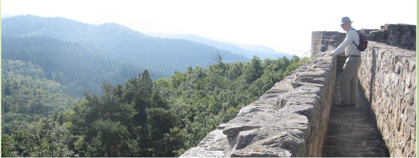
Betagende udsigt ind mod Vogeserne